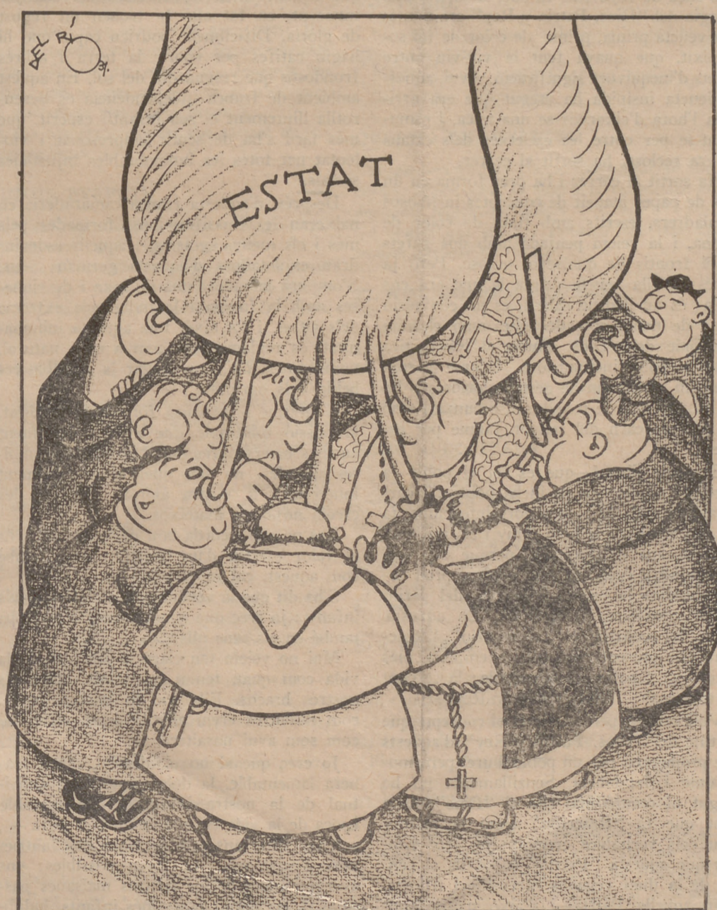
La vaca de l'Estat

—Aprofit m-nos-en, que ja se'ns acaba!..