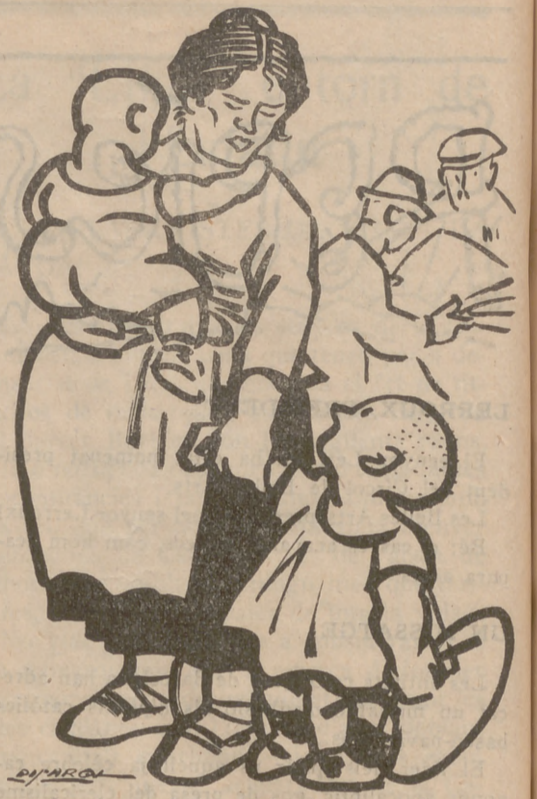
—Que ja no vindran més els reis, ara? —No, fill meu; estan en vaga perpètua.

Demà, diumenge, el poble de Catalunya donarà la seva paraula unànime per a regir-se sola; seran inútils després totes les insidies, totes les venjances personals, car la voluntat del poble ha d'ésser inviolable. El redreçament d'aquesta, la nostra estimada Catalunya, serà el guiatge per als altres pobles ibèrics que vulguin llençar allò fastigós que algú en titula "provincianisme". Cal que els cervells embotits de centralisme esternudin, i s'aclareixin el cap, tornant a la realitat; cal que es purguin aquells imbecils que sempre deposen sobre nosaltres; i cal un restaurador de bronquis ben suau, però enèrgic, que faci escopir tota la bilis arreconada que porta dintre més d'un d'aquests republicans d'última hora... No hem de fer cas de les ximpleries dels Unamunos, ni ens han d'encaparrar les ungues dels Royos Villanuevas, ni les mascarades grotesques d'un "Lacandru" qualsevol..., ja que no ens interessen llurs persones (?) poc ni gaire, per ésser del tot prehistòriques les seves raons absurdes sobre l'assumpte Catalunya, puix ells, titulant-se homes liberals i comprensius, són els més reaccionaris i més unitaristes; aquests senyors (?) volen, segons diuen, crear una Espanya nova a base