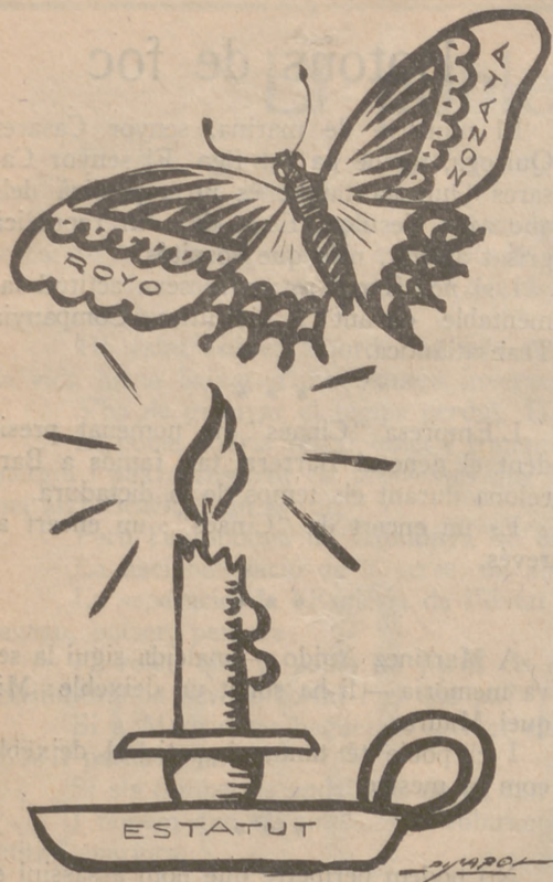
Aquesta papallona no podrà resistir la nostra flama.