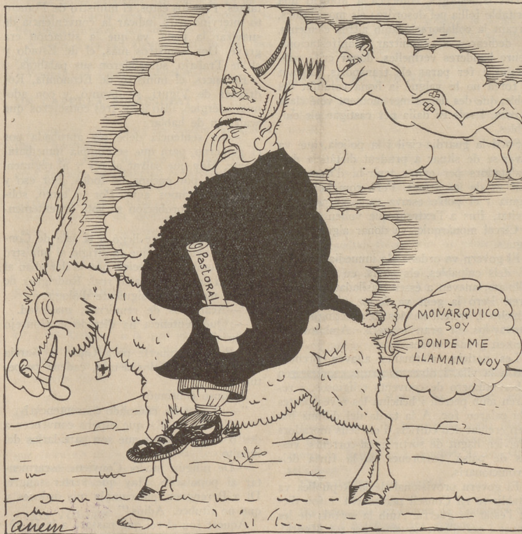
La pastoral del cardenal Segura

I també és intolerable que un home com vós sigui ministre de la República!