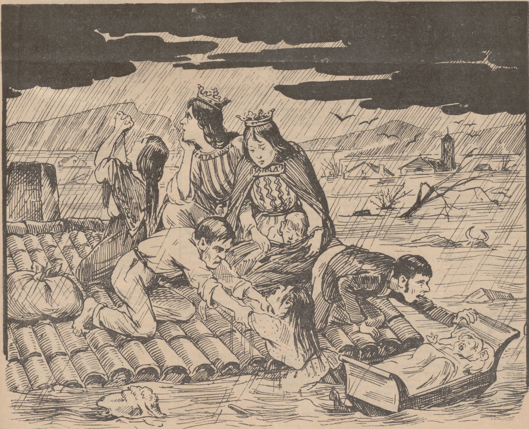
Vaja que aixó ja sembla la liquidació final