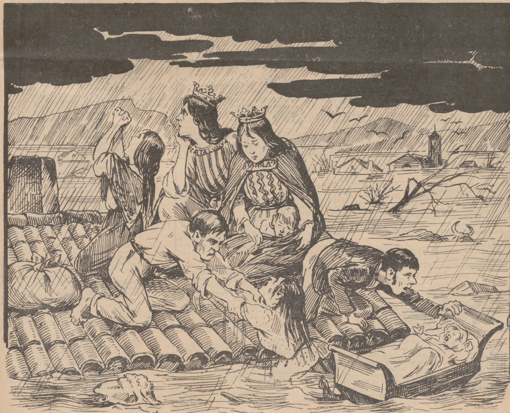
Vaja que aixó ja sembla la liquidació final