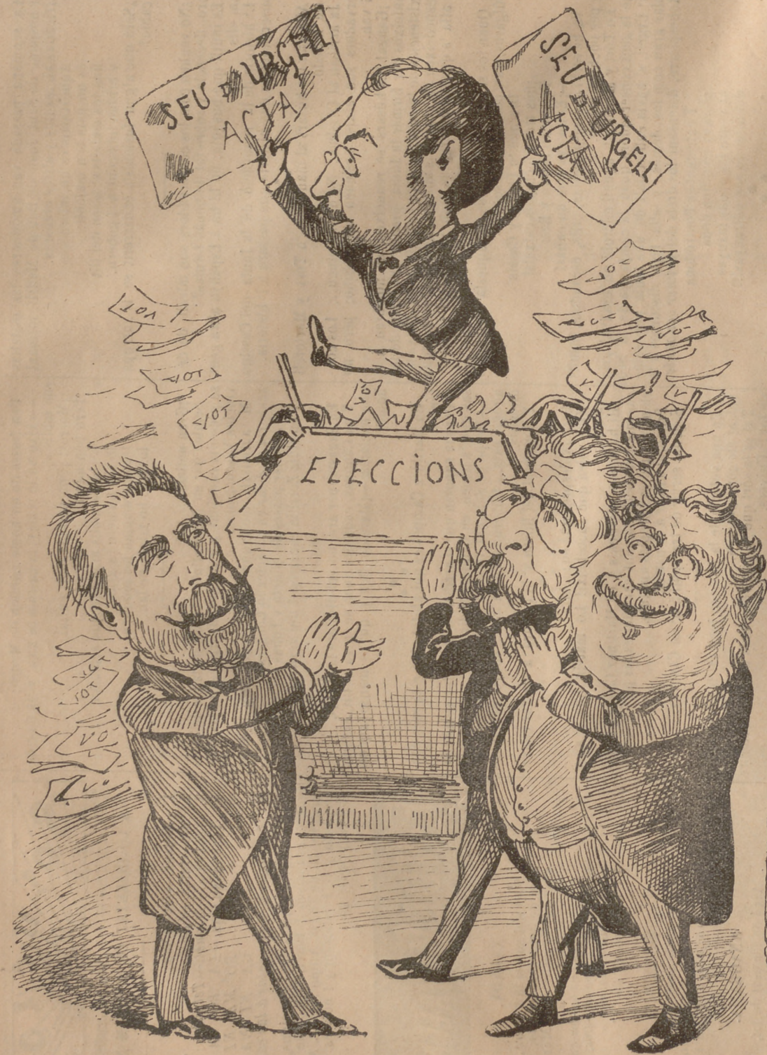
A LA SÉU D' URGELL.

—¡Qu' espavilat! —¡Quin mosquit! —¡Quin xicot més aixerit!