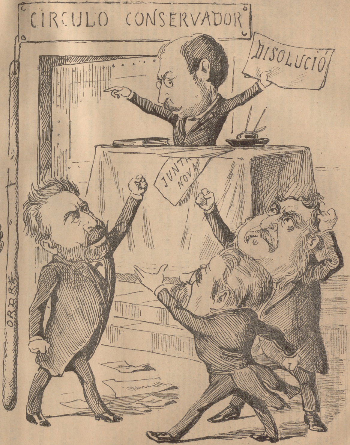
AL CASSINO CONSERVADOR.

—¡Qu' espavilat! —¡Quin mosquit! —¡Quin xicot més aixerit!