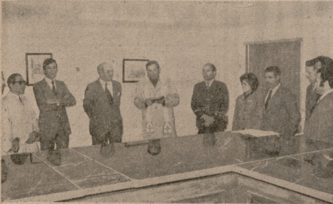
Un momento de la bendición de las oficinas de Herrera.