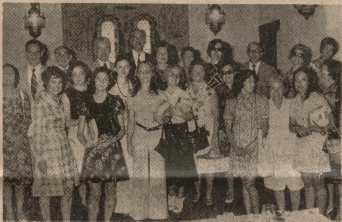
Se celebró ayer el homenaje de la Diputación a las Cátedras de la Sección Femenina, que tan eficaz labor llevan a cabo en nuestras zonas rurales a lo largo del año. De este acto ofrecemos información en 5.ª página.