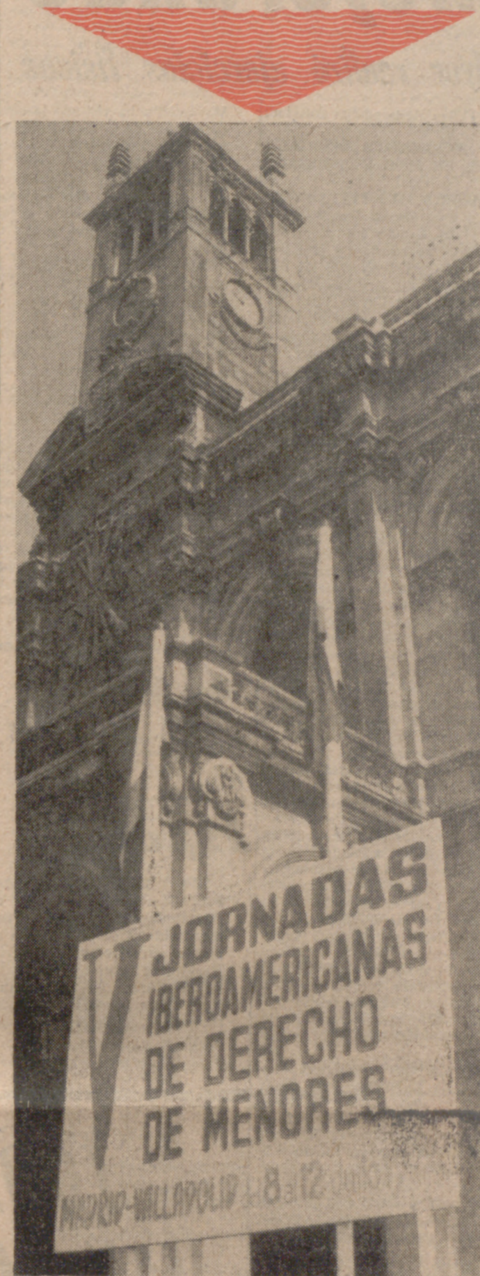
Esta tarde serán clausuradas en Valladolid las Jornadas Iberoamericanas de Derecho de Menores, cuyas sesiones han venido celebrándose durante los últimos días en Madrid. De la rueda de Prensa que tuvo lugar ayer en la Delegación de Información y Turismo sobre este tema, ofrecemos información en quinta página.