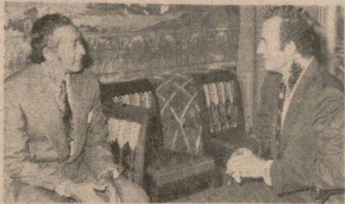
MADRID.—El Príncipe de España recibió en audiencia, en el palacete de «La Quinta», al Ministro de Turismo de Pakistán, señor Rajá Tridev Roy, acompañado del Embajador de su país en Madrid.