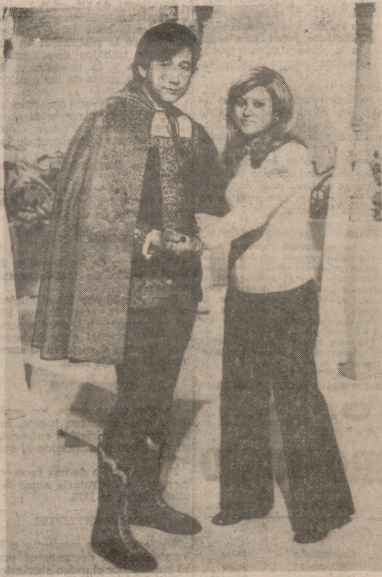
Luis Aguilé, durante la grabación de un programa para el espacio televisivo «Llegada Internacional».