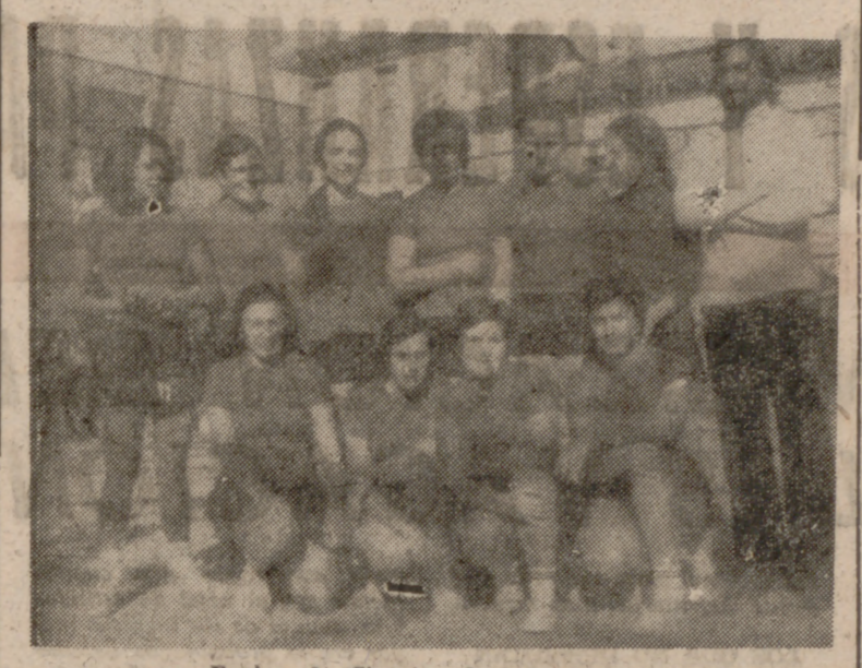
Equipo de Ciencias de baloncesto.

En la competición femenina de baloncesto se consumió la sexta jornada, en la que se dieron resultados normales, si bien el líder no tuvo necesidad de jugar su encuentro programado para anotarse los dos puntos, ya que sus adversarias de Derecho no reunieron más que cuatro jugadoras, perdiendo así por incomparación.