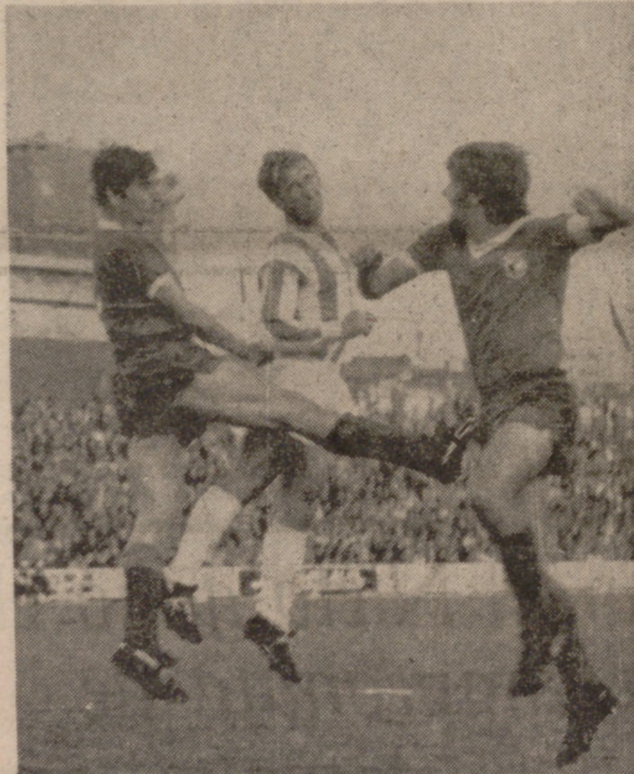
REMATE DE LIZARRALDE. —A poco de comenzar el segundo tiempo, Lizarralde conectó un magnífico cabezazo que salió fuera por poco. Este es el momento, captado oportunamente por Primi Carvajal.