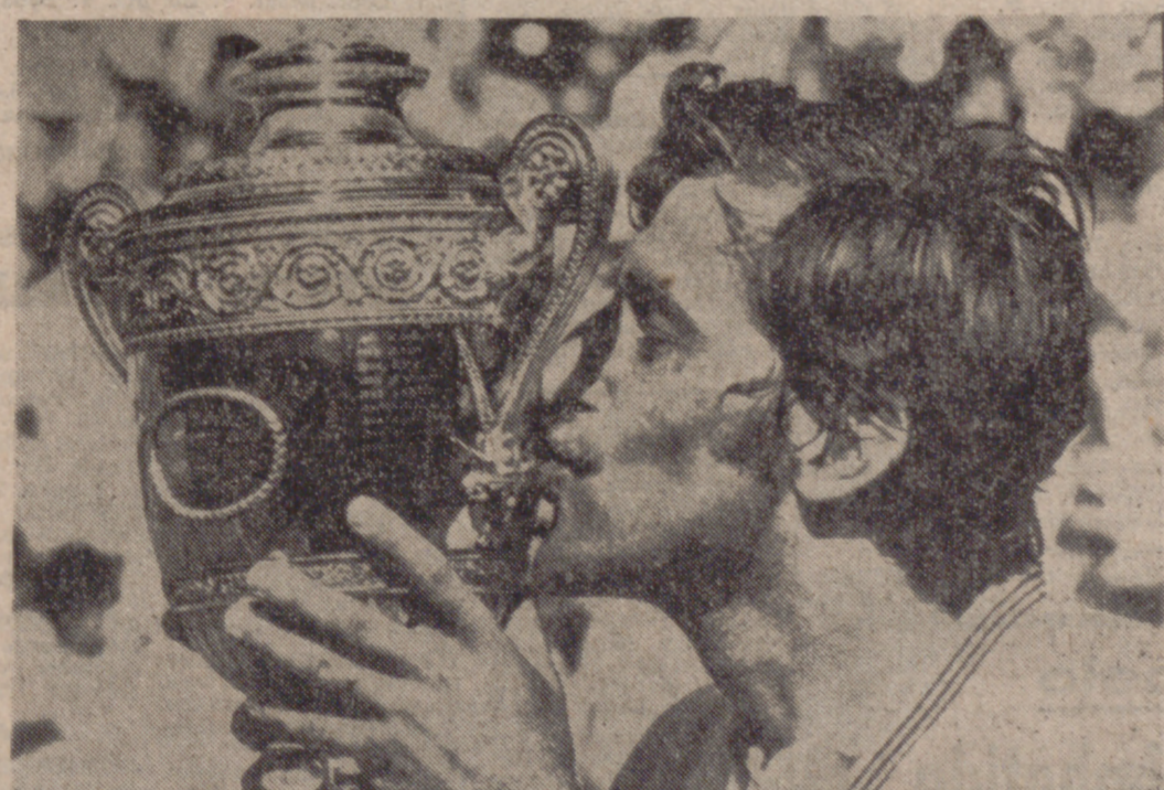
WIMBLEDON (Inglaterra). — Jan Kodes, de Checoslovaquia, besa la Copa después de proclamarse ganador en el «single» masculino de los Campeonatos de Tenis de Wimbledon, al vencer a Alex Metreveli, de Rusia, por 6-1, 9-8 y 6-3.

El sábado se jugaron las finales individuales de Wimbledon, el torneo que ha sufrido este año una crisis histórica por el boicot de la Asociación de Tenistas. Las más famosas raquetas, con algunas excepciones, han estado fuera de la competición y uno de los grandes favoritos, Iliá Nastase, ha tenido que conformarse con un título compartido, el de dobles. Jan Kodes derrotó en la final masculina al ruso Alex Metreveli, con toda facilidad. Antes, la veterana Billie Jean King consiguió su quinto triunfo en el tor-