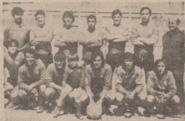
El San Pedro Regalado, que pese a golpear al Instituto Nacional de Colonización, hubo de conformarse con el segundo lugar de la tabla. ¡Otra vez será!