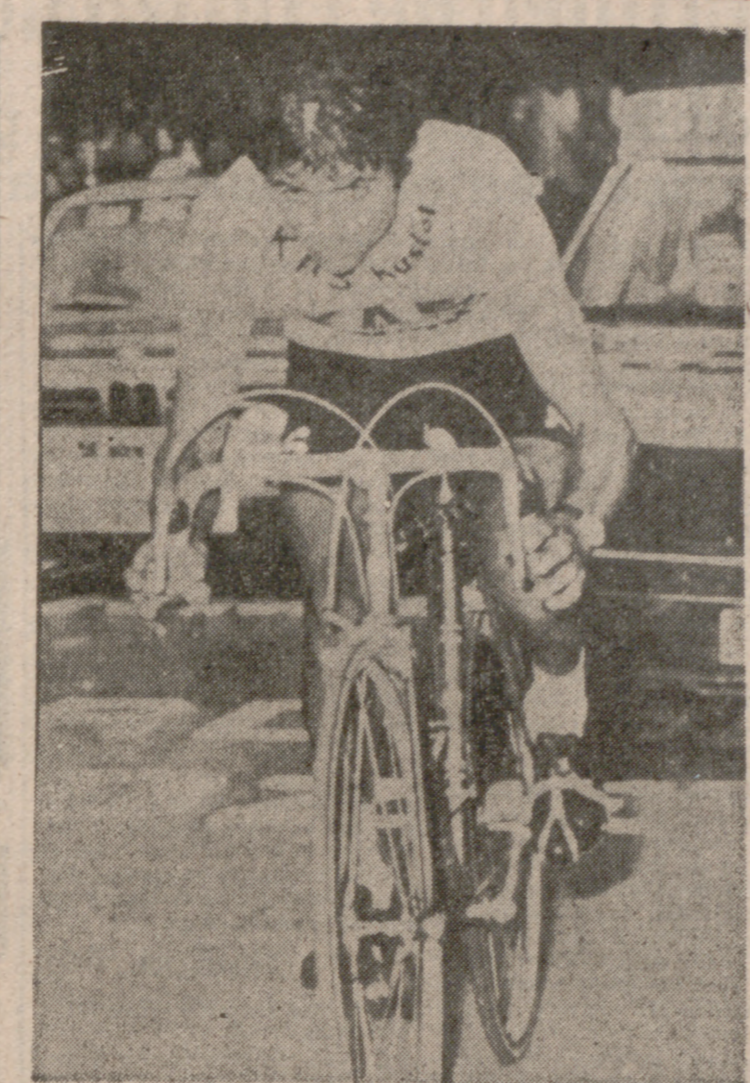
JOSE MANUEL FUENTE

El sábado concluyó el «Giro» en la etapa Auronzo-Trieste, con un triunfo para Merckx, al imponerse en el sprint, tras haber ganado la etapa de pura trámite, y haber demostrado que era de puro trámite, y que existía en el Premio de la Montaña. El triunfo de Merckx, que gracias a la victoria de la etapa de Auronzo-Trieste, le permitió ganar el Giro, fue el primero de un triplete que se le pronosticaba. El sábado, Merckx consiguió arrebatarse al belga el primer puesto en la etapa de Auronzo-Trieste, tras haber ganado la etapa de Auronzo-Trieste, y haber demostrado que era de puro trámite, y que existía en el Premio de la Montaña. El triunfo de Merckx, que gracias a la victoria de la etapa de Auronzo-Trieste, le permitió ganar el Giro, fue el primero de un triplete que se le pronosticaba.