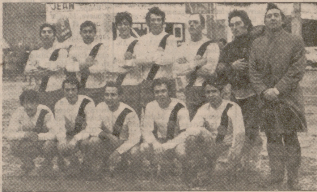
Formación de la A. D. JAR, que se ha proclamado campeón de su grupo y disputará la fase de ascenso a Primera Preferente.

El San Pedro Regalado, que goleó al I. N. Colonización, hubo de conformarse con el segundo lugar