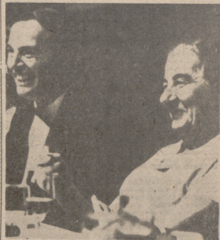
TEL AVIV.—El doctor Christian Barnard asiste alegremente, junto a la primer ministro israelí, Golda Meir, a una cena en el Variety Club de Tel Aviv.