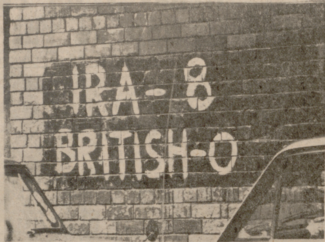
La actual crónica de Irlanda reducida a un continuo match.

ocupado por los que procedían de la ciudad de Londres y adoptó el nombre de Londonderry. Nadie habla de Londonderry en el sur. Predominaban los escoceses. Escocia, unos mil años antes, había sido colonizada por los irlandeses y, por lo tanto, estos colonos escoceses procedían de otro pueblo céltico que tenía el mismo lenguaje, literatura y sistema legal que el de los irlandeses, aunque una religión distinta. Los irlandeses nativos eran católicos romanos, mientras que los colonos, presbiterianos o protestantes (anglicanos). La mayor parte de los habitantes del país continuaron en sus tierras porque los colonos necesitaban esta mano de obra, pero se quedaron en condición de arrendatarios en vez de disfrutar de la propiedad. Hacia 1641 los irlandeses se rebelaron y establecieron un Parlamento Nacional en el bello Kilkenny, antigua capital cerca de Dublín, que pretendía conseguir no solamente la independencia, sino una total libertad de conciencia y religión. Este alzamiento nacional fue brutalmente aplastado por Oliver Cromwell en 1649. Las matanzas de Cromwell solo pueden compararse en Irlanda a las pestes de la gran hambre del siglo pasado, cuando la población fue diezmada en una época de sequía, donde los productos de las fértiles tierras de Irlanda eran enviadas a la corte de la reina Victoria y luego tiradas al Támesis.