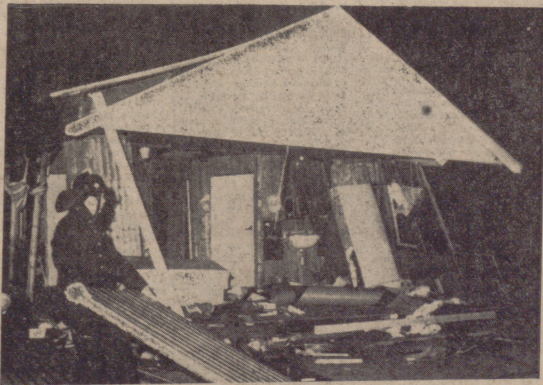
AMSTERDAM.—Una fuerte tempestad se abate sobre Holanda, causando grandes destrozos. En la foto, los bomberos retiran los restos de una casa de madera desmantelada por la fuerza del viento, en los alrededores de Amsterdam.