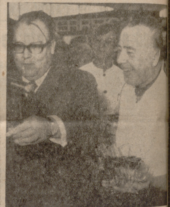
Entre una auténtica nube de fotógrafos, medio en broma y medio en serio, el ministro federal de Agricultura, Alimentación y Bosques de Alemania, señor Ertl, trata de explicar al venecador jerezano en el arte de escanciar una copa de jerez.

Todas estas cosas las he podido comprobar en unos días de viajes. Unos días llenos de esencia alemana y rodeado de rostros duros, recios, ininteligibles, pero demostrativos de un sentimiento de admiración, para entender lo cual no hace falta saber idiomas.