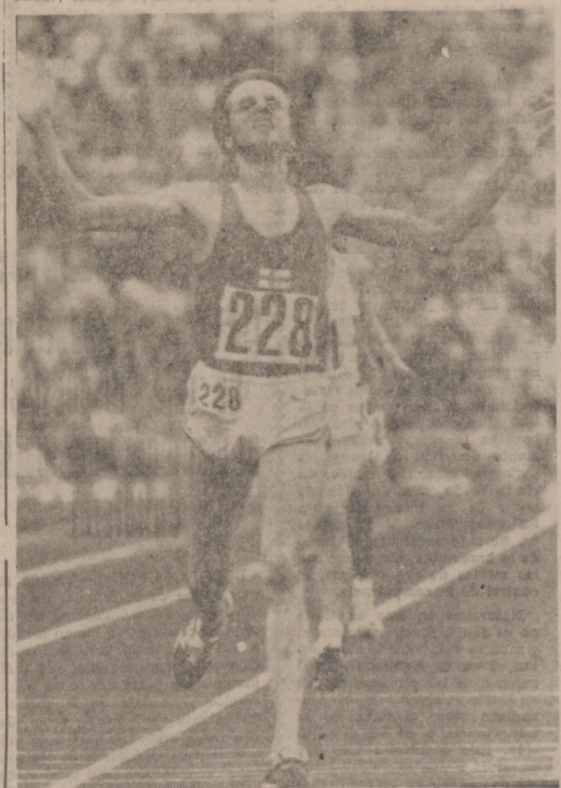
MUNICH.— El finlandés Lasse Viren llega vencedor a la meta, tras recorrer 50.000 metros, 24 vueltas al estadio, en 27 minutos, 38,4 segundos, batiendo el récord de esta distancia, establecido hace siete años por el australiano Ron Clarke.