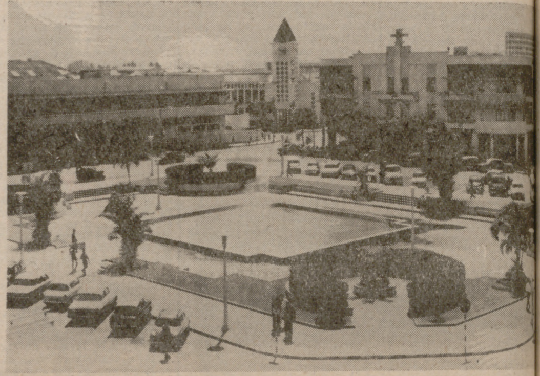
La Plaza del Ayuntamiento, de Beira.

ta de Neutel de Aboer, una morada austera y fuerte con azulejos que nos decoraron la biografía del Santo Condestable nos deben informar, a los periodistas nórdicos, landeses suizos, alemanes norteamericanos acerca de guerra psicológica y de frentes de infiltración silenciosa, sabiendo de antemano que la mayoría de sus oponentes vienen con sus crónicas tereotípicas y que sus bras inteligentes y sensatas causarán el mismo efecto que al negro del sermón. Un diálogo de sordos y reticentes preguntas, pero no puede impedir que la brevedad, evidenciándose que la ofensiva es oficial, ya que parte de los funcionarios y campamentos protegidos en Zambia y Tanzania naciones que no declararon la guerra a Portugal, sino más bien se sirven de los ferrocarriles y puentes para exportar e importar los ductos esenciales y la maquinaria de equipo, según comprobar en los montes de mineras, automóviles o los vagones japoneses dirigidos sobre raíles mozambiqueños en recepción de Luanda y también, zambiana Nda-