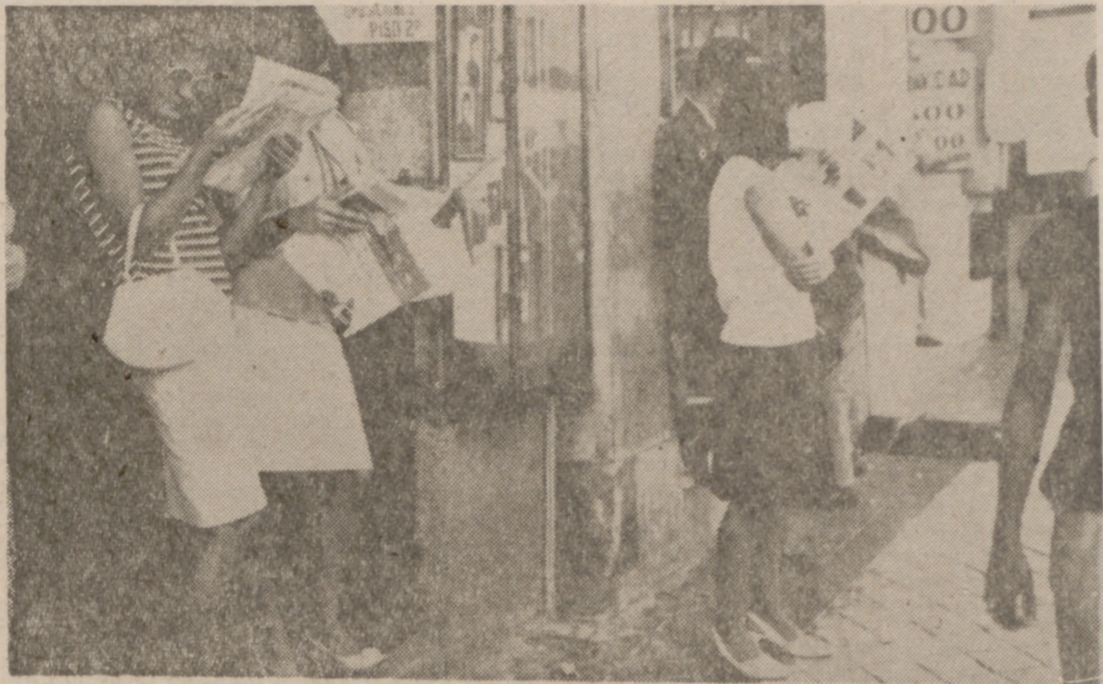
Mientras aguardan tanto como han de aguardar en esta vida, las jóvenes leen literatura ligera, que algunos llaman "tontografía".

Para el pintor resulta difícil su trabajo diario de observar las luces y los colores producidos por éstas en las distintas formas de la naturaleza de la vida. Para el reportero, que trata de desvelar esa misma vida, diariamente en las letras de molde, la misma observación resulta, la mayoría de las veces, dolorosa. En esa mayoría, detrás de una apariencia de formas y colores subyugantes, aparece el drama y la tragedia de unos personajes a la mar de vulgares, que esconden su ruina detrás de un telón de luces sin realidad. Se llega fácilmente a la conclusión de que toda la vida es un gran teatro (ya lo dijo alguien hace mucho tiempo), lleno de positos sin consistencia. Viene esto al cuento de que quiero contar la historia de cómo lee nuestra juventud —una buena parte de nuestra juventud—, mientras viaja en el metro, en el autobús o en el tranvía. Esa que se piensa alegre y convida y que, en realidad, necesita del sueño diario para seguir manteniendo su cara de pasucas cada día.