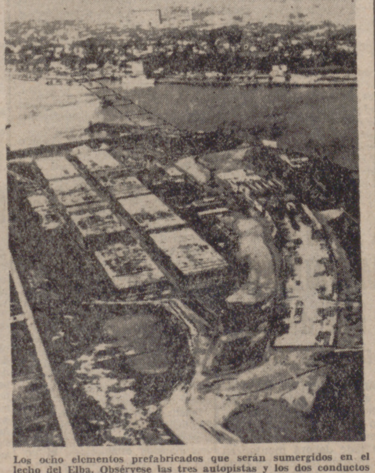
Los ocho elementos prefabricados que serán sumergidos en el lecho del Elba. Obsérvese las tres autopistas y los dos conductos de purificación del aire que hay en su interior.

La ejecución de las obras de la segunda zona del túnel abarcan 1.113 metros de largo de la sección frontal del mismo debajo de la vertiente del Elba, así como las obras para las