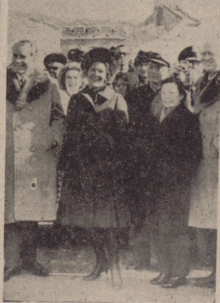
PEKIN.—El Presidente Nixon, acompañado de su esposa y del secretario de Estado, William P. Rogers, inspeccionan la Gran Muralla de China. Al lado de la señora Nixon aparece el jefe adjunto del Gobierno, Li Hsien-Nien, que les acompañó en la visita.