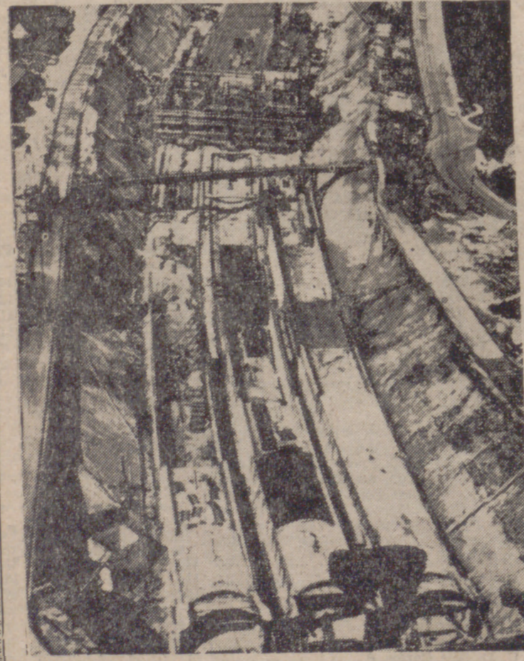
Aspecto del segundo tramo del túnel en su parte no sumergida.

— y II — Una vez terminado el proyecto, el túnel recibirá tres vías separadas entre sí. Se ha previsto que las dos vías exteriores tengan tráfico de calzada única y las vías interiores, direcciones en ambos sentidos. Los tres pares de vías, independientes unas de otras, serán puestas en marcha mediante la construcción frontal del túnel. Solamente al final del recinto de éste se permite una reducida superposición.