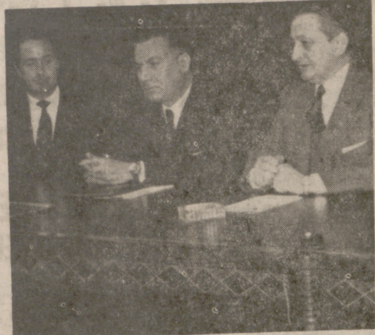
MADRID. — El ministro secretario general del Movimiento, don Torcuato Fernández-Miranda, vicepresidente del Consejo Nacional del Movimiento...