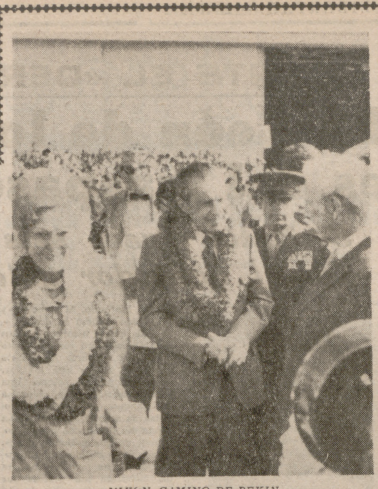
NIXON, CAMINO DE PEKIN