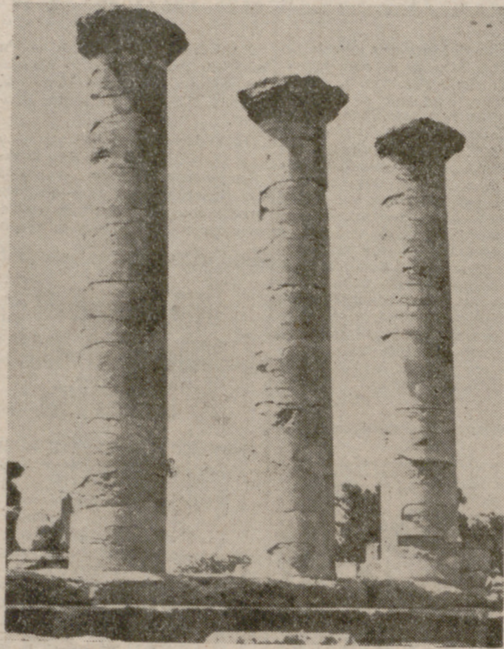
Columnas del templo de Júpiter en el Fórum.

Como todos los emperadores romanos nacidos más allá de Roma, Septimio Severo sintió el deseo de la superación a su obra, frente a la que la metrópoli ostentaba su foro de planta trapezoidal. Fue réplica del que había construido en Roma Triano,