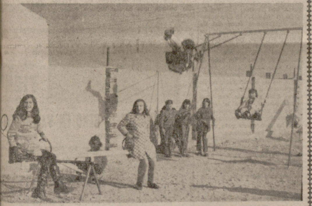
El mundo está lleno de juegos, los niños no al...

INSTITUTO "ZORRILLA" Pruebas de Conjunto La matrícula de Pruebas de Conjunto de Grado Elemental para los alumnos aprobados en la presente convocatoria se llevará a cabo desde mañana al 18. Los exámenes tendrán lugar el día 20, a las once.