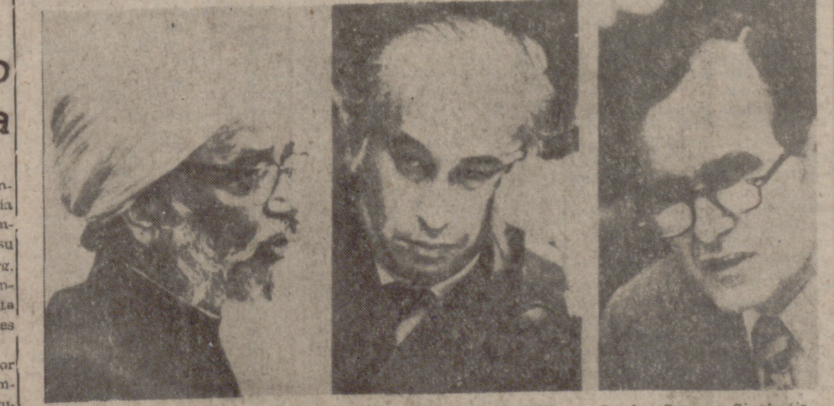
NACIONES UNIDAS. — El ministro indio de Asuntos Exteriores, Sardar Swaran Singh (izquierda), dijo ante el Consejo de Seguridad de la ONU que el Gobierno de su país ha indicado su deseo de aceptar la orden de cese de fuego de las Naciones Unidas en la guerra indo-pakistaní. El embajador de los Estados Unidos, George Bush (derecha), durante la misma sesión, presentó una resolución pidiendo el cese del fuego en el conflicto del subcontinente asiático. Zulfikar Ali Bhutto (centro), ministro de Asuntos Exteriores en el reorganizado Gobierno pakistaní del Presidente Agha Mohamed Khan, declaró haber recibido nuevas instrucciones de su país, que desca estudiar.