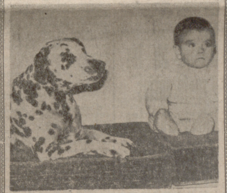
BILBAO.—Una gran familia bilbaina posee un perro dalmata que atiende por el nombre de "You", al que sus propietarios le han enseñado algunas palabras, que el can repite. Este animal, que puede considerarse como un caso excepcional, forma frases como "a mamá", "mamá" y "mamá". En la fotografía, "You", junto a un nieto de la familia propietaria.

Con asistencia del Delegado Nacional de Prensa Hoy, inauguración de los nuevos locales de «La Voz de Castilla»