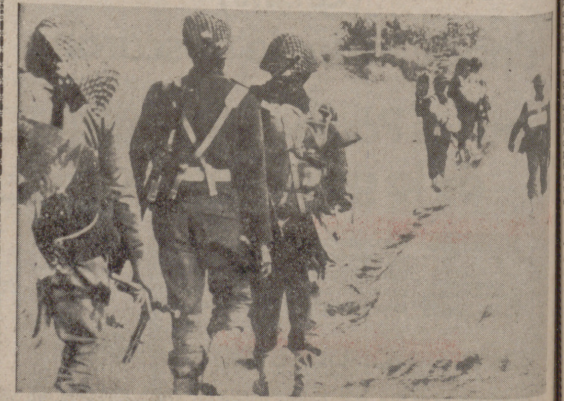
PUKLEAN (Pakistán Occidental). — Tropas indias avanzando a unas diez millas dentro del Pakistán Occidental. Puklean se encuentra a unas 35 millas al noroeste de Jammu. En esta zona tropas del ejército indio y pakistano tuvieron un enfrentamiento masivo con tanques e infantería.