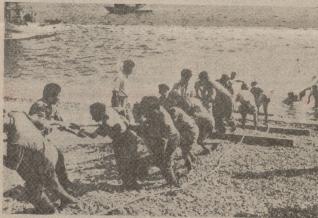
Botar un barco de pesca, una trabajosa operación, al margen del folklore.

110.000 producen al año veintiséis mil millones de pesetas