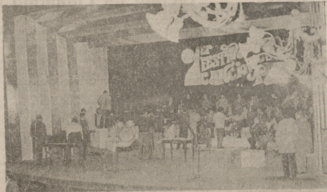
El escenario del Teatro Calderón, ayer, durante el ensayo en el que intervinieron los finalistas del Festival de la Canción de la Paz.

Todo está dispuesto para la primera jornada del Festival. Esta noche el Teatro Calderón se hará cargo de las canciones que hablan de paz y tomará cuerpo el entrañable programa de la emisora «La Voz de Valladolid», merced del mejor de los éxitos.