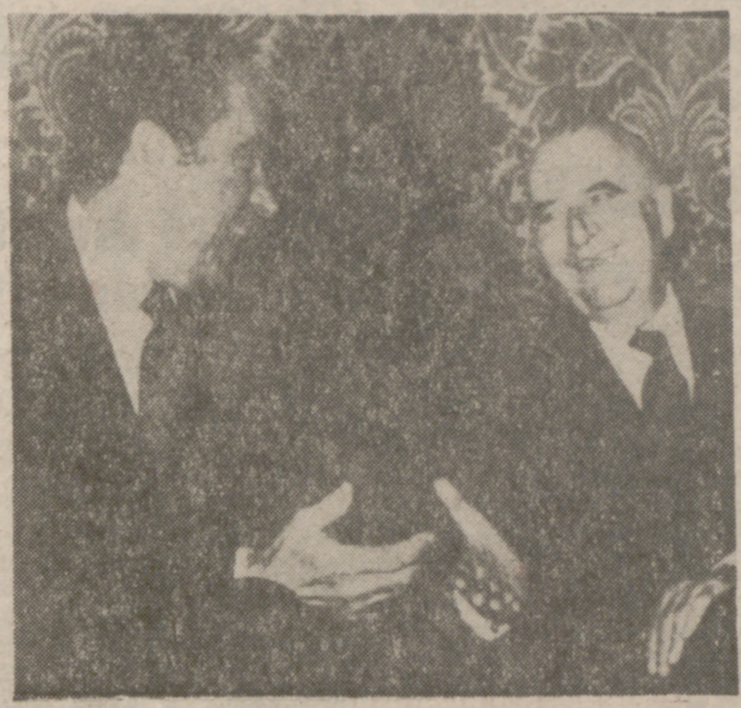
ANGRA (Isla de Terceira, Azores). — El Presidente Nixon, de los Estados Unidos, y el de Francia, Georges Pompidou, durante su primera reunión.

PARIS. (Del corresponsal de PYRESA, ENRIQUE LABORDE.) Las conversaciones Nixon-Pompidou en la isla Terceira se han desarrollado ayer en la primera jornada a lo largo de cuatro horas y media repartidas en una reunión por la mañana y otra a primeras horas de la tarde. Naturalmente, todas las informaciones que llegan de las Azores no pueden ir más allá de las notas de color: descripción del paisaje, relatos sobre la mala pasada del famoso anticiclón, detalles anecdóticos y, en fin, crónicas de circunstancias sobre una "cumbre" que no le ofrece nada noticiable a los periodistas. Las filtraciones, las indiscreciones de las últimas conferencias internacionales sobre cuestiones monetarias, han convertido el Palacio de la Junta General en Angra do Heroísmo en un auténtico "blochaus". En estas condiciones, todo tiene que limitarse a la pura especulación. (Pasa a la página siguiente)