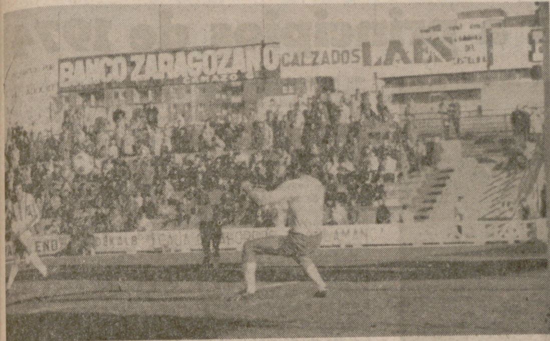
De esta forma consiguió Silva el primer gol europeo, cuando iban nueve minutos. Los otros dos tantos tardarían en llegar.

El árbitro --que anuló dos goles perfectamente legales-- fue el protagonista del encuentro