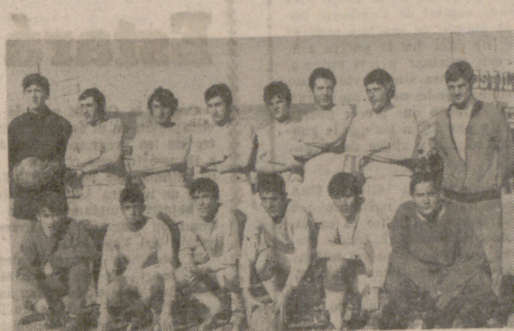
No tuvo suerte el Arces en la final, pese a su constante brega.

El Arces y la G. Medinense habían llegado a la final tras eliminar, el primero, al Circular, Santa Teresa y Ferroviaria, y el segundo, al Rioseco, P. Laguna y Enusa en la ligilla previa, y al Real Valladolid, San Pio X y D. Jar, en la eliminatoria. Los dos tenían justas aspiraciones al campeonato, pero sólo uno podía ser el campeón. En un partido de muchos nervios y de mucho coraje, lo ha sido la Gimnástica Medinense, lo mismo que lo podía haber sido el Arces. Los dos han jugado hasta el límite de sus fuerzas, dando todo lo que tenían y sabían; esto es lo más encomiable de unos muchachos que no tienen más fichas ni más primas que su tremenda afición. Lo mismo que para estos jugadores podemos decir de sus directivos y entrenadores, a quien felicitamos sinceramente desde estas páginas.