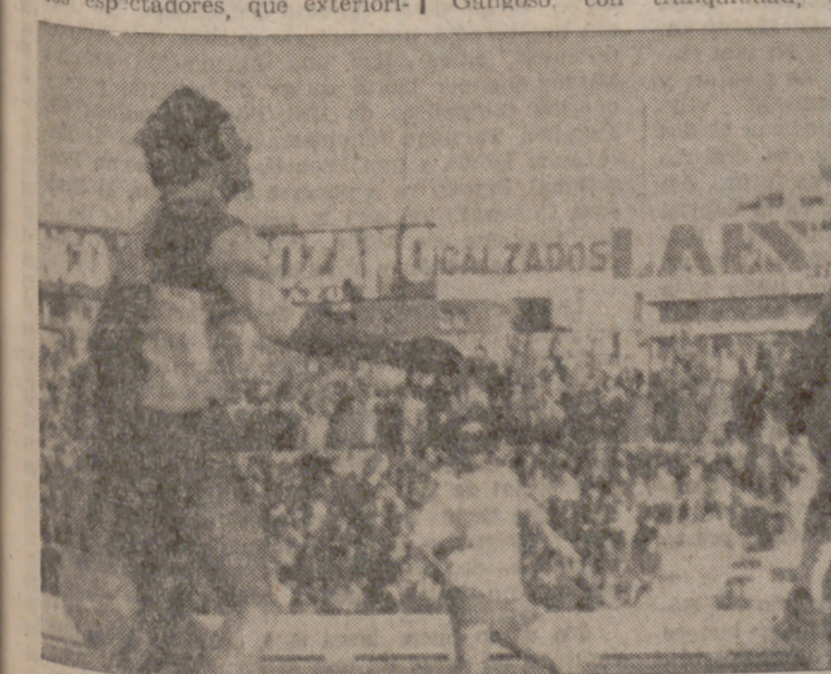
El portero burgalés tuvo abundante trabajo, especialmente en el segundo tiempo. Aquí le vemos despejar apuradamente a córner.

Si va a adelantar, recuerde que no debe marchar paralelo al otro vehículo durante más de quince segundos ni en un recorrido superior a los 200 metros. Por lo tanto, antes de adelantar asegúrese de que su vehículo rueda a la velocidad suficiente para que la maniobra se haga rápidamente.