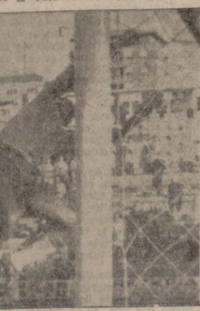
El portero burgalés tuvo abundante trabajo, especialmente en el segundo tiempo. Aquí le vemos despejar apuradamente a córner.

Resultó entretenido el choque que en Iscar libraron el titular y el Cacabense, equipo que luchó