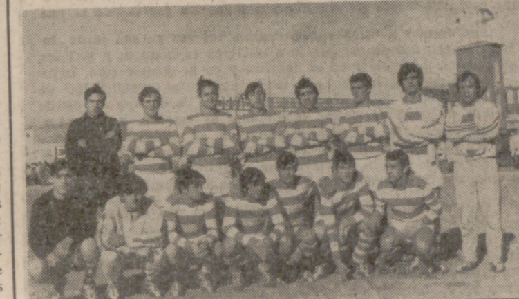
La Gimnástica Medinense se alzó con el título de aficionados, tras dura lucha.

C. D. Arces: Soto; Javi (Orobón), Lioret, Manolo; Vergaz, Rueda; Chani (Lera), Espinilla, De la Fuente, García y Soba. PEPEPE