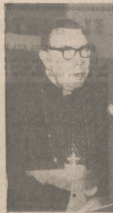
Monsiñor Gordon Joseph Gray, cardenal-arzobispo de Edimburgo.