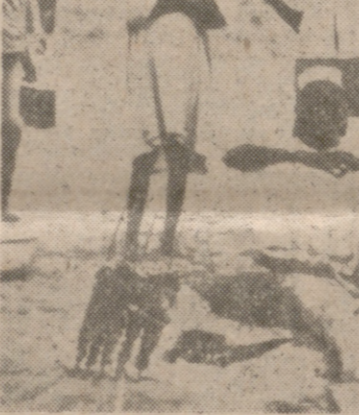
Los auténticos pinchos morunos.

Creemos haber aprendido a calcular la resistencia del terreno por el aspecto de las rodadas que hunden las dunas. El "Kambaco" circula 150 metros delante. Oímos cómo acelera en marcha larga y embiste recto. Como si una bala penetrara en algodón; siempre muy cerca del volante, el "Kambaco" retrocede, se desliza ladera abajo Al volante del "Mangona"