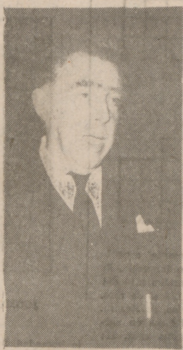
El Marqués de Lozoya