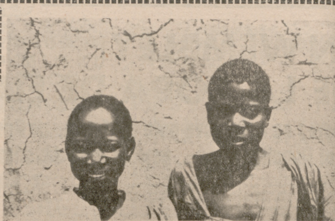
Estos niños habían oído hablar de los "panteras negras".

Javier o José Antonio se desvían y contornean la duna. Por donde la ven más accesible, abren nuevo surco a toda velocidad. Si tampoco la rebasan, se dejan caer a 400 metros de la duna, ponen la tracción a las cuatro ruer-