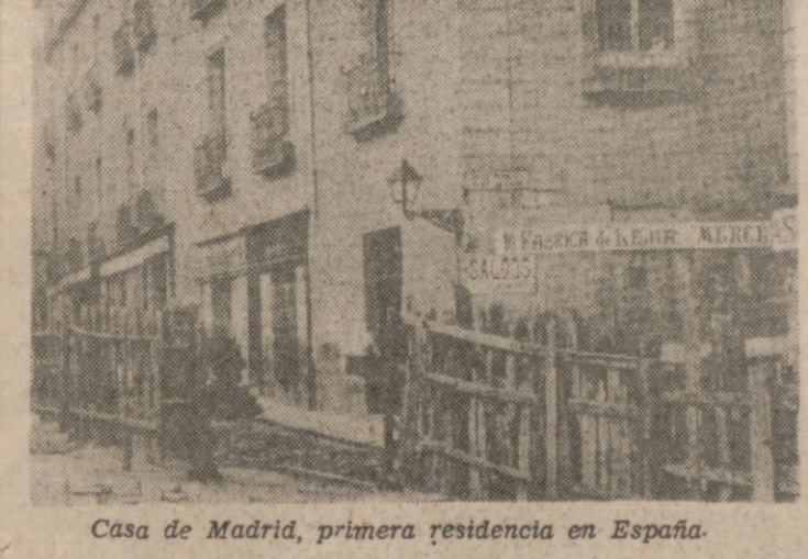
Casa de Madrid, primera residencia en España.

—¿Cuál ha sido la mayor dificultad de cara a la promoción de la mujer? —Ha sido de varios tipos. Primero, se han tenido que vencer dificultades ante la propia mujer, que tiene una tradición demasiado joven en estos aspectos. Pero, en realidad, las dificultades mayores han estado en el hombre, en la sociedad y en la empresa.