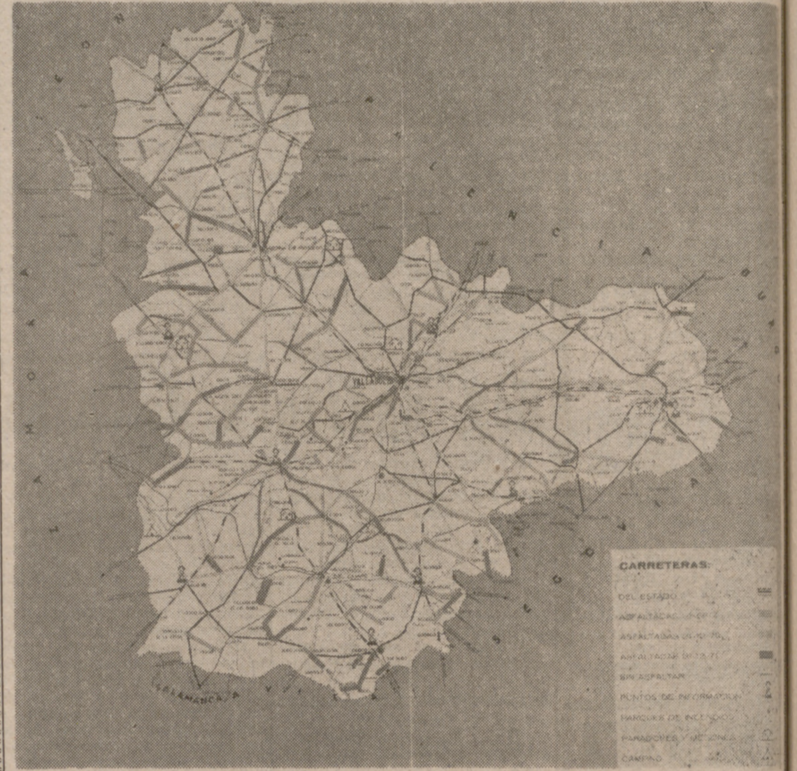
En la fotografía, en trazo grueso, las mejoras realizadas en la red viaria provincial.

En cuatro años, más de setecientos kilómetros de carreteras asfaltadas