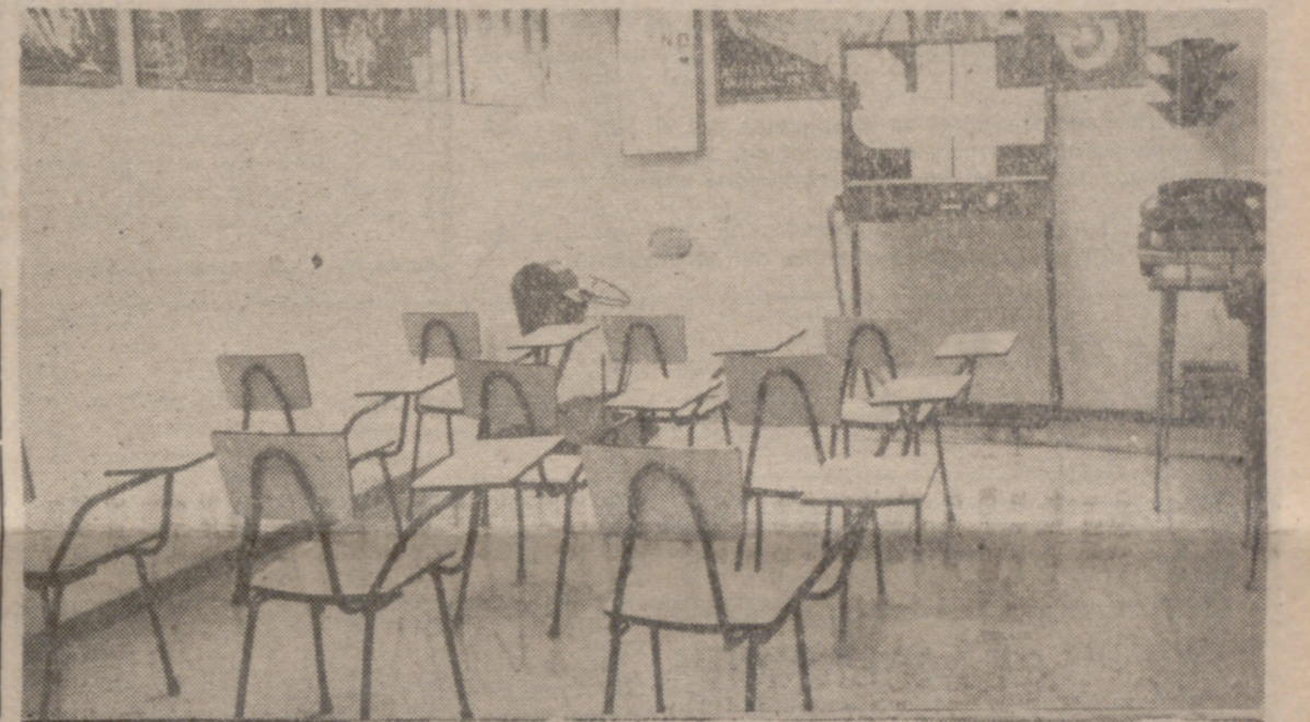
Aula para la teoría de la mecánica automóvil.