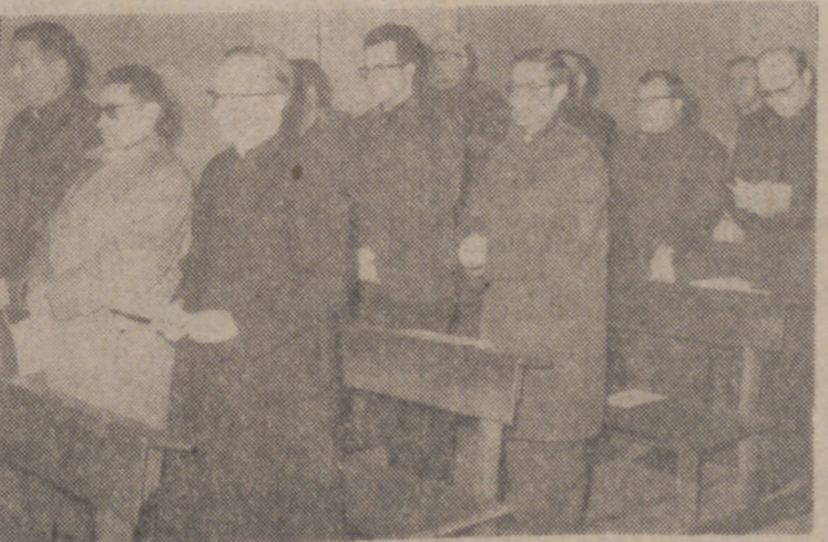
UN GRUPO DE ASISTENTES