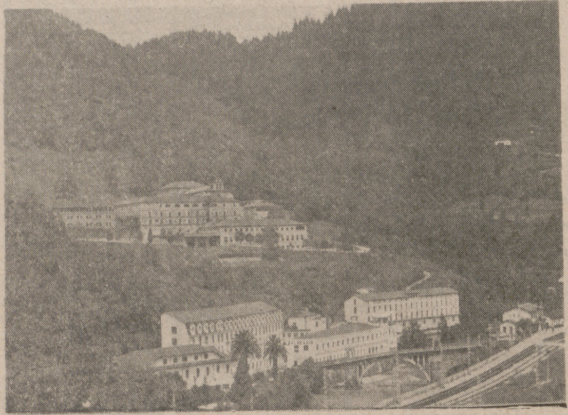
Hasta hace pocos meses, este Santuario de Nuestra Señora de Las Caldas fue la sede de la Comunidad

Se encuentra instalada en el Seminario Mayor Diocesano