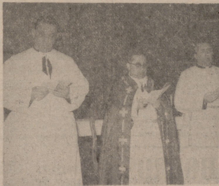
NUESTRO PRELADO, DURANTE SU INTERVENCION