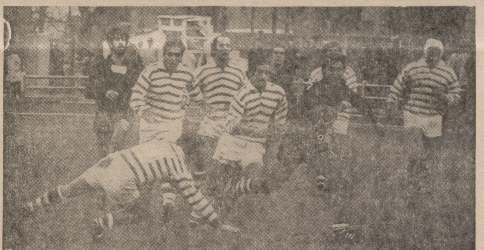
Uno de los jugadores vallsolletanos avanza inexorable hacia la línea de ensayo, tras esquivar la entrada de varios contrarios.

Resultante resulta agradable el ver que a medida que va avanzando la Liga, el público es cada domingo más numeroso y también va adquiriendo más conocimientos sobre la práctica del rugby, habiéndose borrado de su mente la idea de un deporte brutal, no apto para endebles, y formándose la opinión, más acertada sin duda de un deporte viril y noble.