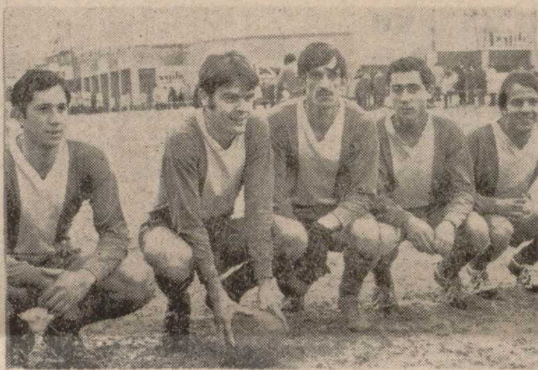
Quinteto atacante del Pajarillos, poco inspirado en el lanzamiento de los penaltis

No estaba el campo de la Federación—escenario de los dos partidos de la Copa de Aficionados disputados en Valladolid—apto para realizar un fútbol brillante. Pero ello dio mayor emoción al juego y valoró extraordinariamente el generoso esfuerzo que sin reservas desplegaron los jugadores.