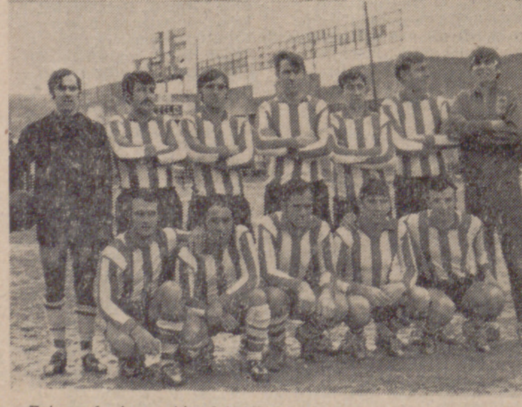
Esta es la formación del Atlético Fasa, que logró clasificarse ayer en la Copa de Aficionados.

Jornada bastante normal, en la que a los resultados se reflejan, y que varían muy poco las posiciones de los grupos segundo y cuarto con respecto a las de la semana anterior.