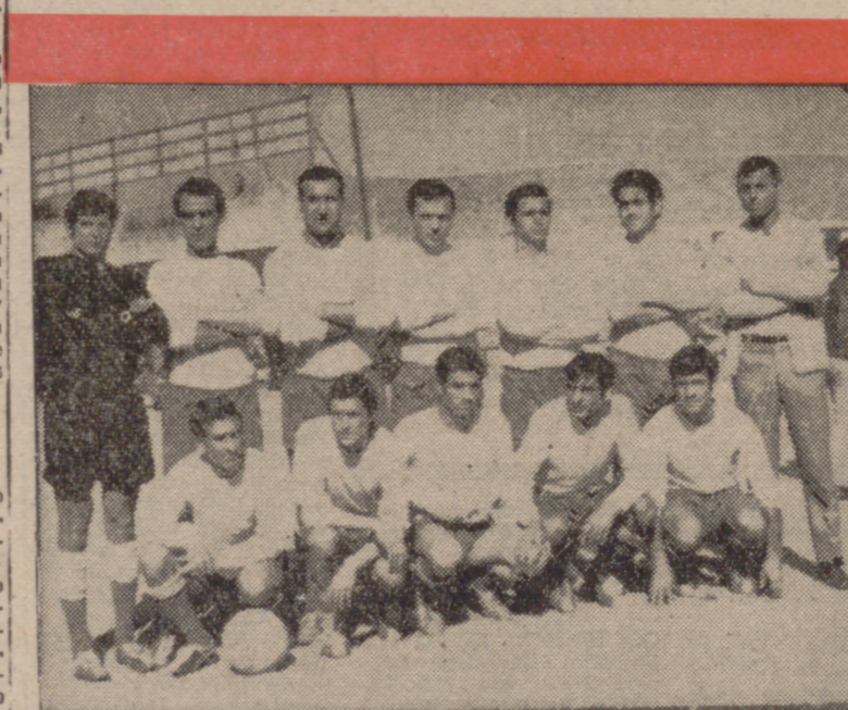
Formación del G. E. Fasa, merecido triunfador en Rioseco y "líder" del Grupo Primero de Primera Categoría Regional.

MEDINA DE RIOSECO.—(Crónica de nuestro corresponsal, José María Reglero).—No ha podido el Rioseco con el líder. Juega mucho y bien el Fasa, y el equipo local, pese a su entusiasmo, ha sido batido en toda la línea. Las cosas empezaron bien para los de casa, ya que a los siete minutos Pelaz hizo diana en la puerta contraria, consiguiendo así el único gol para el Rioseco. Sin embargo, poco habría de dudar el júbilo de los aficionados riosecanos, porque en el minuto doce el Fasa establece el empate por mediación de Peque, que habría de ser uno de los elementos más distinguidos de su equipo. A partir de este momento, la superior calidad técnica y sentido posicional del Fasa se imponen y el Rioseco comienza a hacer agua. No basta su capacidad de lucha para contrarrestar la calidad del enemigo, que a los veintiséis minutos deshace el empate al marcar otra vez Peque aprovechando una indisposición de la zaga blanquinegra. Con este resultado, que ya sería definitivo, se llega al final del primer tiempo. En la continuación el equipo local reacciona, animado por el público, pero su presión —más espectacular que efectiva— es fácilmente contenida por la ondenada defensa del Fasa, en la que todos los elementos rayan a gran altura. Poco a poco, los ataques riosecanos van espaciándose más y el equipo se desahienta aun sin forzar el ritmo, el Fasa pasa otra vez a mandar en el campo y se limita a dejar que el tiempo transcurra, aunque ambos equipos tuvieron al-