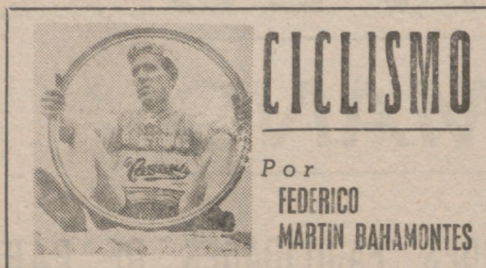
CICLISMO Por FEDERICO MARTIN BAHAMONTES