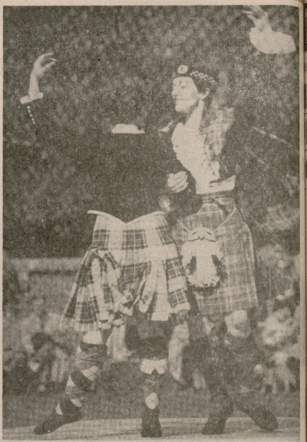
LA JUVENIL ALEGRÍA ESCOCESA

Sin embargo, al ser deficitaria la balanza comercial de España con Gran Bretaña, el Gobierno español se vio obligado a adoptar ciertas medidas restrictivas. El problema no afecta a un solo sector. Es un problema general de intercambio comercial. Quizás una revisión a fondo tendería a nivelar el intercambio de productos entre España y Gran Bretaña.