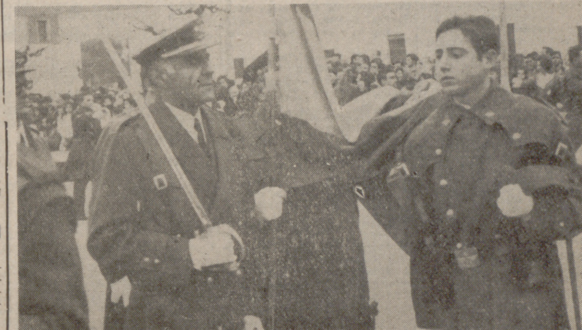
UN MOMENTO DE LA JURA

Ayer, a las doce, en el cuartelamiento del C. R. I. M. número 1, del Pinar de Antequera, se celebró la Jura de Bandera de 1.300 reclutas del Ejército del Aire, pertenecientes al quinto llamamiento de la Primera Región Aérea y Zona aérea de Canarias.