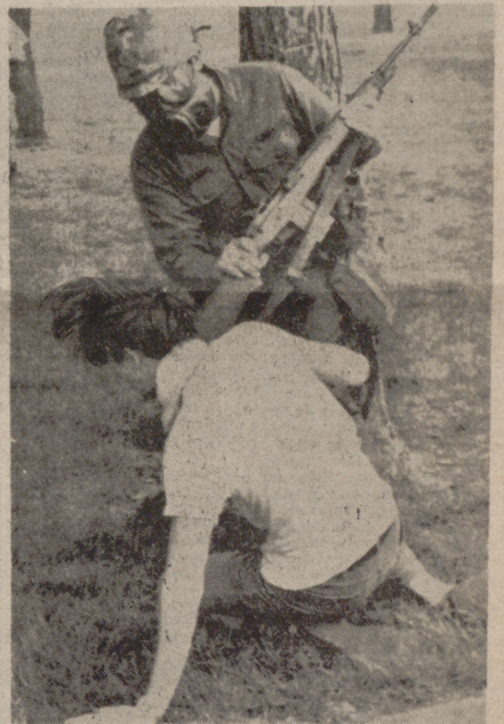
NUEVA YORK.—Han sido elegidas las diez mejores fotografías periodísticas del año 1970. He aquí una de ellas: un miembro de la Guardia Nacional de Ohio golpea con la culata de su arma a un estudiante durante el segundo día de violencias en el campus de la Universidad, el 15 de abril.