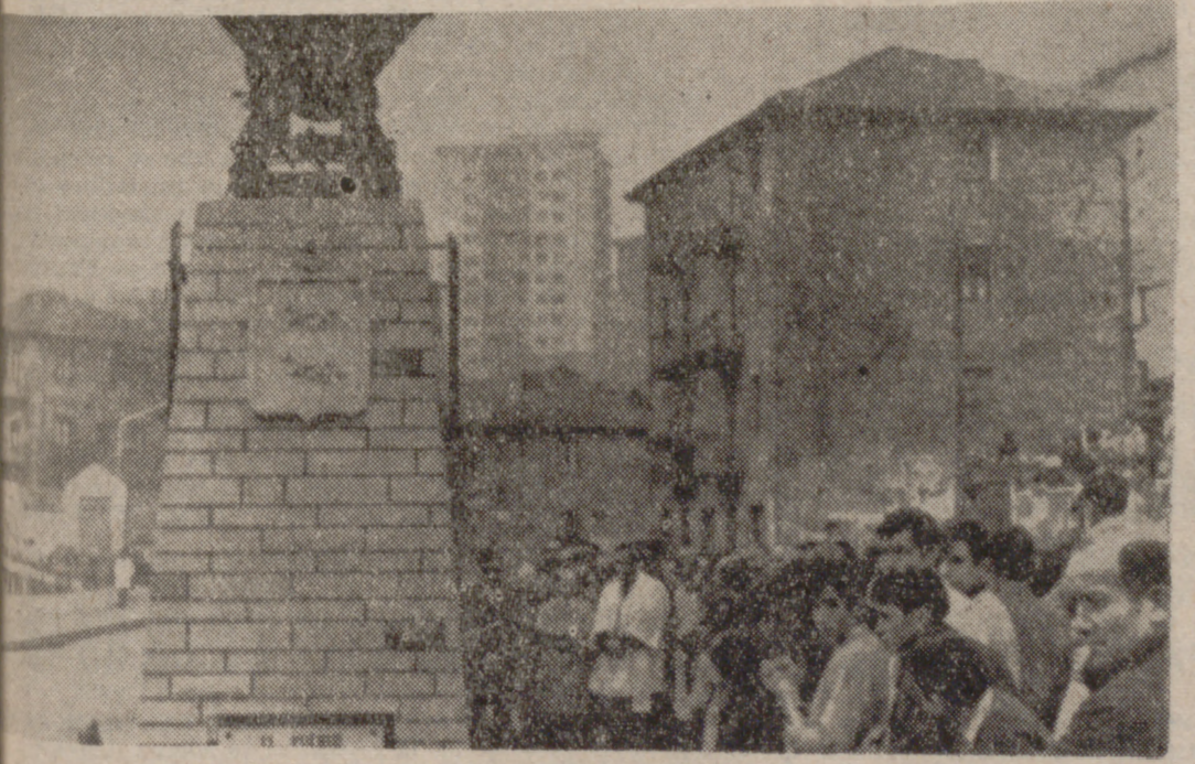
ORTUELLA (Vizcaya). Un momento de la inauguración del "Monumento al Minero", encargado por el Ayuntamiento de Ortuella, y que ha sido instalado en la carretera general Bilbao-Santander, en lugar muy visible, a unos quince kilómetros de Bilbao.—(Telefoto Cifra).