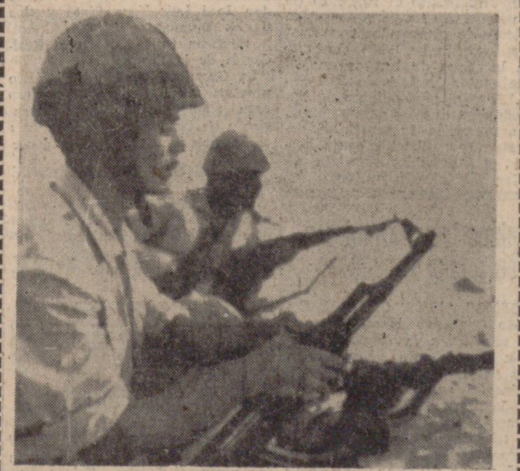
Tropas egipcias montan guardia en la línea de alto el fuego. WASHINGTON, 18. (Efe).—Joseph Sisco, ayudante del secretario de Estado para Asuntos del Oriente Medio, comunicó al embajador israelí en Washington, Itzhak Rabin, que los Estados Unidos no han encontrado pruebas que respalden las acusaciones. (Pasa a la página siguiente)