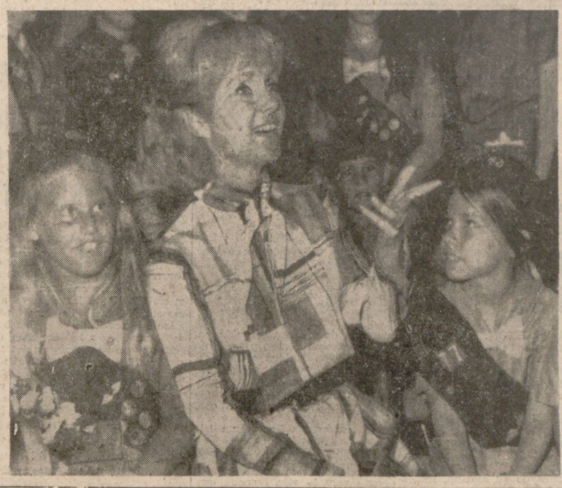
NUEVA YORK.—Un grupo de muchachas scouts rodean a Debbie Reynolds, la simpática cantante, a la que han nombrado «Muchacha Scout Nacional». Miss Reynolds es miembro de la cuarta generación de una familia de muchachas scouts.