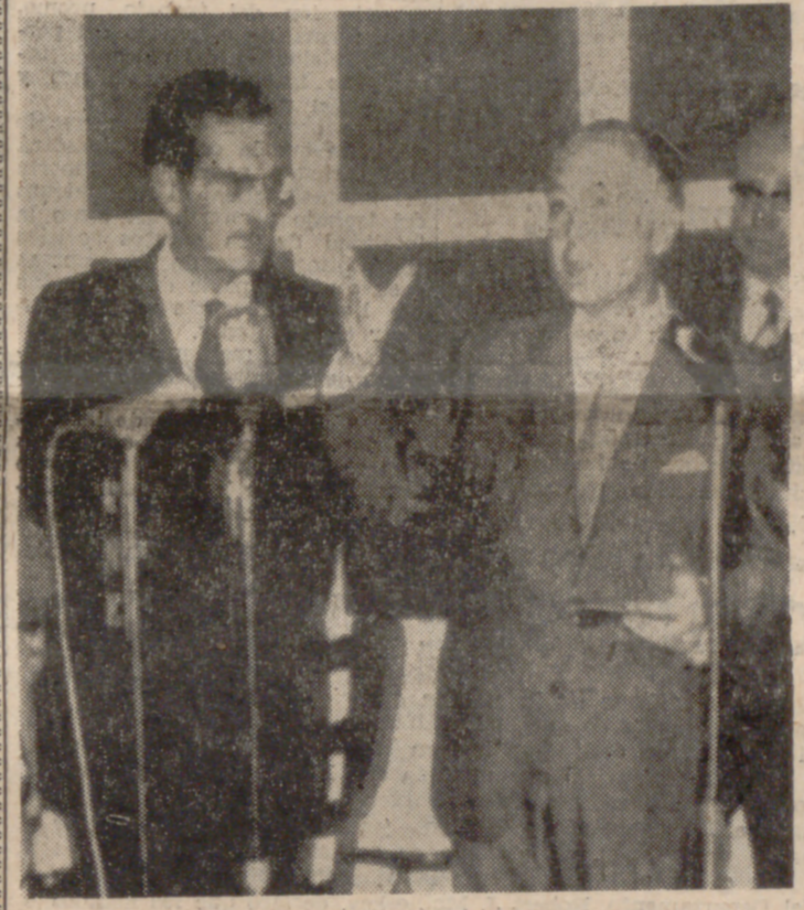
LA CORUNA.—En la tarde de ayer, el ministro de Trabajo, don Licio de la Fuente, inauguró el "Hogar del Pensionista" de La Coruña. Asistieron al acto el Delegado Nacional de Sindicatos, directores generales de Seguridad Social y de Promoción Social, Gobernador Civil de la provincia y otras personalidades.