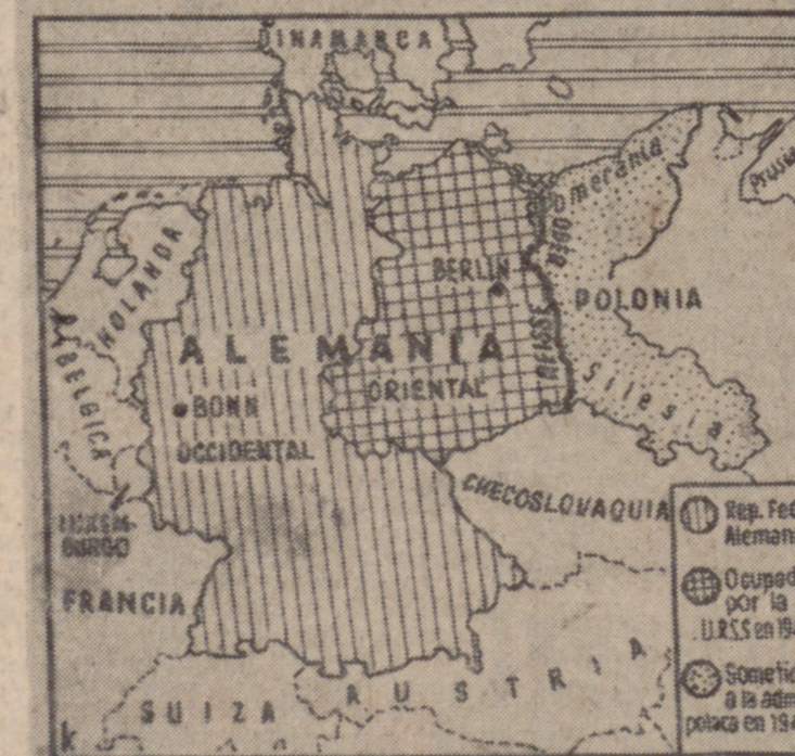
Berlín se encuentra aislada en Alemania Oriental. Está más cerca de Polonia que de Bonn.