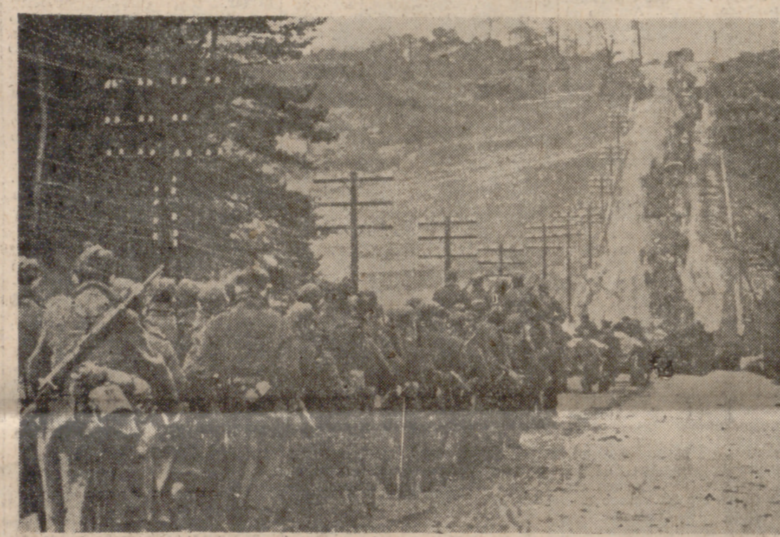
Rusia, su espacio y sus hombres fueron la sangría de la flor y nata de la Wehrmacht. Las tropas alemanas, derrotadas y maltrechas, inician la retirada.