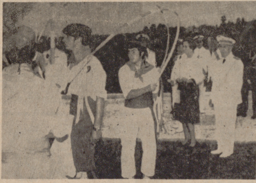
LA CORUSA.—Ayer inició el Jefe del Estado su periodo de vacaciones en Galicia. En la fotografía, el Jefe del Estado y su esposa, doña Carmen Polo de Franco, contemplan interesados la actuación de un grupo de danzas gallegas en el Pazo de Meirás.