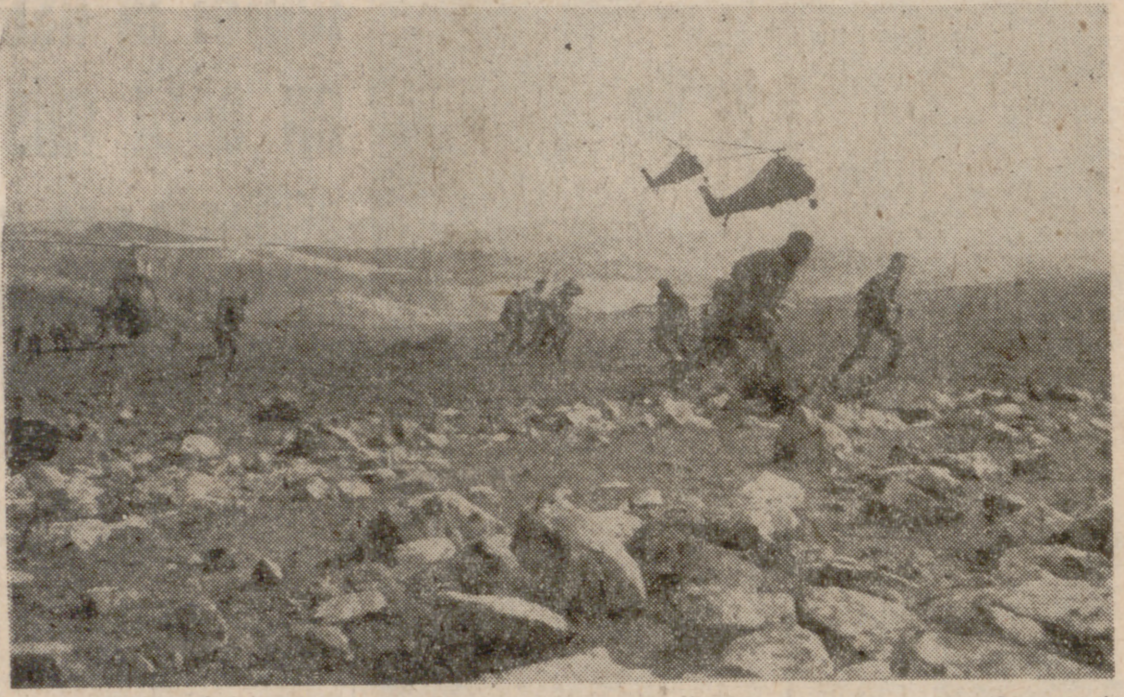
La guerra de Argelia amenazó incluso la esencia del Estado francés. Africa camina firmemente hacia su independencia.

Estando una ojeada al mapa, Africa se nos presenta como un continente macizo, cerrado, hermético, sin apenas contornos y recortes. Soldada por la naturaleza con su vecina Asia, fue amputada de la misma en 1869 con la apertura del Canal de Suez. El acceso al continente ha sido, y es, difícil. Las vías del mar, medio natural y tradicional de comunicación entre continentes y pueblos, chocan con unas costas bajas y arenosas o rocosas e inhospitales (recuerdan el prodigio de la ingeniería española para llevar adelante el puerto de Sidi Ifni). Por ello, sus puertos naturales son contados. Por otra parte, los ríos, medios de penetración tierra adentro, apenas valen como vías de acceso. De por sí escasos, los que merecen tal nombre son de cursos rápidos y cortados por importantes desniveles. (Nilo, Níger, Congo, Zambese).