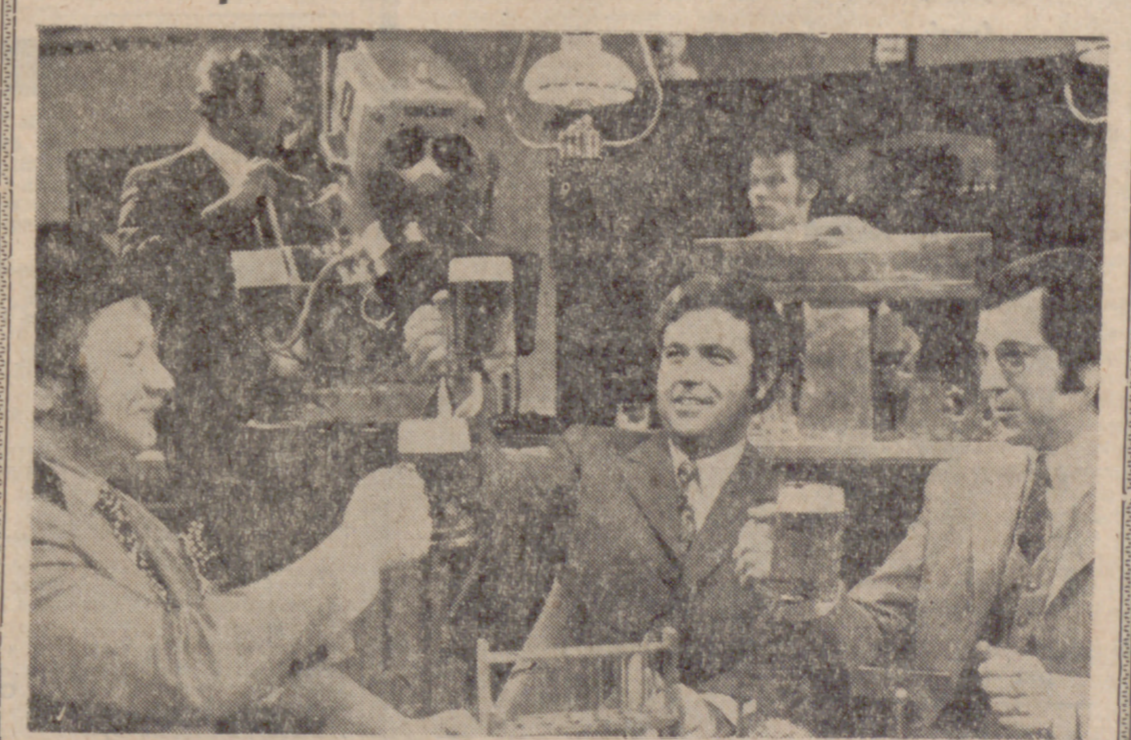
BONN. (DaD). — Desde hace casi medio milenio los cerveceros vienen observando un mandamiento que la Comunidad Económica Europea pretende que pierda en importancia. Se trata de la pureza de la cerveza, de la que la República Federal de Alemania produce dos tercias partes en el mercado de la Comunidad. En contra de la prescripción del año 1516, la cerveza deberá contener en el futuro, en escasa limitada, también, cereales no malteados, almidón de maíz, arroz quebrado y aditamentos químicos. El Gobierno de Bonn se opone a ello en cuanto puede. La cerveza constituye una bebida nacional y un buen negocio. La cerveza "impura" de los cinco vecinos, los que, a su vez, tendrán que agravar las prescripciones sobre la fabricación de cerveza, es de una dureza casi inimitable, mientras que el producto fabricado según la orden de pureza alemana, se conserva sólo cuatro semanas, pero sabe mejor y es más provechosa.