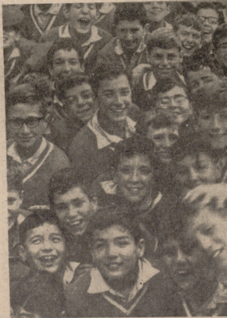
Los Campamentos están abiertos a todos los jóvenes españoles, sean o no de la O. J. E.

El número de turnos programados para cada tipo de Campamentos es el siguiente: Iniciación, 106 turnos con 14.852 acampados; Magisterio, 18 turnos con 2.458 acampados; O. J. E., 135 turnos con 21.539 acampados; cursos especiales y actividades de nueva programación, formación de mandos y dirigentes en