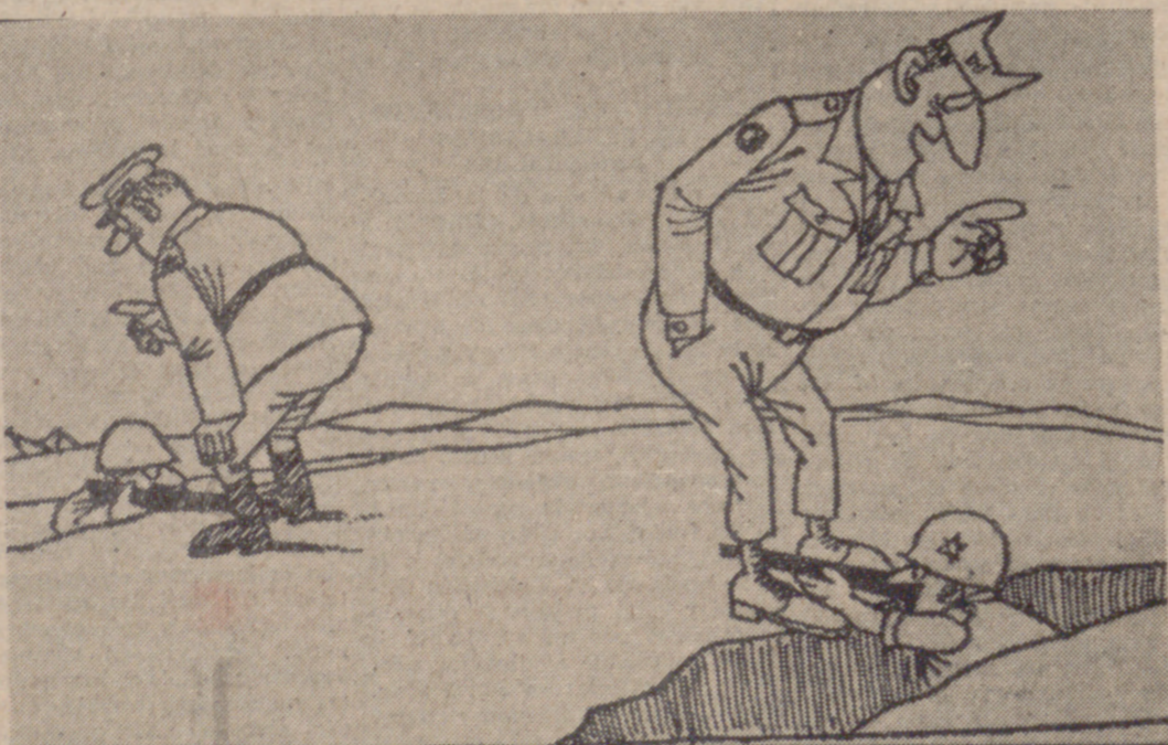
"Si sois buenos, os daremos armas."