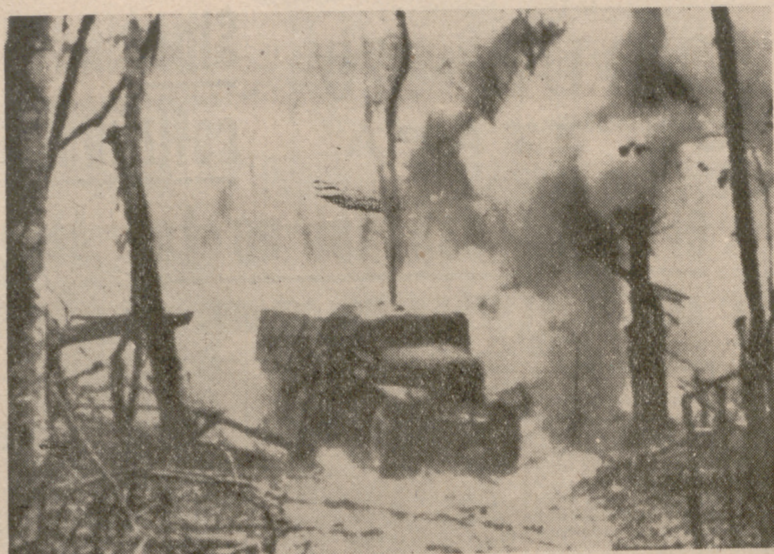
TOKIO.—Un camión del que se dice pertenece al Vietcong, transportando alimentos y municiones por la senda de Ho Chi Minh, cerca de la frontera entre Laos y Vietnam, circula en medio del mar de humo producido por el bombardeo de unos aviones norteamericanos. Esta foto fue obtenida al principio del presente año y ha sido facilitada por la agencia japonesa de noticias DEMPA.—(Telefoto Cifra.)