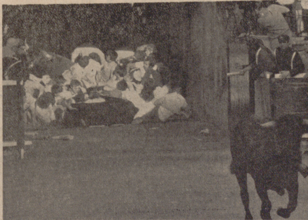
PAMPLONA.—Los toros, al enfilarse al callejón de la plaza, se encontraron un enorme montón de mezos en la entrada de la misma, por encima de los cuales tuvieron que pasar los astados. Sólo resultó un herido grave y numerosas magulladuras. Jugarse la vida es un deporte de estos días de las fiestas de San Fermín.