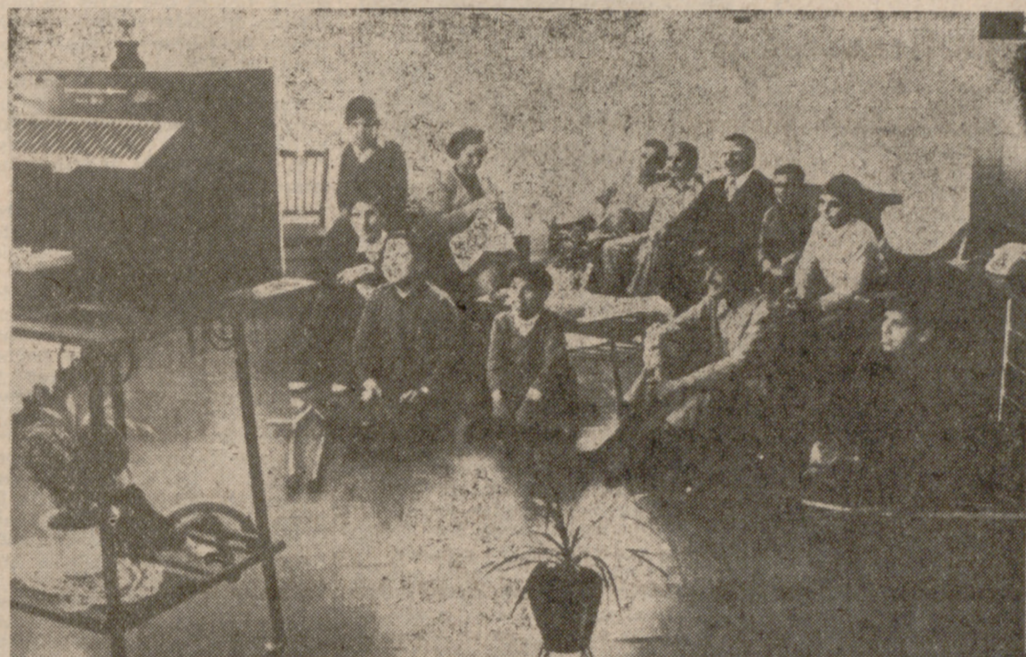
Vida hogareña de los muchachos en los chalets de la Ciudad

SEVILLA. (Especial para PY-RESA, por FAUSTO BOTELO.) El día 29 de junio fue oficialmente inaugurada la Ciudad de San Juan de Dios de Sevilla, una ciudad alegre y confiada que atienden los Hermanos de San Juan de Dios, auxiliados por las Hermanas Carmelitas Misioneras y que habitan mil muchachos, mil chicos y chicas de toda España con anomalías físicas o psíquicas y que aquí reciben tratamiento médico, enseñanza cultural y profesional y calor humano.