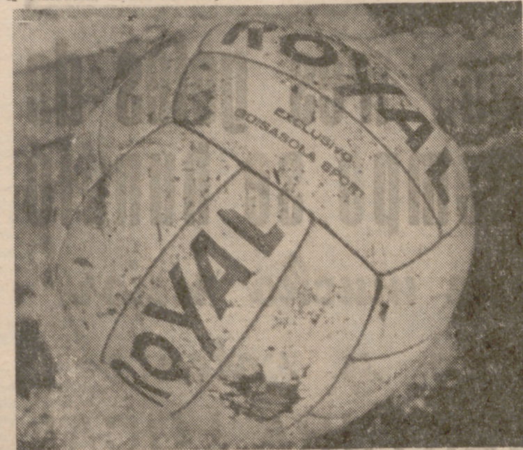
BALON INGLES.—Los jugadores del Valladolid se quejaban del balón en anteriores jornadas. Tienen razón y se les hizo caso. Ayer se jugó con este balón inglés, de los que se ha traído Ronnie Allen, y todo fue mejor..., pero sólo en el primer tiempo.