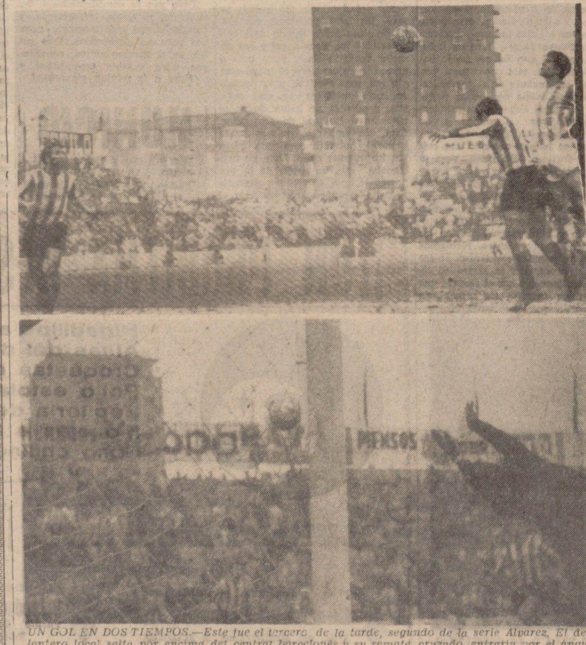
UN GOL EN DOS TIEMPOS.—Este fue el tercer, de la tarde, segundo de la serie Alvarez. El delantero local salta por encima del central barcelonés y su remate, cruzado, entraría por el ángulo contrario, como se advierte en la segunda de las fotos.