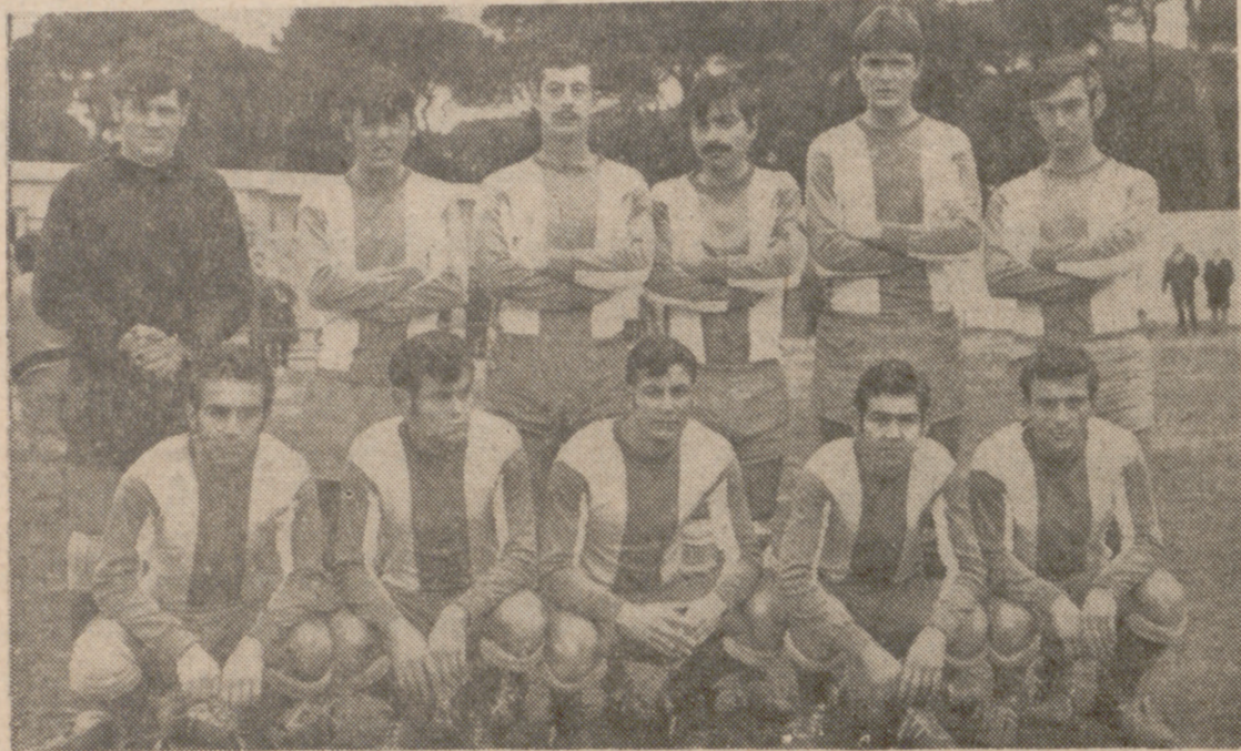
Esta es una de las más recientes formaciones del C. D. Girón. Ante el Atlético Fasa se batió con entusiasmo y logró poner a los automovilistas muy difícil su victoria.