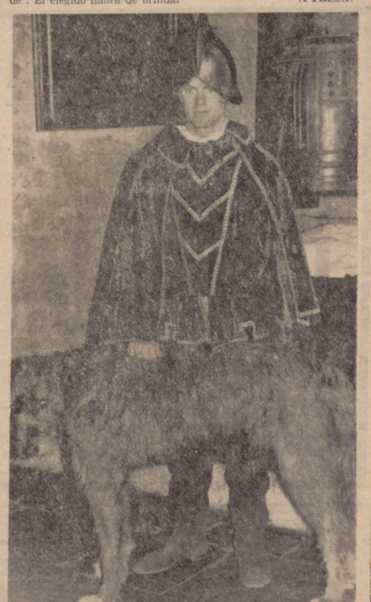
Un perro irlandés espera en una esquina del comedor del castillo de Bunratty los huesos que le tiran los comensales

—Hay que emprender serias investigaciones éticas, médicas, psicológicas y sociológicas acerca del papel que desempeña la "sub-embriaguez" en los accidentes de tráfico e incluso en los labores y domésticos.