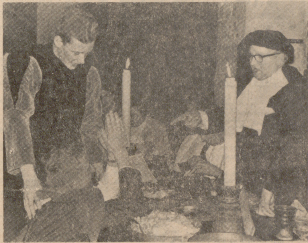
Entre los derechos del conde elegido figura el de castigar. Aquí vemos cómo uno de los comensales pide perdón de rodillas, después de haber sido castigado a beberse una libra de hidromiel.

En un gran salón abovedado, con arcones de madera tallada, armaduras y damascos carmesí; con bufones con gorros de ter-