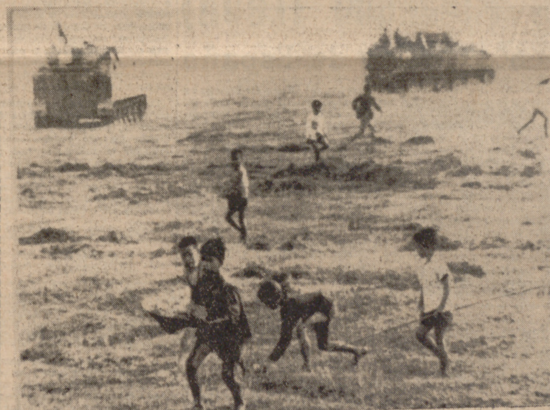
CU CHI (Vietnam del Sur).—Niños vietnamitas descalzos corren cuando los coches blindados de la XXV División comienzan a moverse después de haber tenido unas posiciones fijas toda la noche en su patrulla de vigilancia y búsqueda junto al bosque de Bo Loi, a 48 kilómetros de Saigón.—(Telefoto Upi Cifra).

EL VIETCONG DESTRUYO AYER UN IMPORTANTE PUENTE CERCA DE SAIGON