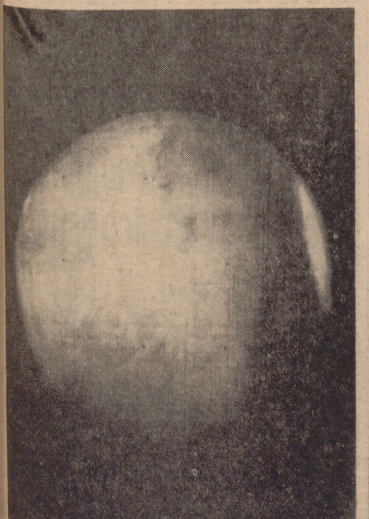
PASADENA (California).—El Mariner VII logró esta fotografía de Marte tomada a 293 millas de su superficie.