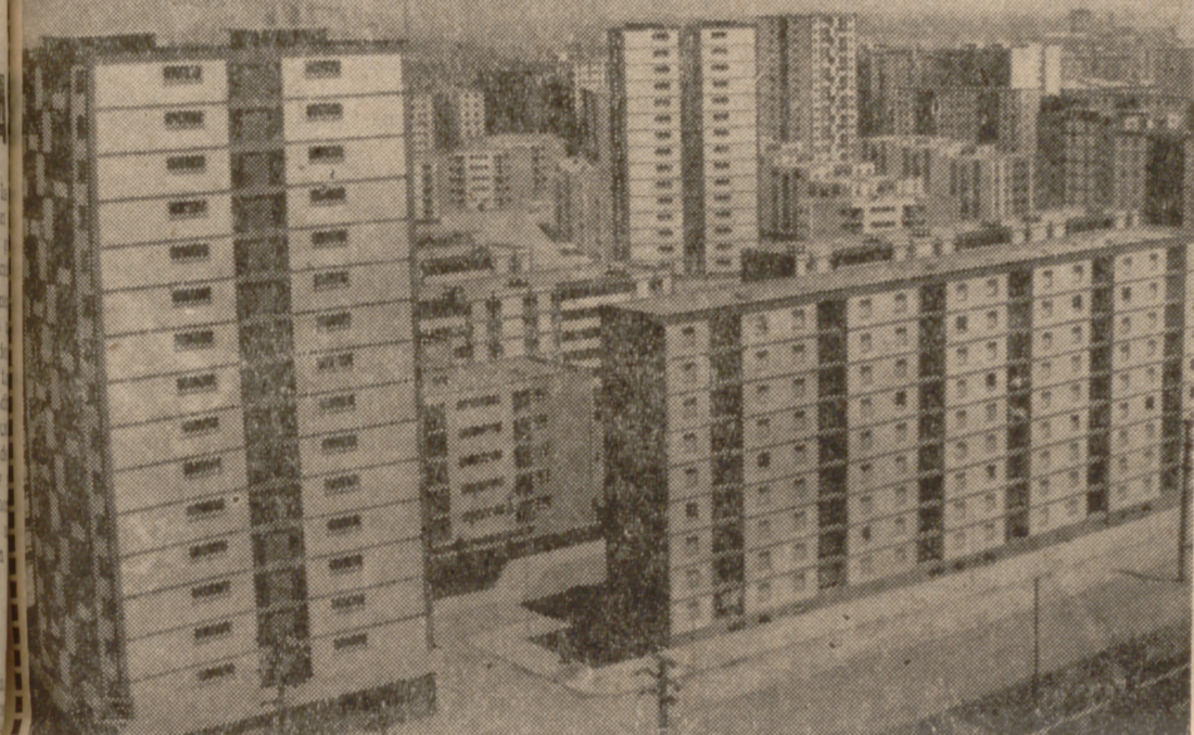
El grupo de viviendas "La Paz", de la barriada de la Verneda, en Barcelona, es uno de los centenares levantados en toda España por la iniciativa oficial.