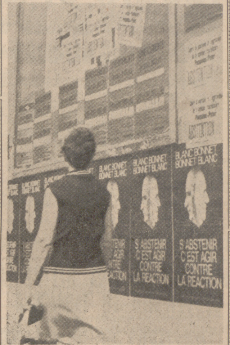
PARIS.—El cartel vedette de la campaña presidencial dice: "Abstenerse de votar es actuar contra la reacción." En ese cartel se ve una fotografía compuesta, a la izquierda de la cual está la fotografía de Pompidou y a la derecha la de Pöcher.