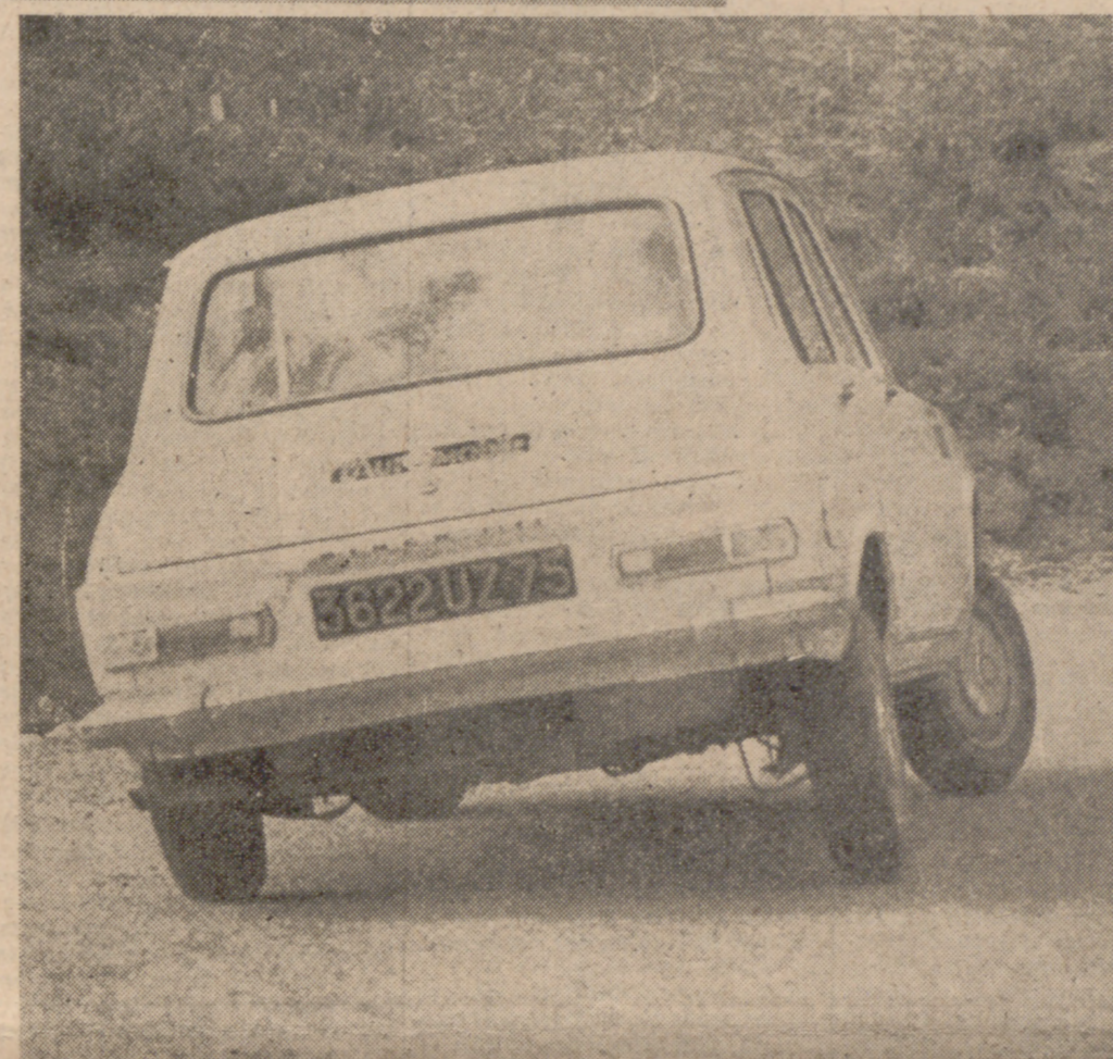
La línea "5 puertas" está en marcha y cada día son más los usuarios con esc. preferencia.

Después de la aparición de los "breaks" o "rancheras", los diseñadores, a la vista de la apatencia de los futuros compradores por los "cinco puertos" decidieron trocar la parte posterior de sus vehículos, mediante un acertado corte en las carrocerías. La primera fue la Regie-Renault, con su modelo "R-16" y posteriormente con el "R-6"—este último lanzado en España por Fasa y que ya circula, y bien, por nuestras carreteras—. Después fue la Simca, a la que corresponde el grabado superior, en su modelo "1100", cuya fabricación en España se anuncia antes de que acabe el presente año. Luego, la Renault francesa prepara su "R-12", también con línea similar, y, por último, "Citroën", en Francia, acaba de pre-