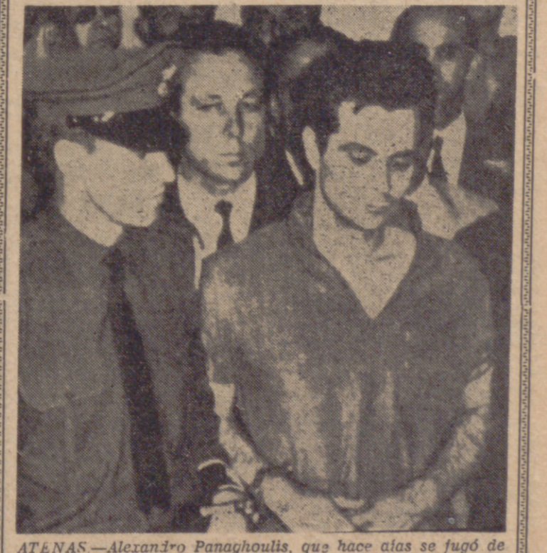
ATENAS.—Alexandro Panagoulis, que hace años se fugó de la cárcel donde estaba recluido bajo condena de muerte, ha sido nuevamente capturado por oficiales de la Policía suburbana. En la foto, Panagoulis entre policías y periodistas en la Comisaría de Nueva Ionia, en un suburbio de Atenas.