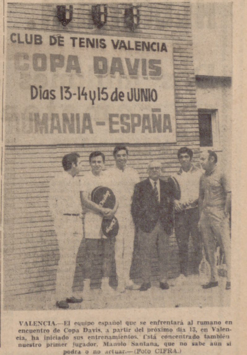
VALENCIA.—El equipo español que se enfrentará al rumano en el encuentro de Copa Davis, a partir del próximo día 13, en Valencia, ha iniciado sus entrenamientos.