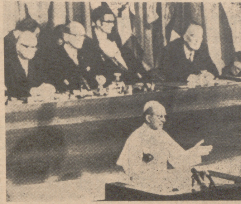
GINEBRA.—El Papa Pablo VI se dirige a la sesión conmemorativa del cincuenta aniversario de la Organización Internacional del Trabajo, en el edificio de las Naciones Unidas

Expondré mis impresiones personales. Mis referencias van a ser, estricta y restrictivamente, una perspectiva personal. Ginebra es Ginebra. Ginebra no es Belén. La cabeza empezó a darme vueltas y a dolerme los ojos, el corazón y... el sombrero. Tres oradores habían anunciado sendas conferencias evangélicas de carácter extraordinario en la sala comunal de Plain Palais, en las que con irritada mansedumbre íntegra expusieron verdades cristianas disonantes con el apostolado itinerante del Pontífice Pablo VI y discordantes con la doctrina y la diplomacia católicas. Un norteamericano, cabeza de grupo, Carl McIntire, presidente del "Consejo Internacional de las Iglesias Cristianas", amigo del (Pasa a la página siguiente)