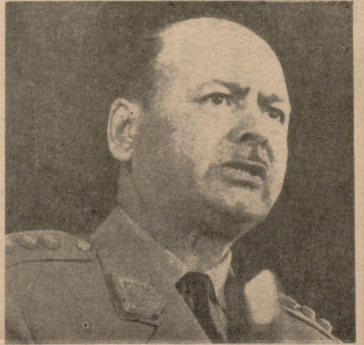
El general Juan Velasco Alvarado, Presidente del Perú

La tan airada apertura a los países socialistas no será suficiente para financiar el desarrollo económico peruano. Ni la URSS ni sus aliados tienen recursos para ello. Pueden contribuir, eso sí, al desarrollo, mediante un incremento del comercio entre el Este y el Oeste tal como reco-