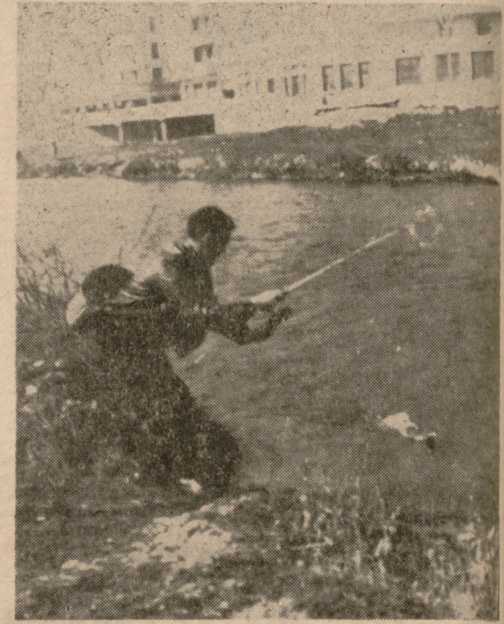
Cobrando una trucha.

En Santander, donde se ha notado, en relación con el año anterior, un gran incremento en el número de soli-