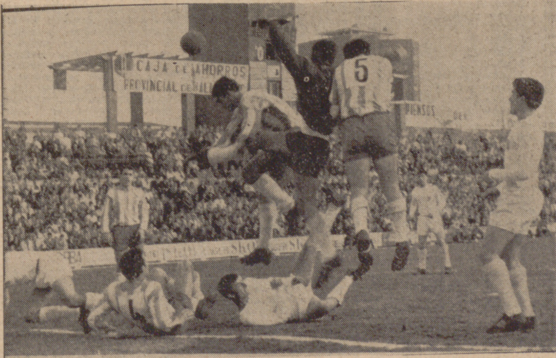
L.T.U.—Ante la puerta local, en uno de los escasos ataques de Júpiter, se produjo este barullo, que recoge la foto de Carvajal. Varios jugadores al suelo y, al final, despeje de Fermín.

del encuentro con mano firme. Pero, por lo visto, él tenía ambiciones mayores. A él —y ésta es una teoría con muchos visos de realidad— lo que le egaba era el afán de emular a otro arbitro, ahora ya célebre, que hizo víctima de sus métodos dictatoriales e injustos, allá en cierto partido muy sonado de la primera vuelta, por las "ritas Altas. La ocasión, efectivamente, que ni pintada, y el señor Medina Díaz se lanzó, con todo su esfuerzo, para aprovecharla debidamente. ¿Penalties y expulsiones? Esa era la consigna. ¿La víctima? El Real Valladolid, naturalmente. Antecedentes hay a barullo para acreditar que se puede perjudicar hasta el atropello, hasta el ensañamiento, al club blanquiverde, impunemente. Y hubo penalties. Dos, porque, literalmente, no hubo oportunidad para más. Alguien, tratando de justificar el inculcable proceder del colegiado, nos había dicho que era un maniático del máximo castigo. "Ya verás como a la menor oportunidad señala uno contra el Rayo." Se equivocó el co-