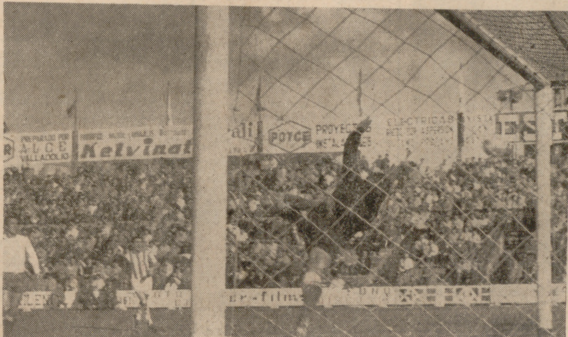
EL PRIMERO. —El primer gol fue obra de Lizarralde, que no aparece en la foto. Su remate, impecable de colocación y con fuerza, se trató en un scorbio tanto, el que abría la cuenta.