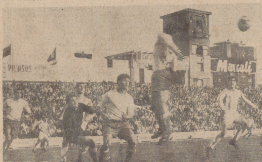
AL QUITE. —El zaguero gaditano ha hecho un quite oportuno a su guardameta, que ya estaba rebasado por el centro de Astrain. También esta jugada pudo acabar en gol.