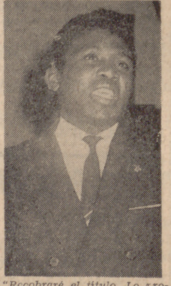
"Recobraré el título. Lo prometo."