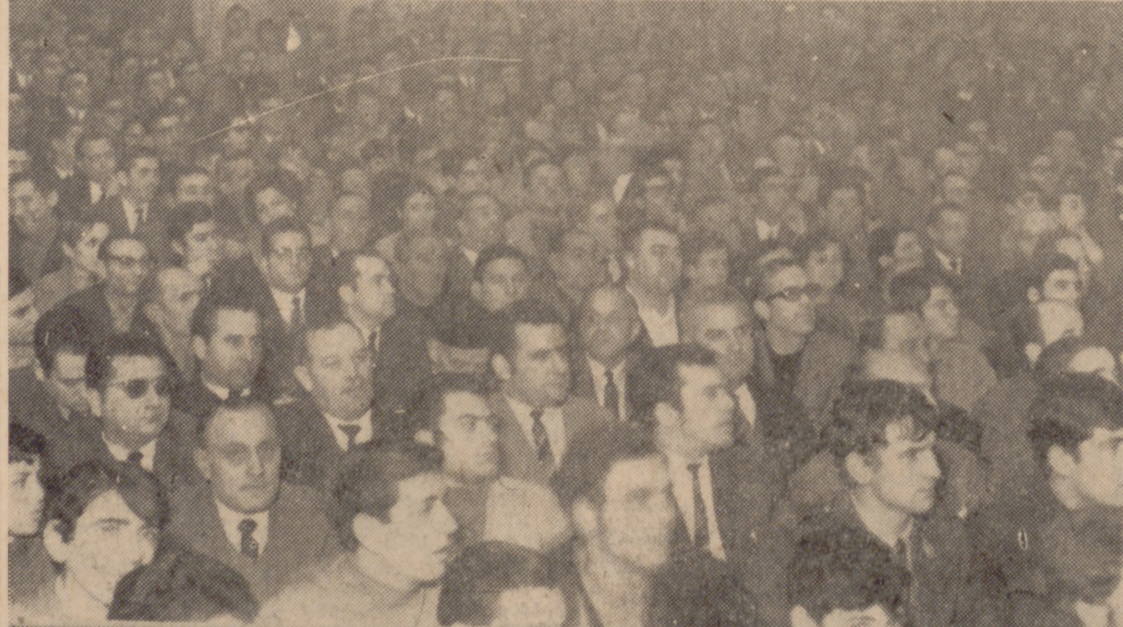
Testimonio gráfico de la expectación despertada. El salón de la Casa Sindical se quedó pequeño.