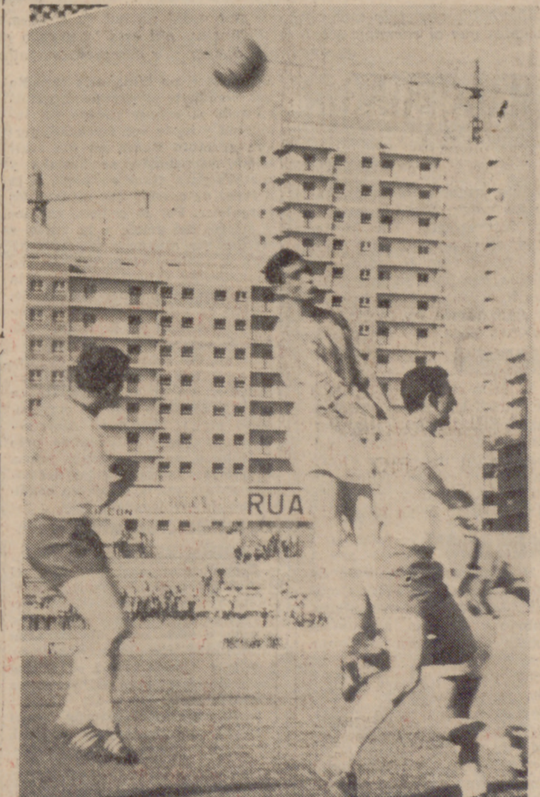
Una fase del disputadísimo encuentro de ayer. Un jugador vallisoletano se lleva limpiamente la pelota con la cabeza entre varios enemigos.