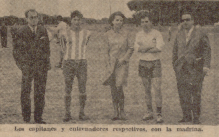
Los capitanes y entrenadores respectivos, con la madrina.