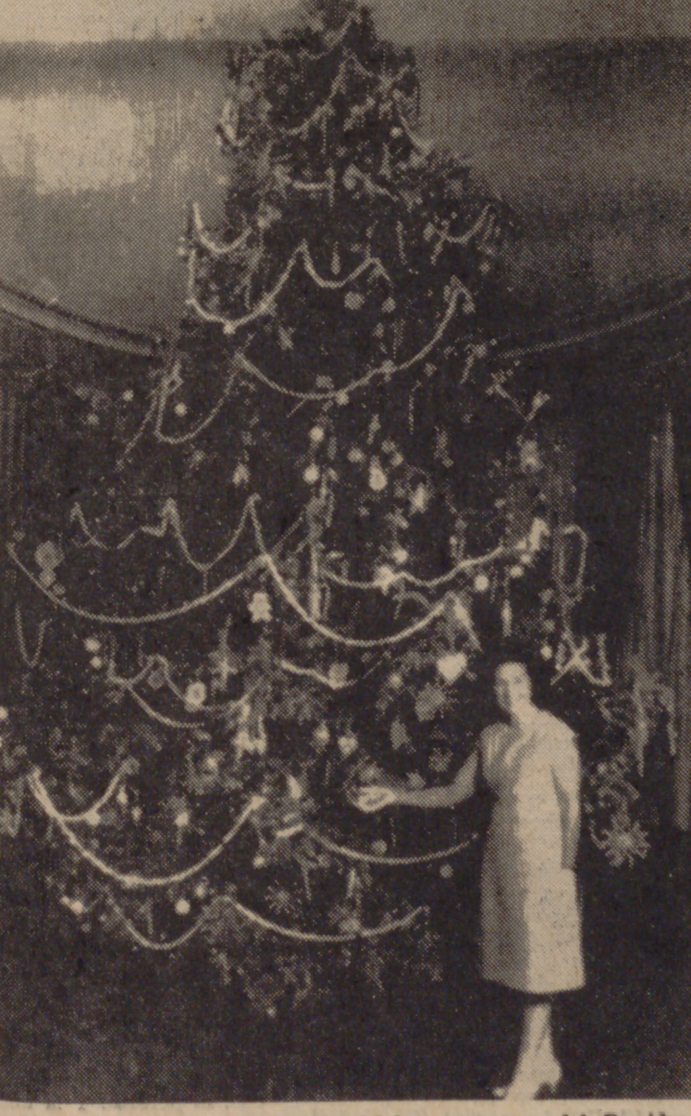
WASHINGTON. — La señora Johnson, esposa del Presidente norteamericano, junto al gran árbol navideño instalado en la Casa Blanca.

Con lo cual queda una posibilidad de que Ninette continúe con vida, si a Miguel Mihura se le antoja una tarde cualquiera que es cuando escribe. Y nos metemos en el terreno de la crítica teórica. Queremos saber qué piensa Mihura sobre este particular, pero parece que no le interesa. Vamos. —¿Cómo clasificaría usted el teatro español del momento? —En el teatro español, como en el de los demás países, sólo existe el teatro bueno o malo. Cuando es bueno, da lo mismo que esté clasificado de un modo o de otro. Las etiquetas no tienen importancia. Lo importante es el contenido. Y como se nos ha escapado por aquí, nos vamos por otro lado. Según lo que piensa y lo que dice la gente del teatro, parece que hay autores que buscan la gloria literaria, otros buscan el dinero y la popularidad momentánea, el de más allá busca el martirio y la cárcel —que también los hay— y unos consiguen amistades, otros odios y envidias y muchas cosas más pueden ser la cosecha del autor teatral. Preguntamos a Mihura que él qué prefiere. Y dice: —No hay que hacerse ilusiones. El teatro no da tantas cosas, ni mucho menos. En todo caso da algunas satisfacciones, de corta duración y bastantes disgustos. Yo, cuando escribo una obra, sólo pretendo que dure el mayor tiempo en el cartel para no tener necesidad de escribir otra nueva. Lo que parece significar que únicamente le interesa sacarle