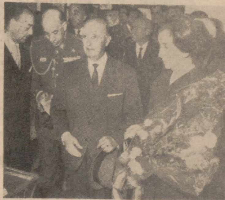
Su Excelencia el Jefe del Estado y su esposa doña Carmen Polo de Franco, fotografiados en el colegio electoral de Mingorrubio, en El Pardo, donde acudieron a depositar sus votos. (INFORMACION EN LA PAGINA SIGUIENTE)

Los españoles han acudido en masa a las urnas