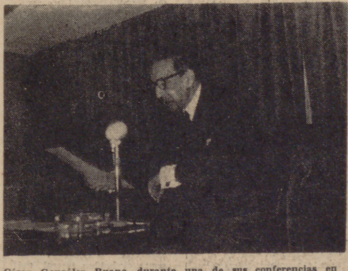
César González Ruano, durante una de sus conferencias en Valladolid.

Era diciembre cuando César González Ruano se moría en Madrid, después de haber escrito un artículo sobre la muerte. Se tardará posiblemente mucho tiempo para que un escritor español se ponga a escribir cada día con la tensión de este hombre que debe su recuerdo a la obra cotidiana, al trabajo de cada día. Quizá por eso González Ruano escribió en el café, porque el pulso de su trabajo estaba precisamente en el café español, junto a la plática y el cortado.