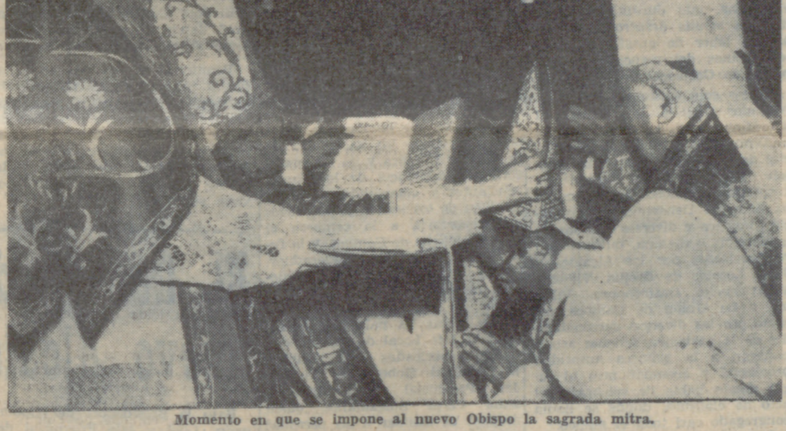
Momento en que se impone al nuevo Obispo la sagrada mitra.

El solemne acto se celebró en la iglesia de los Filipinos, asistiendo nuestro Prelado y autoridades