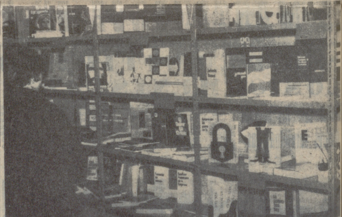
UN ASPECTO DE LA EXPOSICION

Con asistencia de las autoridades civiles y académicas se celebró el sábado por la noche la apertura de la II Exposición Bibliográfica Internacional de Valladolid, en la sala de exposiciones de la Caja de Ahorros Provincial.