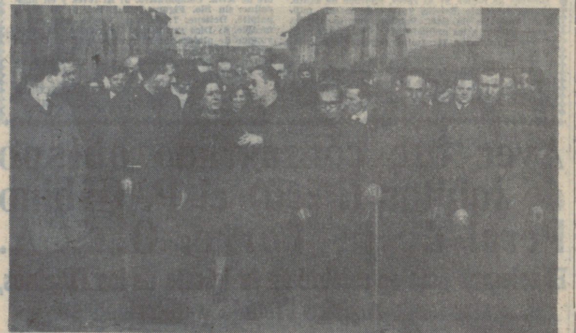
El Gobernador Civil y la Delegada Provincial de la Sección Femenina, acompañados por los alcaldes de Becilla y pueblos comarcanos.

El sábado, en Becilla de Valderaduey, se celebró el acto de clausura de la Cátedra de la Sección Femenina, que durante cuarenta días ha venido desarrollando una amplia labor de enseñanza entre los vecinos del mencionado pueblo y de Castroponce.