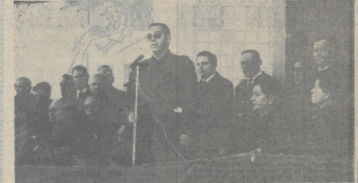
EL JEFE PROVINCIAL DEL MOVIMIENTO DURANTE SU ALOCUCION

PRESIDIO EL JEFE PROVINCIAL Y GOBERNADOR CIVIL