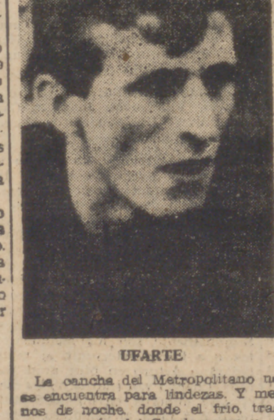
UFARTE La cancha del Metropolitano no se encuentra para lindesza y a menos de noche donde el frío tras el ventarrón del Guadarrama y a pésima iluminación del Estadio, no favorecen mucho al juego.

El Oviedo, "casi" en segunda. Frente a un Sevilla muy fuerte y rápido perdió otros dos puntos en casa. El partido fue muy disputado, con muchos cambios de posesión y una gran intensidad en el juego.