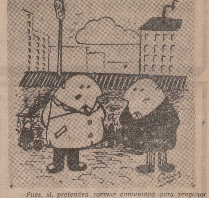
—Pues, si, pretenden formar comunidad para pregonar uno a uno la mercancía y arrojarse menos desperdicios al cierre.