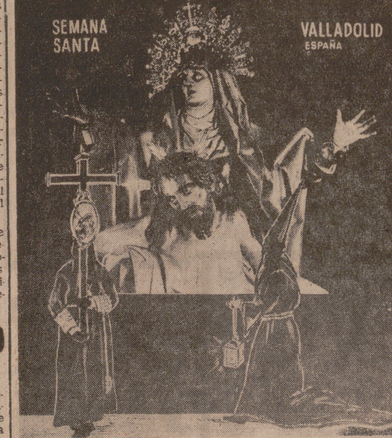
En la Feria Mundial de Nueva York, en el pabellón español, se exhibirá una fotografía tamaño 3 x 2,5 metros, obra del fotógrafo de LIBERTAD, señor Carvajal; dos capuchones expresamente confeccionados a tal fin y una reproducción de la Cruz Guía de la Cofradía de Nuestra Señora de las Angustias.