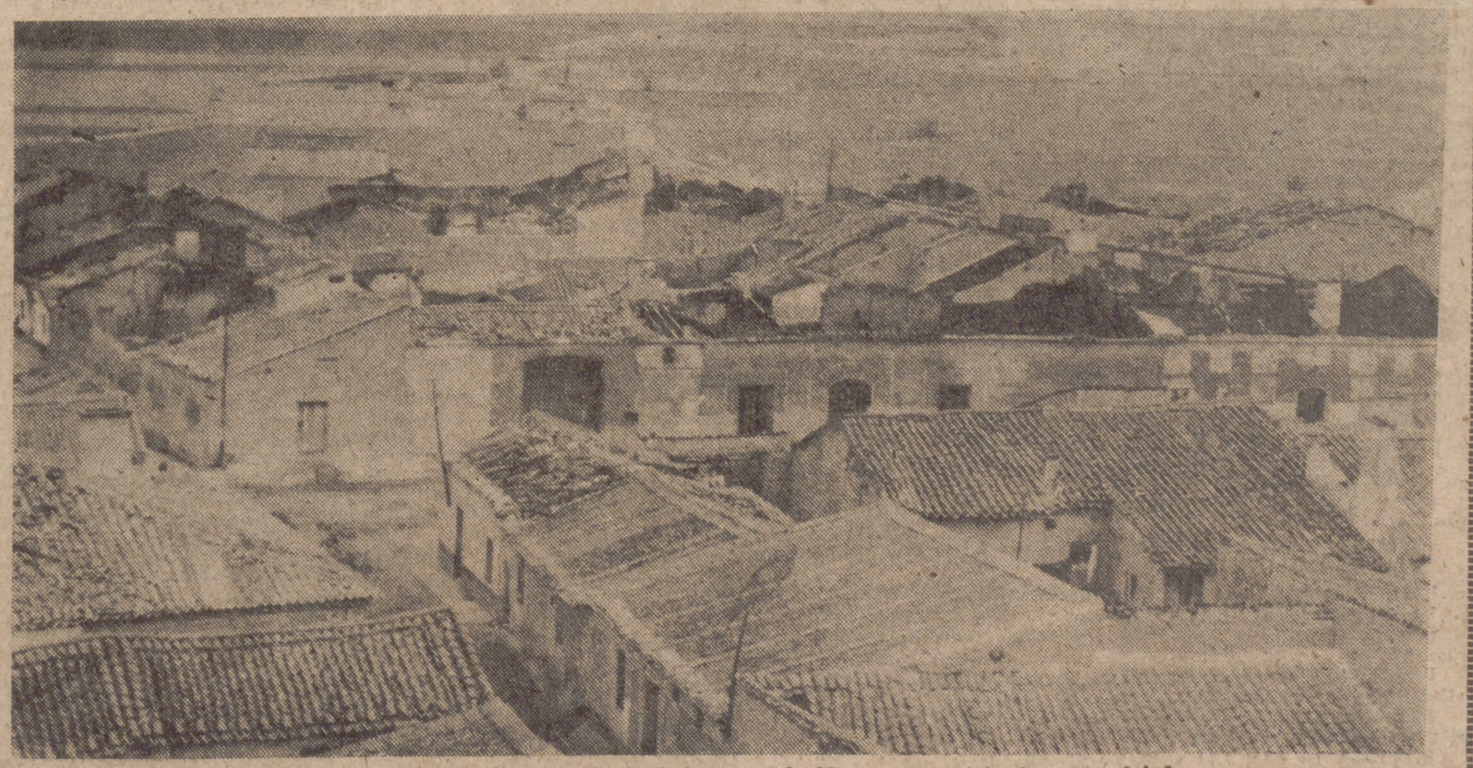
Parte norte de Nueva Villa de las Torres, la más afectada por el incendio, a pesar de haberse producido en unas viviendas más alejadas, que quedan ocultas a la izquierda del grabado.