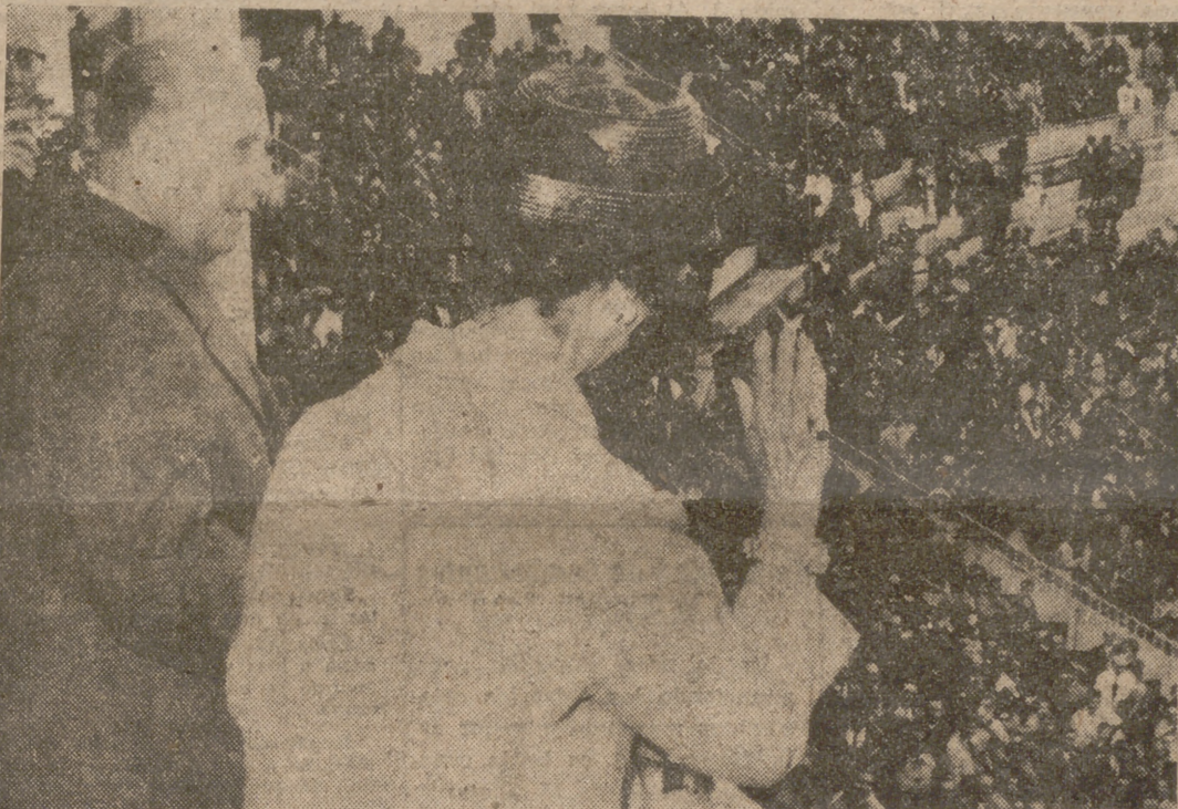
MADRID.—S. E. el Jefe del Estado y su esposa, doña Carmen Polo de Franco son aplaudidos al ser llegados al palco de la Plaza de Toros de las Ventas para presidir el festival taurino a beneficio de la Vivienda del Necesitado, en la que actuaron como matadores la famosa pareja formada por Julio Aparicio y Miguel Báez «Litri».