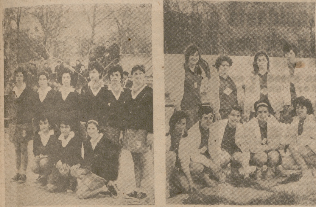
Los equipos de la Sección Femenina de Salamanca y Medina de La Coruña, vencedores en la jornada de ayer.