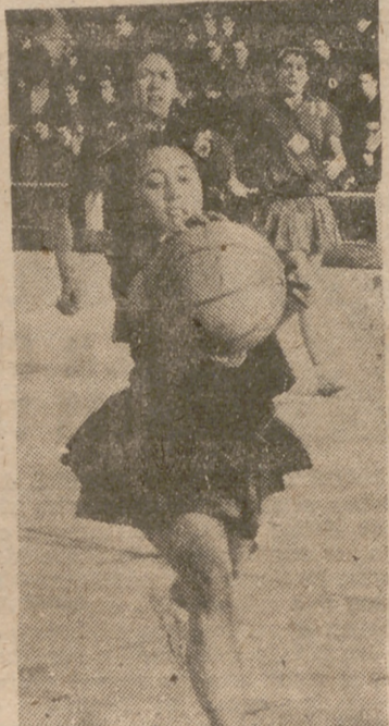
Una jugada del encuentro Medina de La Coruña-S. F. de Valladolid.

única que podía inquietar la zona coruñesa. El comienzo del segundo encuentro, entre los equipos de la Sección Femenina de Medina del Campo y de Salamanca, nos hizo