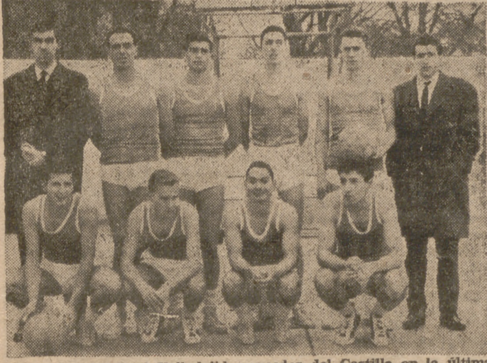
El equipo del Real Valladolid, vencedor del Castilla en la última jornada.