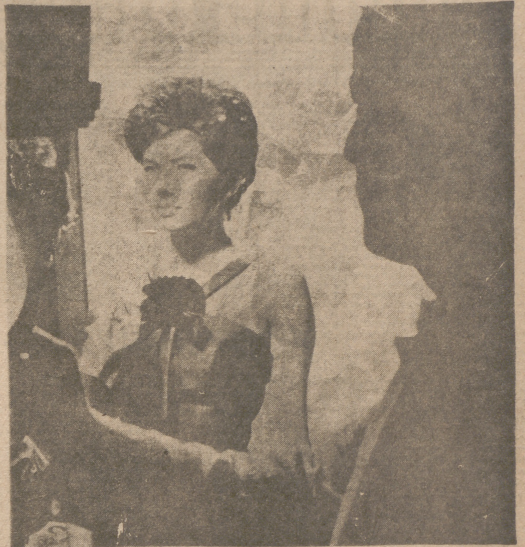
Una sugestiva imagen de Soraya, mientras le hacen unas pruebas en el cine. La exemperatriz de Persia ha resultado en gran manera fotogénica y expresiva, tanto en las secuencias en negro como en color. Ante la cámara, la princesa ha improvisado el relato de un viaje de Mánaco a Roma, fingiendo hablar por teléfono a una amiga. Esta escena, con la que ha convencido a De Laurentiis, demostró que la pantalla presta pleno realce a la belleza de Soraya, la cual se presentó para actuar sin maquillaje.