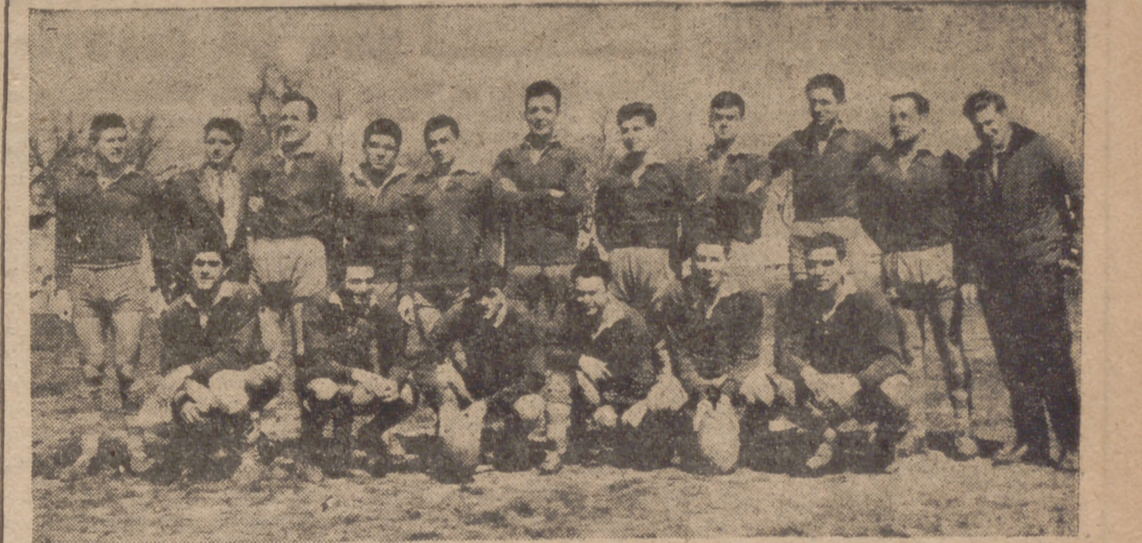
EL SAN FERNANDO, VENCEDOR DEL C. A. D. U.

Se jugó el partido del Campeonato Regional, entre los equipos San Fernando y C. A. D. U. Medicina, y la victoria correspondió a los primeros, que lograron imponerse después de un 3-0 adverso, para terminar ganando por nueve a tres.