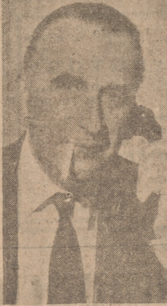
Georges Pompidou, jefe del Gobierno francés, cuya muerte, con la de Roger Frey, había sido decretada por los dirigentes de la O. A. S.