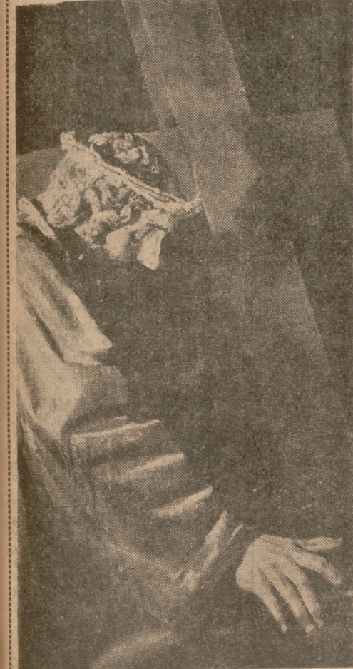
Durante el día de hoy, primer viernes de Cuaresma, los devotos vallisoletanos de Nuestro Padre Jesús Nazareno, renovarán la piadosa devoción del besapié, en el templo penitencial de su nombre. Bien puede decirse que con este singular desfile ante la imagen de Jesús Nazareno, comienzan los actos que preparan los espíritus para la mejor conmemoración de la Pasión y muerte del Salvador. Después de la misa de nueve, comenzará el besapié. A la una se celebrará la misa de enfermos.