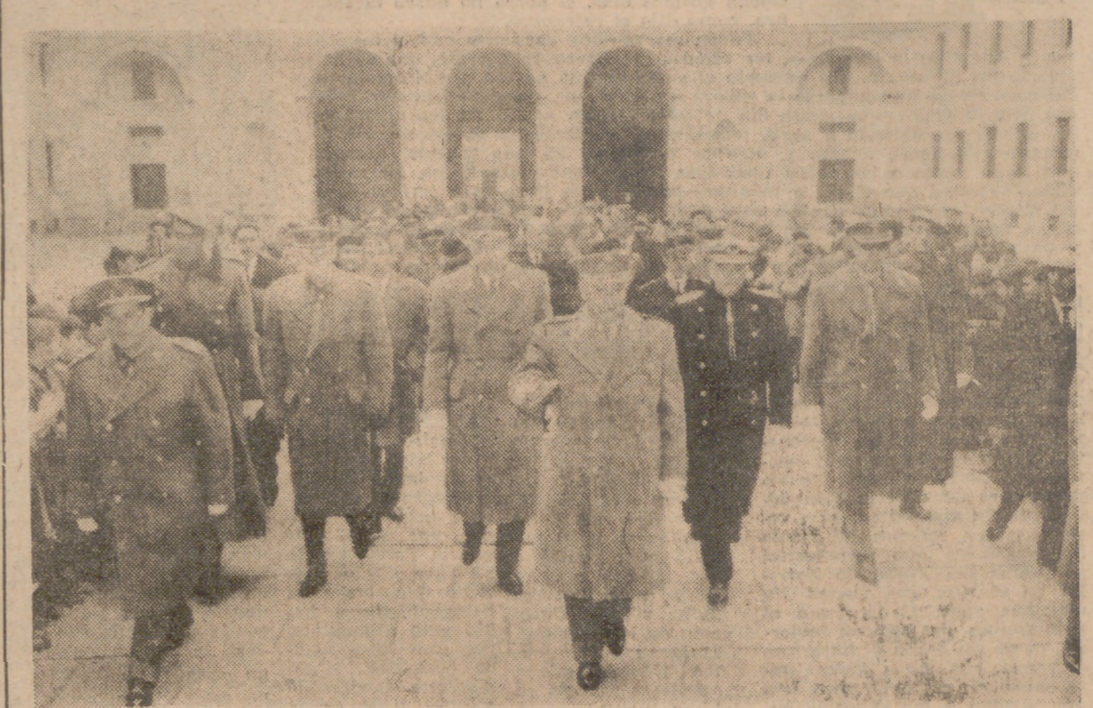
SAN LORENZO DEL ESCORIAL.—Su Excelencia el Jefe del Estado llega al Monasterio de Escorial para presidir los solemnes funerales por el alma de don Alfonso XIII y demás reyes de las dinastías españolas.

SAN LORENZO DEL ESCORIAL, 28.—Su Excelencia el Jefe del Estado, Generalísimo Franco, ha presidido las solemnes honras fúnebres que, organizadas por el Gobierno, se celebraron en la basílica del Real Monasterio, en sufragio del alma de Su Majestad don Alfonso XIII y de los demás monarcas de las distintas dinastías españolas.