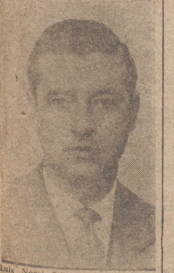
Luis Nozal López, presidente del Sindicato Nacional del Metal