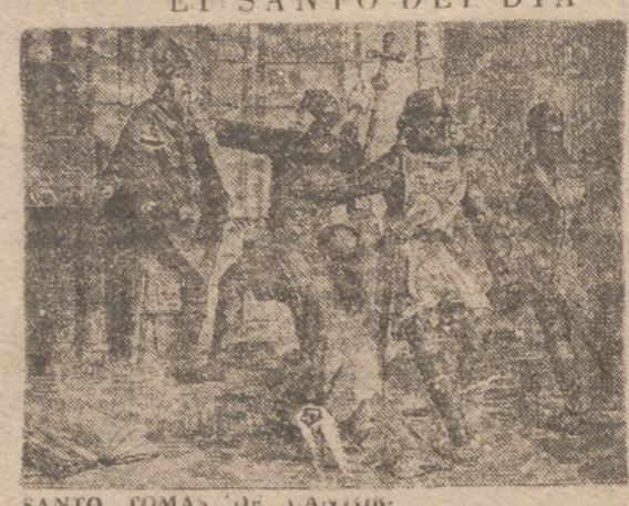
SANTO TOMÁS DE CANTONBERY, ARZOBISPO Y MARTIR († 1170).

El invicto defensor de la inmunidad eclesiástica y glorioso mártir de Cristo, Santo Tomás, nació en Londres de padres nobles, ricos y piadosos. Adornado de grandes prendas personales, tanto se hizo amar del arzobispo de Cantobery, que el buen prelado le admitió a su servicio y le hizo arcediano de su iglesia, y luego, por consejo suyo, el rey Enrique II le hizo su cancelario y le confió la educación del príncipe. Muerto el arzobispo, quiso a todo trance que ocupara la sede primada de Cantobery Tomás, su cancelario, a pesar de su firme resistencia. Hecho arzobispo, asistió a un Concilio celebrado en Tours, en que presidió el papa Alejandro III. Vuelto a Inglaterra, tuvo que luchar denodadamente contra el rey, su gran amigo y protector, el cual pretendía dar algunas leyes muy perjudiciales a la Iglesia y contrarias a su divina misión. Tomó el rey grandes medios de promesas y amenazas para atraer al santo prelado a su voluntad, mas todo fue inútil. Entonces, el rey concibió tal odio contra él, que para evitar mayores males, Tomás salió de Inglaterra y pasó a Flandes.