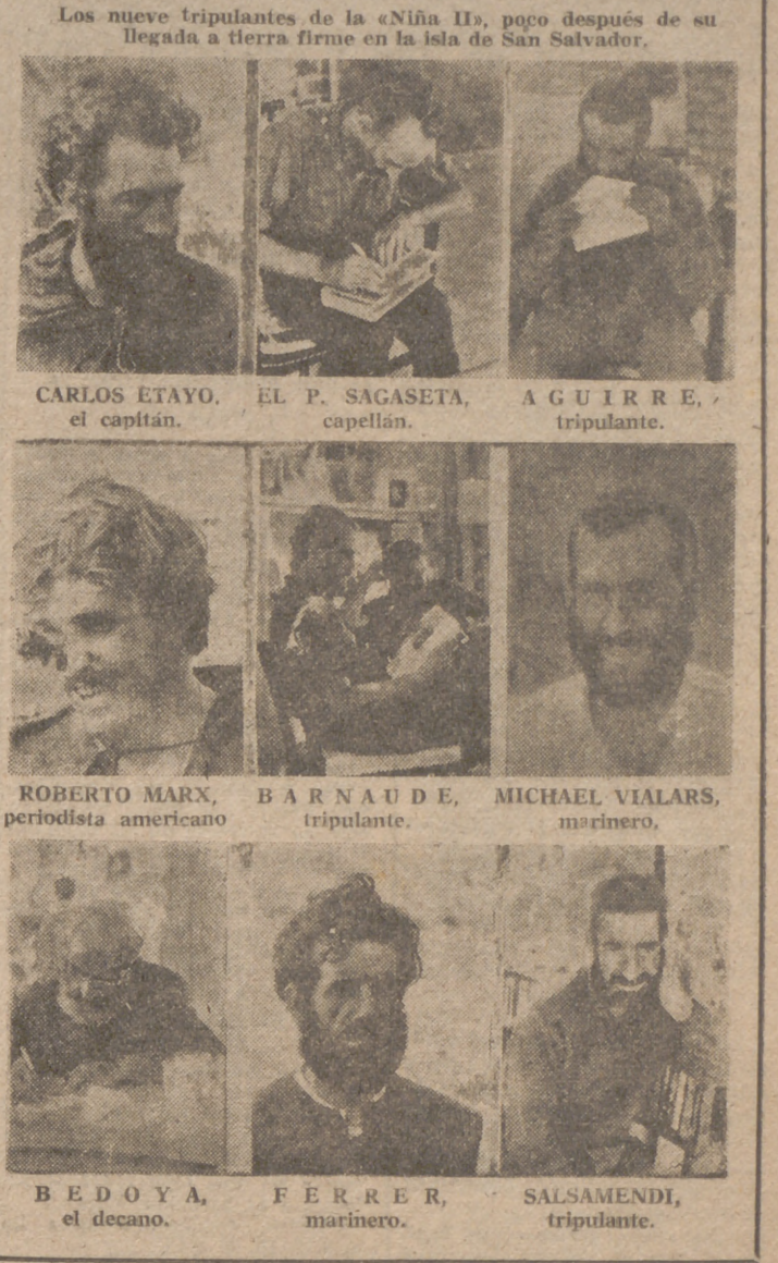
Los nueve tripulantes de la «Niña II», poco después de su llegada a tierra firme en la isla de San Salvador.