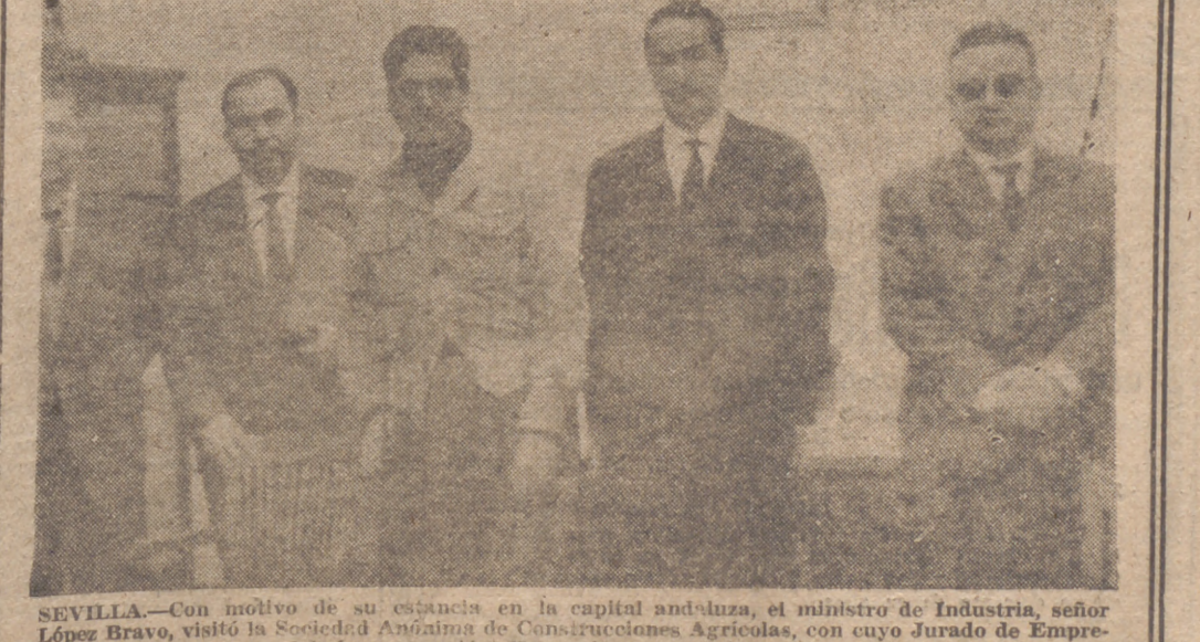
SEVILLA.—Con motivo de su estancia en la capital andaluza, el ministro de Industria, señor López Bravo, visitó la Sociedad Andaluza de Conservaciones Agrícolas, con cuyo Jurado de Empresa celebró una reunión. He aquí un momento.