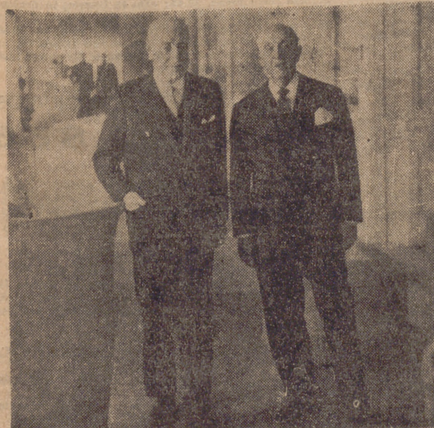
Para pasar la Navidad con sus hijos y nietos, llegó a Madrid el expresidente de la República peruana, don Manuel Prado. En la foto le vemos en compañía de su primo, embajador en España. El expresidente se reúne por primera vez desde hace muchos años con sus hijos y nietos, dispersos por varios países europeos. Todos se alojan en la residencia de su primo.