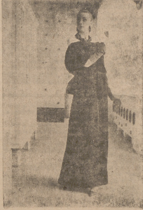
ALTA COSTURA ESPAÑOLA.—De espolonísima habremos de calificar esta creación de Santa Eulalia. El elegante vestido de noche está confeccionado en terciopelo de algodón negro y en el cuerpo, entallado y sin tirantes, luce un precioso bordado de azabache y cristal. El echarpe con el que el modelo se cubre los hombros es del mismo terciopelo que el vestido, y puede utilizarse como capucha.

Para ilustrar el concepto, queda reflejado un aspecto de la moda (en este caso alta costura para otoño-invierno 1962-63), en cuatro modelos recientes de otros tantos países.