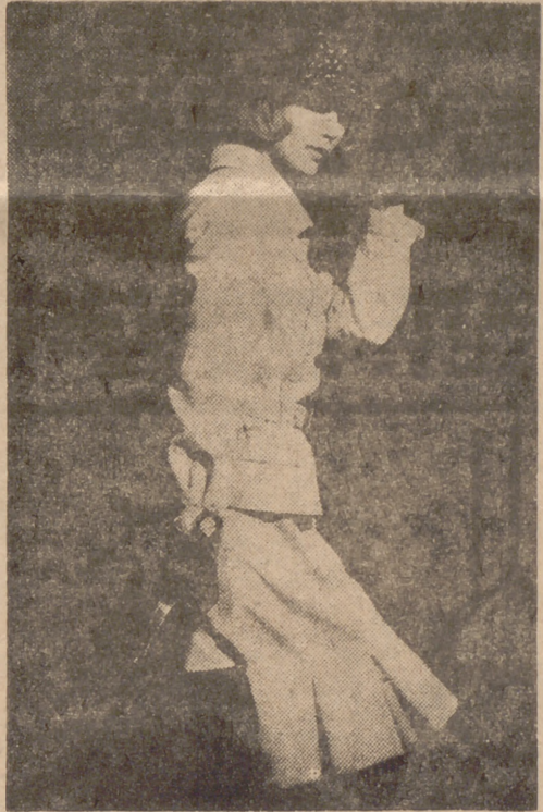
ALTA COSTURA PARISIENSE.—Hermes ha creado este original truje de casa, confeccionado en terciopelo de algodón mil rayas color beige. Completa el conjunto un pequeño sombrero de plumas.