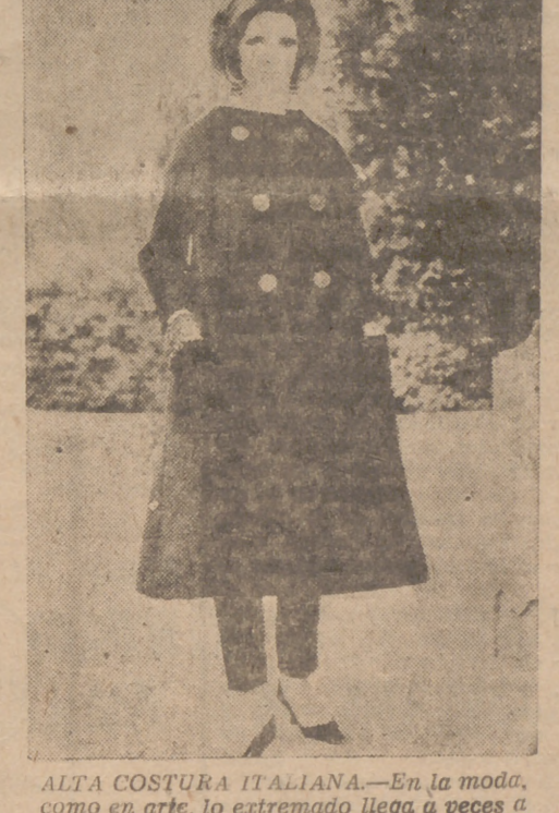
ALTA COSTURA ITALIANA.—En la moda, como en arte, lo extremado llega a veces a rozar muy de cerca lo extravagante. O, por lo menos, esto nos hace pensar este modelo de Enzo compuesto de pantalones largos de velludillo de algodón y largo blusón de pana en tonalidades oscuras.