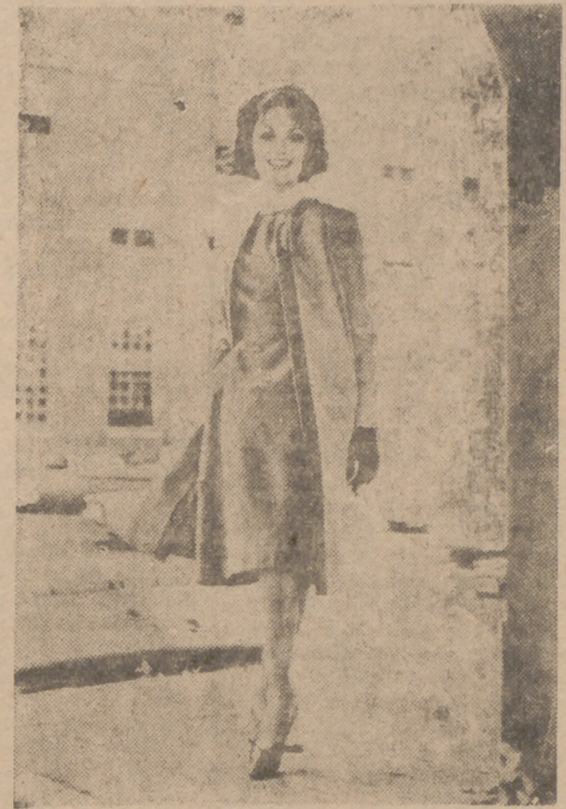
ALTA COSTURA NORTEAMERICANA.—Original tres piezas diseñado por Bill Atkinson de Glen of Michigan. El abrigo es de gruesa sarga de algodón con rebordes de velveteón. El vestido, que acusa marcada tendencia hacia la línea A, es también de velveteón. La blusa interior es de muselina de algodón irruugable.