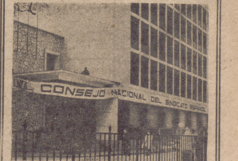
CUNCA.—Se celebra en la capital congreso el IV Consejo Nacional del Sindicato Español Universitario. Después de la reunión de la Comisión Permanente ha comenzado la primera reunión plenaria. He aquí el edificio donde tiene lugar el Consejo.