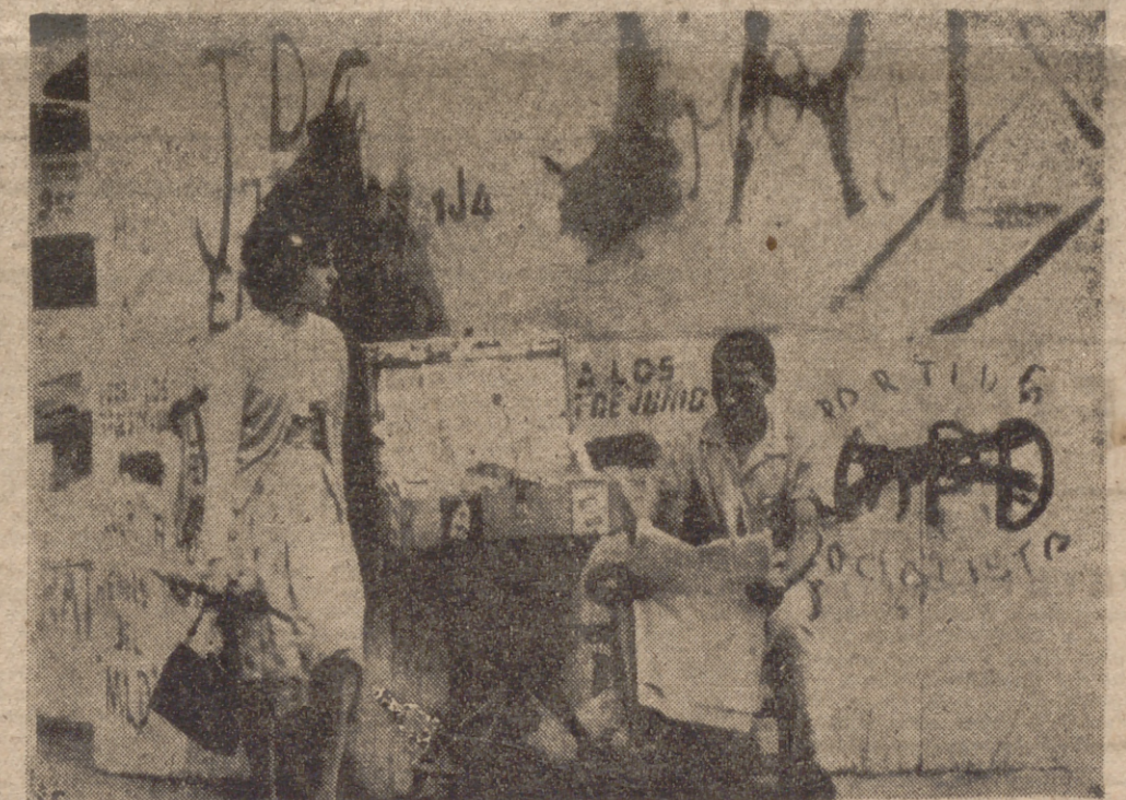
SANTO DOMINGO.—Un vendedor ambulante lee las noticias sentado de espaldas a una valla llena de iniciales de los diferentes partidos que luchan por el poder. Por primera vez en casi cuarenta años la República Dominicana celebra elecciones presidenciales, en las que participan veintiocho partidos.