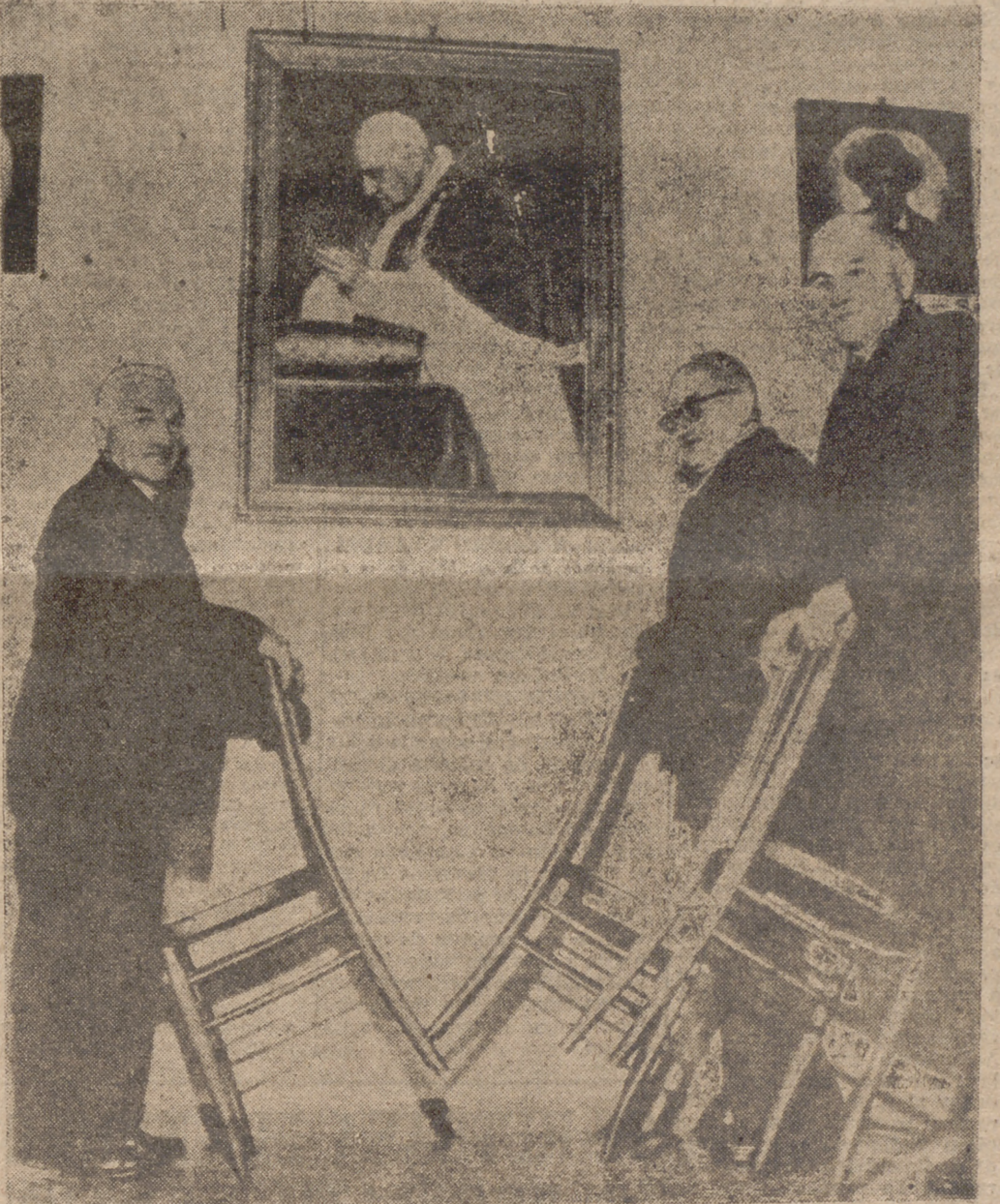
Los hermanos del Papa, Giuseppe, Angelo y Zaverio Roncalli, en su casa de Soto il Monte, rezan ante un cuadro de Su Santidad por su salud. El delicado estado de Juan XXIII se refleja en la preocupación de sus hermanos.