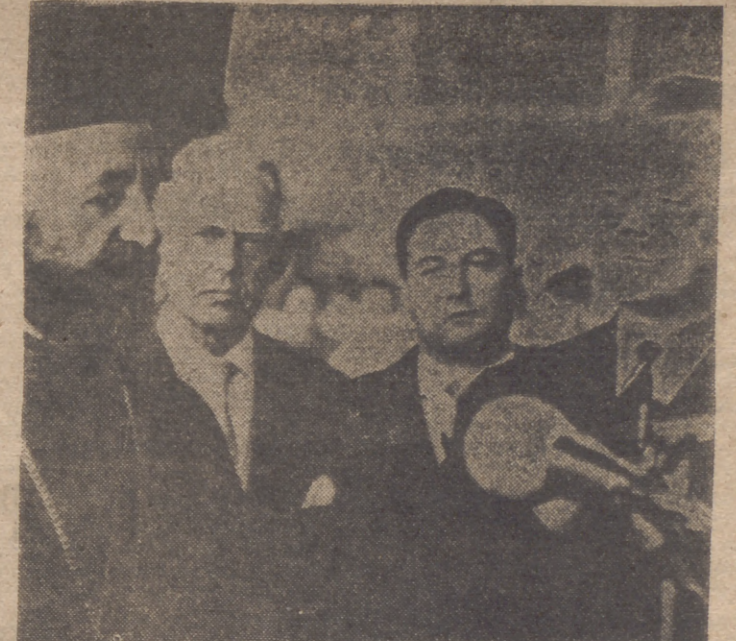
El arzobispo Makarios, presidente de la República de Chipre, ha visitado Berlín. En la foto, el arzobispo Makarios y el alcalde de Berlín, Brandt, al intercambiar los primeros saludos, a la llegada del primero, en avión especial, al aeropuerto de Tempelhof, en Berlín libre.