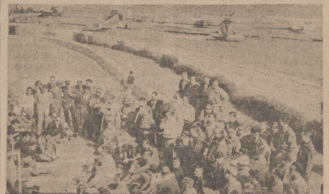
GETAFE (Madrid).—Desde el aeródromo de Getafe salieron las avionetas que toman parte en la Vuelta Aérea a España, comenzada con tan mala fortuna. La foto muestra, a los participantes recibiendo instrucciones antes de emprender el vuelo.

Madrid, 5.—A las nueve y media de la mañana ha tomado la salida, desde el campo del Real Aero Club de España, en Cuatro Vientos, la primera avioneta que participa en la Vuelta Aérea a España, para cubrir el recorrido Madrid-Sevilla, o Madrid-Córdoba-Sevilla, según el tipo y potencia de la misma.