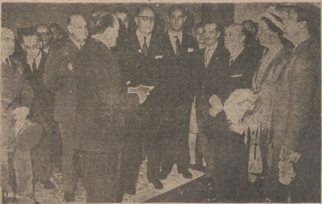
S. E. el Jefe del Estado, con su distinguida esposa, visita la Exposición Zuloaga, abierta en la Biblioteca Nacional.