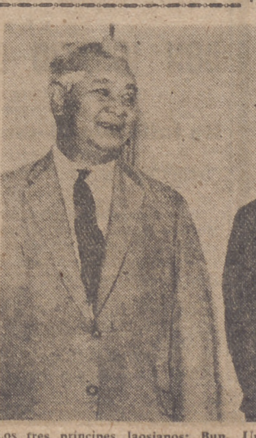
Los tres príncipes laosianos: Bun Um, Suvanna Fuma y Soufanyong.

Kennedy se reunió con el astronauta, que iba acompañado de su esposa y de sus cinco hijos, primeramente en su despacho de la Casa Blanca, acompañándoles luego a otra habitación de la residencia presidencial, donde era esperado por numerosos periodistas y fotógrafos.—Efe.