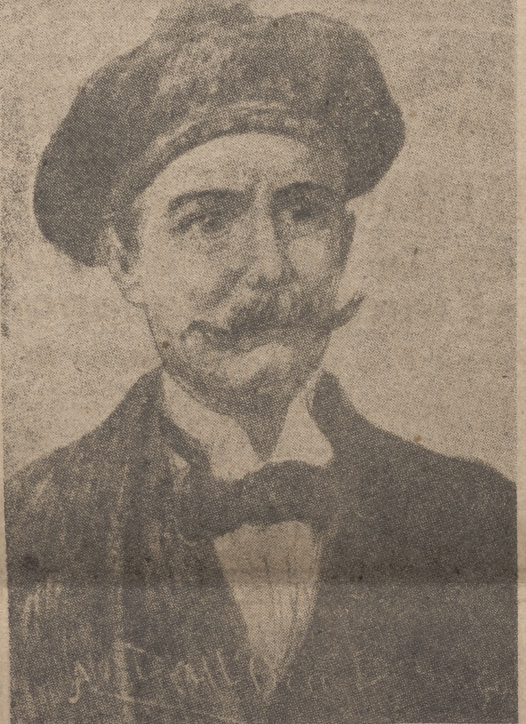
Esta carta era para sus editores.

Nadie crea que son nombres de héroes salgarianos. Simplemente, son los nombres de sus cuatro hijos. Era buen padre; jugaba con ellos de un modo que haría feliz a cualquier chiquillo; iba al bosque y allí inventaba aventuras. De repente aparecía Yáñez con los ligres y Sandokan daba un salto