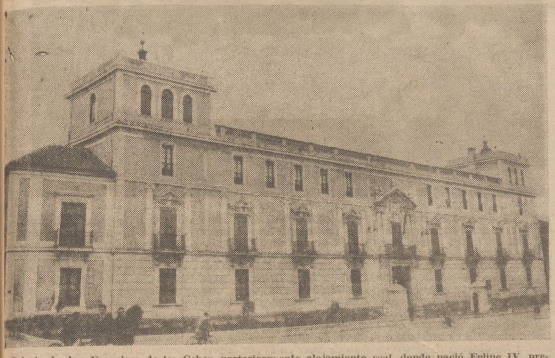
Palacio de don Francisco de los Cobos, posteriormente alojamiento real, donde nació Felipe IV, precisamente un Viernes Santo, con volteo general de campanas, aunque parezca extraño. Hoy es Capitanía General.