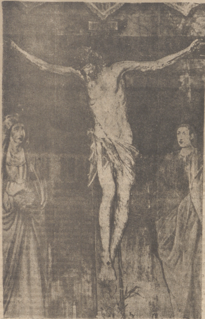
Cristo, de Francisco de Rincón. Arrabal de Portillo. Escuela castellana de principios del XVII.

Por F. WATTENBERG Director del Museo Nacional de Escultura