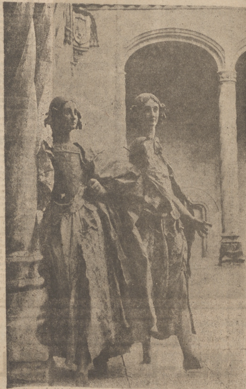
Arcoángeles. Anónimo. Escuela italiana de principios del XVII. Museo Nacional de Escultura.

Antes de los «pasos» de capelón, preludio movido y gracioso (reco-