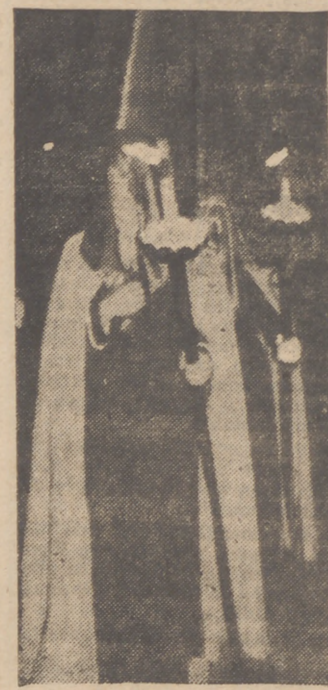
de David', ante cuya estrofas y notas vemos año tras año avanzar majestuosa la imagen del Redentor sobre su humilde cabalgadura trabada entre un mar de palmas doradas, como la ilusión inocente de los niños.