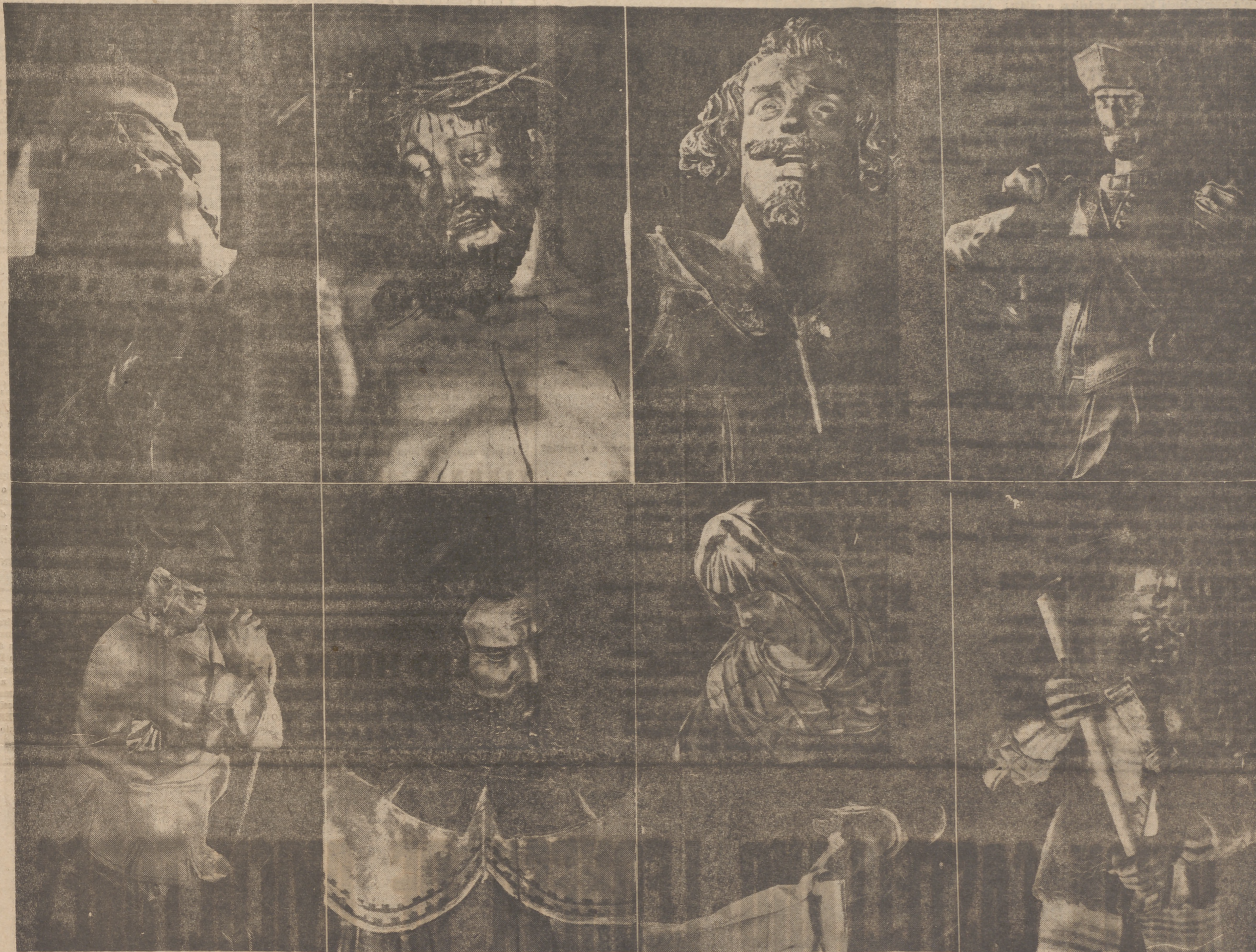
9, 10 y 11: GREGORIO FERNANDEZ. PASO DE "CRISTO EN LA CRUZ". DETALLES. MUSEO.—12, 13, 14 y 15: PASO DE "CRISTO CON LA CRUZ A CUESTAS". GREGORIO FERNANDEZ. MUSEO.—16: JUAN DE AVILA. PASO DEL "RODOPELO". MUSEO.