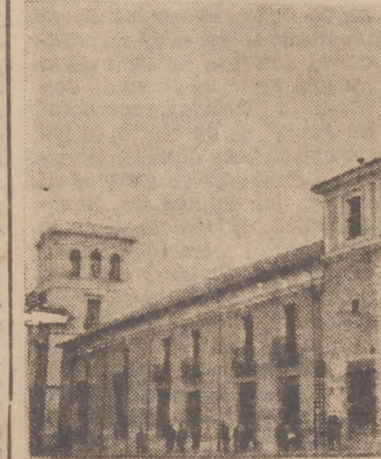
Palacio de Benavente, cuna de Felipe II, inmueble que ha servido para diversos menesteres, singularmente en el siglo XIX. Hoy es Diputación Provincial.