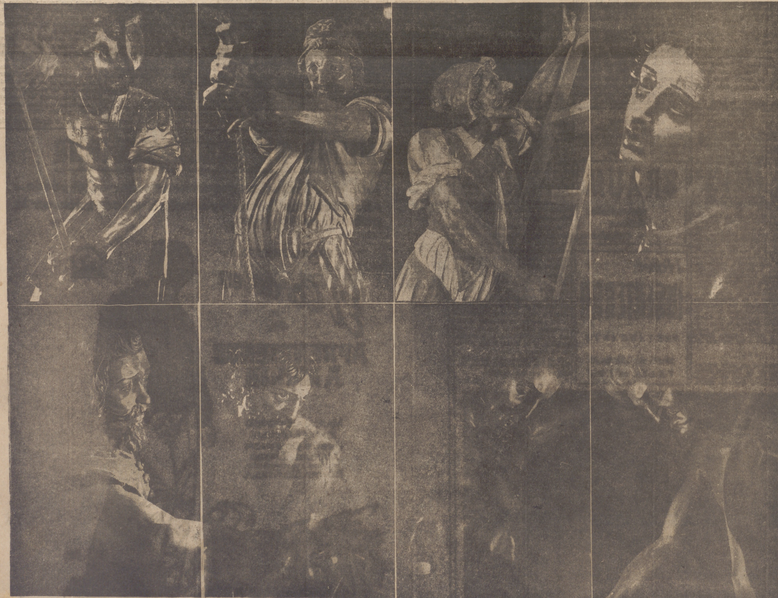
1, 2 y 3: FRANCISCO DE RINCON, PASO DE "LA EL EVACION DE LA CRUZ". DETALLES. MUSEO.—4: GREGORIO FERNANDEZ, PASO DE "LAS SIETE PALABRAS", MAGDALENA. DETALLE. MUSEO.—5: GREGORIO FERNANDEZ, PASO DE "CRISTO EN LA CRUZ". SAYON. DETALLE. MUSEO.—6: GREGORIO FERNANDEZ, PASO DE "CRISTO ATADO A LA COLUMNA", VERA CRUZ.—7: GREGORIO FERNANDEZ, DIMAS. MUSEO.—8: GREGORIO FERNANDEZ, PASO DE "CRISTO EN LA CRUZ" DETALLE. MUSEO.