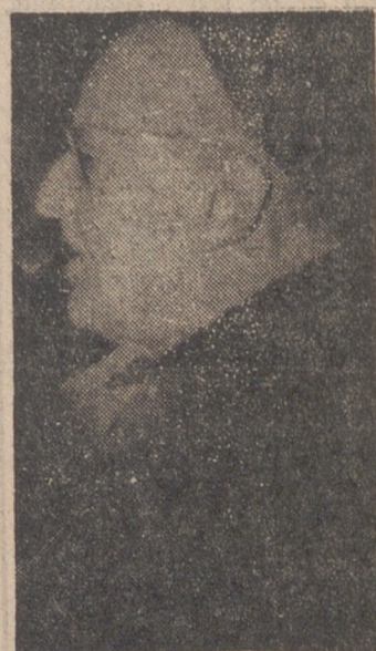
El arzobispo de Valladolid, doctor García Goldaraz, en un momento de su exhortación a la muchedumbre de fieles que asistió en la Plaza Mayor al acto inaugural de la Misión General.

Muchos niños ocuparon los bancos de la iglesia de los Agustinos en los actos de media mañana y media tarde a ellos dedicados.