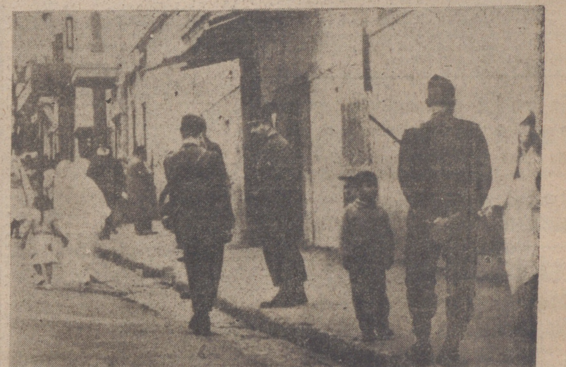
ARGEL.—El servicio de Orden Público ha sido reforzado en la Casbah. La foto muestra a los soldados zouaves (argelinos del ejército francés) y gendarmes patrullando por las calles del barrio moro.

Se dice también que existe desacuerdo entre ambas delegaciones en cuanto a la retirada de tropas francesas de Argelia. Según los planes actuales, Francia retirará la mayor parte de sus fuerzas del territorio norteafricano después del alto el fuego, dejando un fuer-