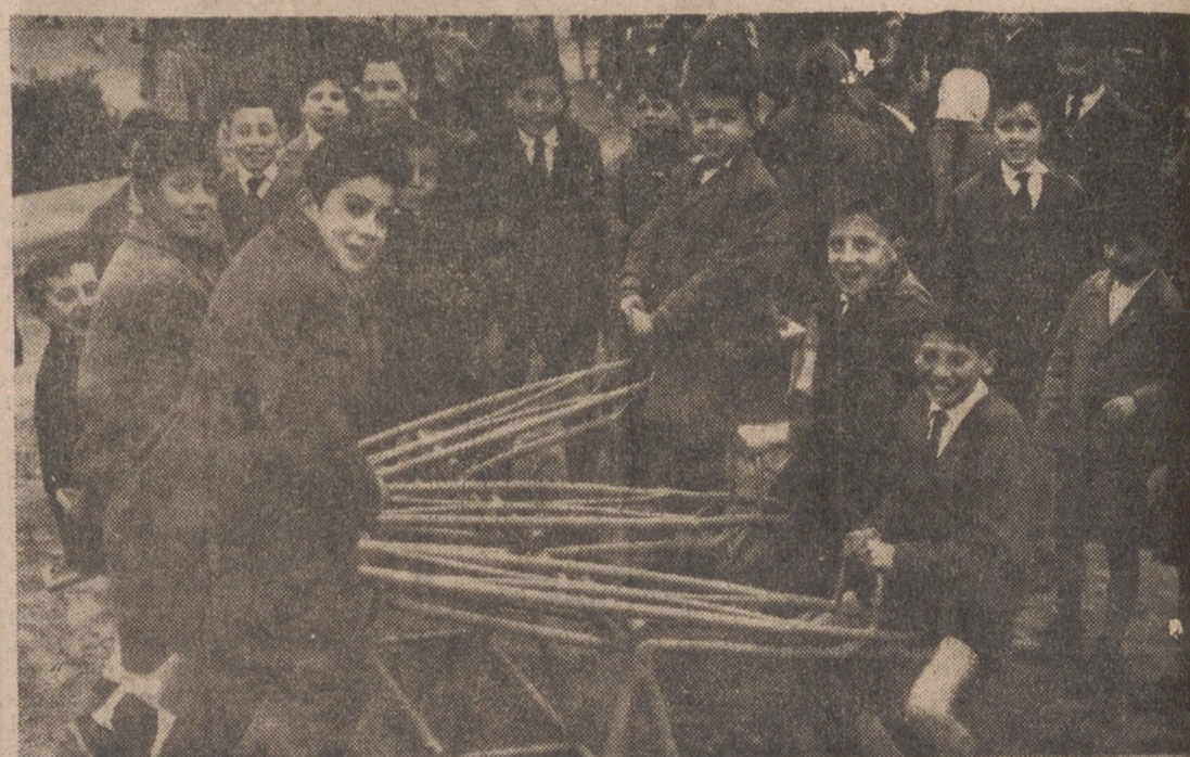
Inaugurado el Parque Infantil, los niños de la barriada estrenan los modernos columpios instalados en el mismo.

Finalizado el acto, el Alcalde visitó las escuelas gratuitas regidas por los PP. Jesuitas, construidas en el mencionado barrio, elogiando las instalaciones y funcionamiento de las mismas, quedando la primera autoridad municipal muy complacido de la grata visita que había realizado, al igual que sus acompañantes.