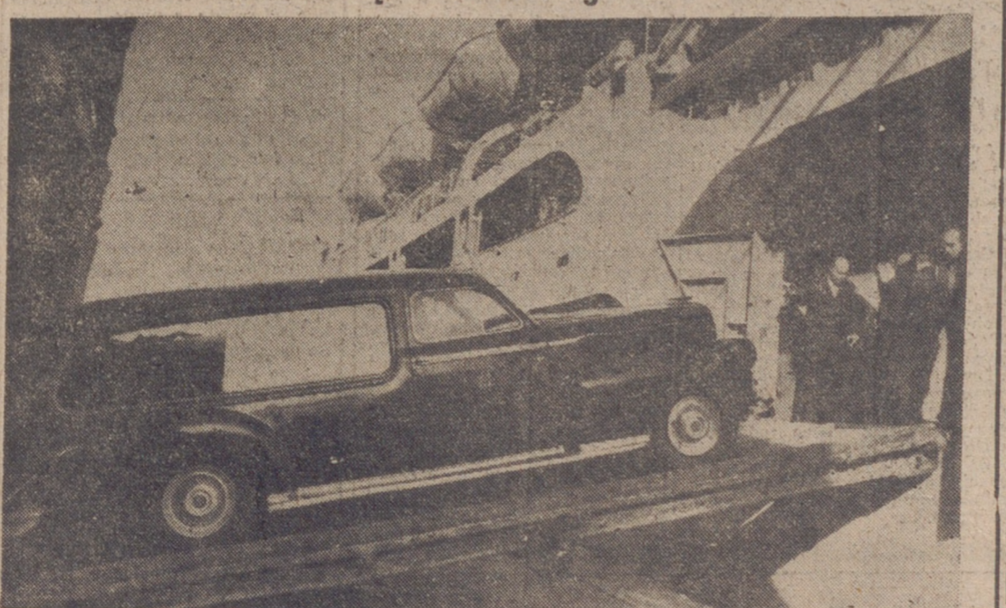
VALENCIA.—Momento en que el coche fúnebre que transporta los restos mortales de don Juan March sube a bordo del vapor "Ciudad de Barcelona" para ser trasladados a la capital balear.—(Foto Cifra.)

Autoridades, amistades y numeroso gentío asistieron al acto