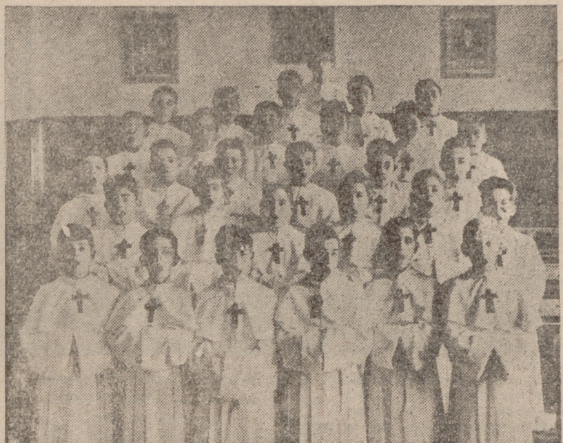
Sección de típicos de la Escolanía La Salle, con el hábito de "Pueri Cantores".

gracias a la unión y entusiasmo entre los niños y la abnegación cariñosa de sus directores, y hoy, la Escolanía camina por rumbos certeros, siendo una gloria más para el Colegio e incluso, en ocasiones, para nuestra ciudad.