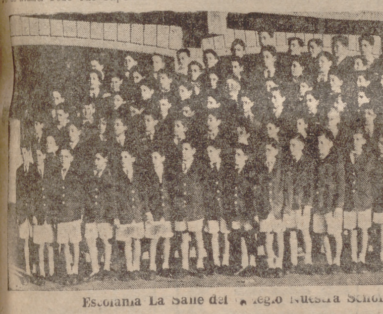
Escolanía La Salle del Colegio Nuestra Señora de Lourdes.

Actualmente se compone de más de un centenar de niños, distribuidos en cuatro voces.