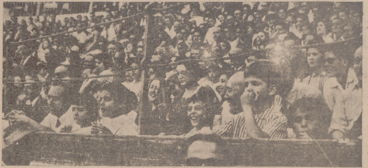
La plaza se llenó con predominio del elemento infantil, que lo pasó en grande.