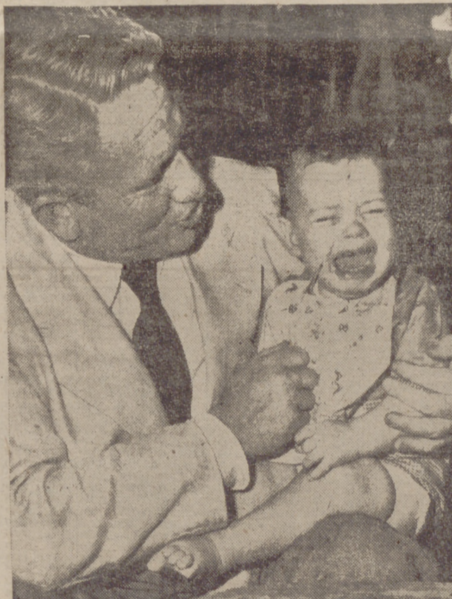
Spencer Tracy, en "El padre es abuelo".

Stanley Cortez, hermano del veterano actor de la pantalla Ricardo Cortez, está trabajando como camarógrafo en la película "Melville Goodwin", en que las estre-