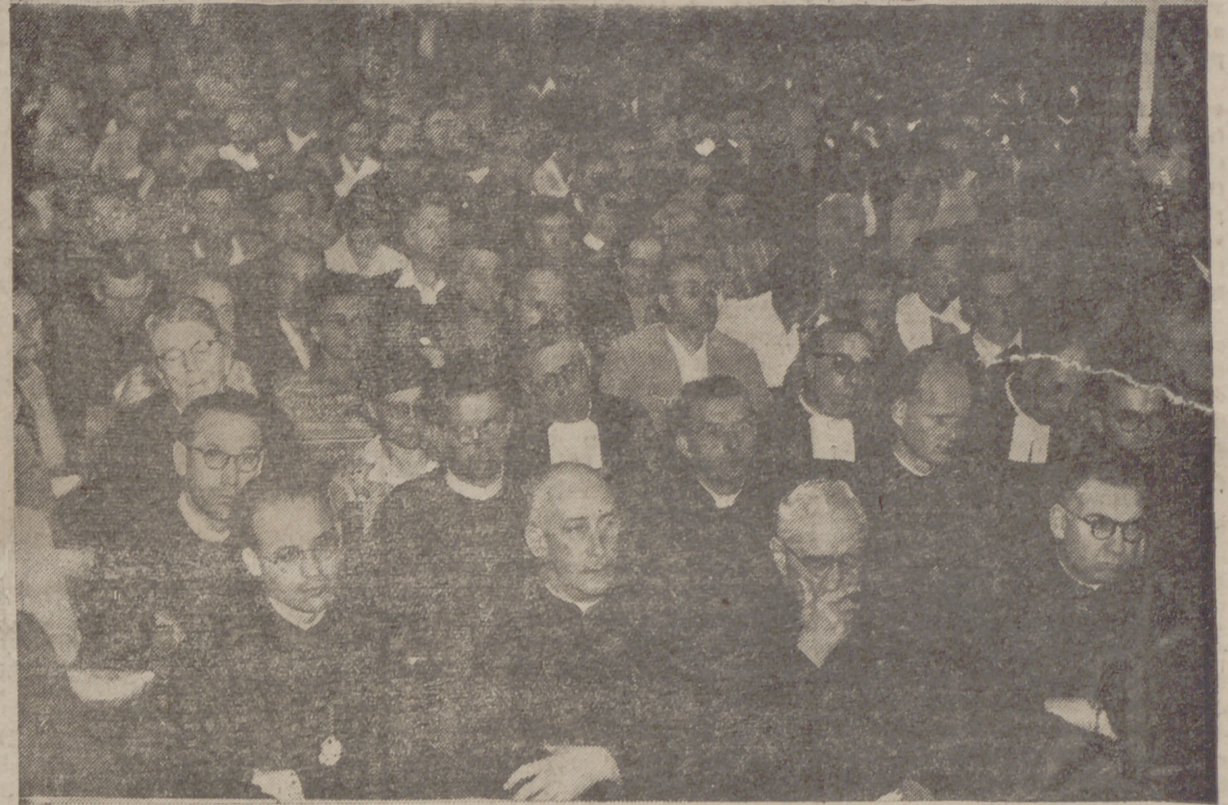
Un aspecto del Aula Magna durante la conferencia de ayer.