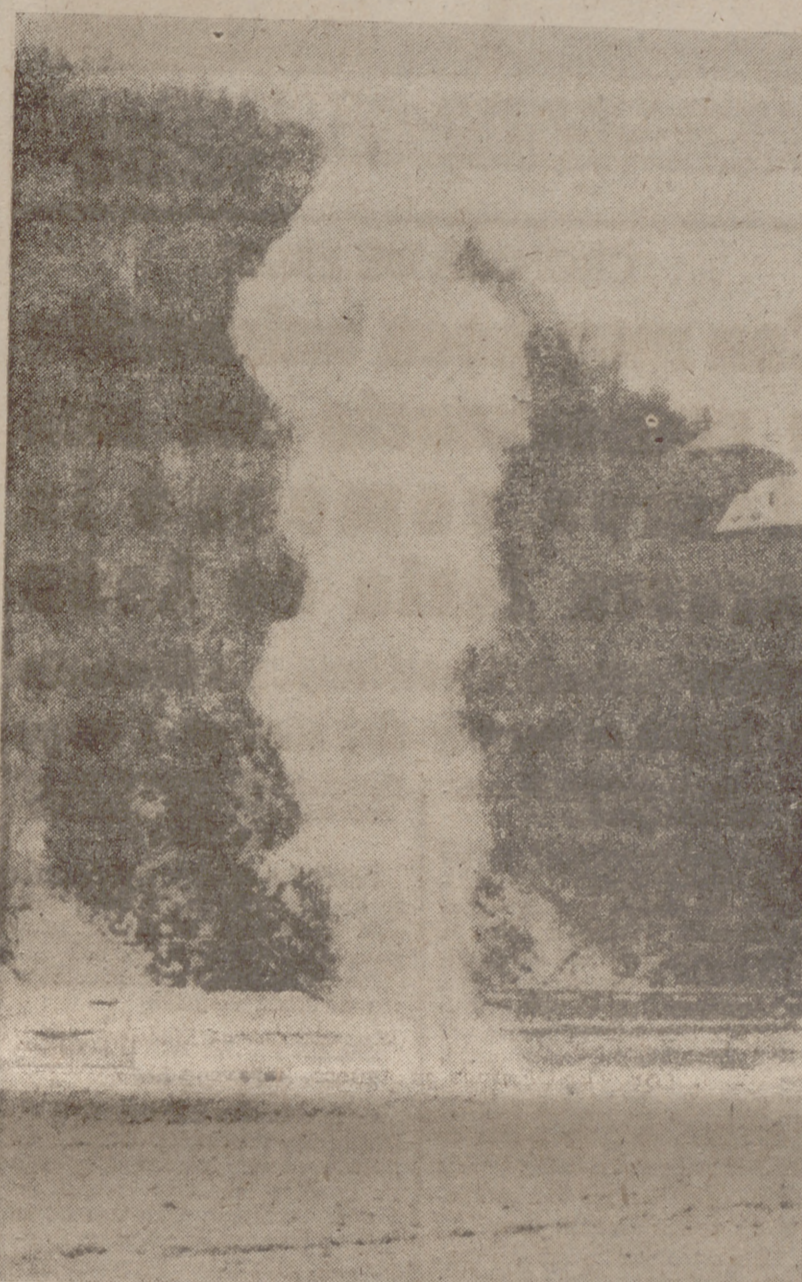
Las aguas del Danubio, bloqueadas por enormes masas de hielo, tienen que ser ayudadas en su plácido discurrir de "rio divino" por potentes cargas de dinamita que se hacen explotar en puntos esencialmente estratégicos para favorecer la vuelta a la normalidad de la poética corriente que, como ya se sabe, oscila entre los colores rojo y azul.