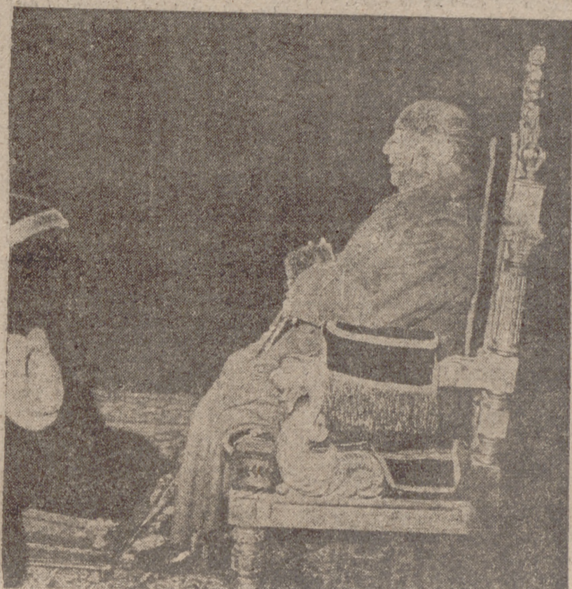
San Lorenzo del Escorial.—Su Excelencia el Jefe del Estado durante el solemne funeral celebrado en el templo de este Monasterio.

El Gobierno, el Cuerpo diplomático y otras altas jerarquías asistieron al acto